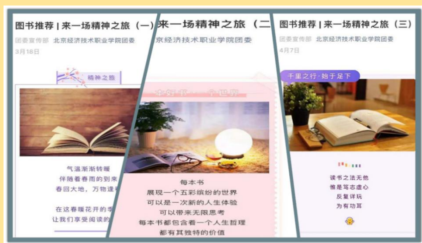
图 3：图书推荐，来一场精神之旅