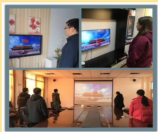
图2：“开学第一课 共抒爱国情”网络升旗仪式

3月2日是北京经济技术职业学院2019-2020学年第二学期开学的日子，然而因新冠肺炎疫情的来袭，师生们只能暂不返校。“停课不停学”，在非常时期，为激发全校师生的爱国情怀，增强全校师生的民族自信心和凝聚力，体现新学期开学的仪式感，让居家学习变得更有意义，学校举行了“开学第一课 共抒爱国情”网络升旗仪式。通过仪式教育，坚定全校师生新学期要更加积极进取、拼搏担当的决心和信念，增强当代教师和大学生的使命感和责任感。