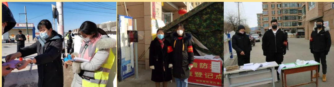
图 8-10：学习雷锋好榜样 北经学子抗疫显担当

在这场新冠肺炎疫情的严峻考验中，我校数十名青年学子于危难中显担当逆行而上，守护家园在居住社区成为一名抗疫志愿者，力所能及地参与疫情防控志愿服务为战“疫”贡献青春力量。