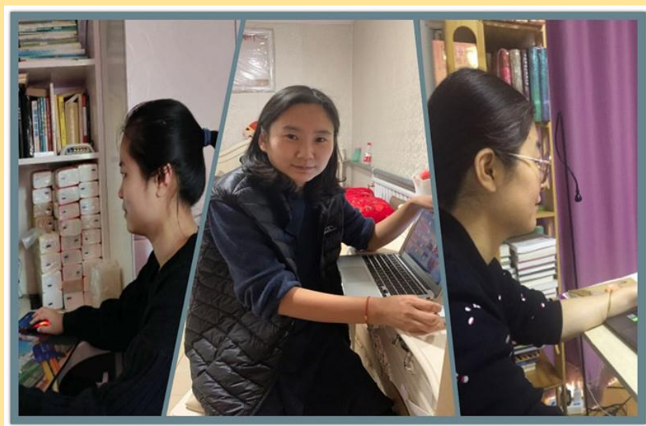
图 1：辅导员在线给学生做思想教育辅导