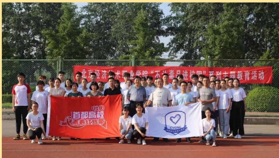
图 6：“不让毒品进校园”主题教育活动

在第 16 个国际禁毒日来临之际，我校为进一步加深学生对毒品危害的认识，增强学生禁毒斗争的意识和抵抗毒品的能力，进一步加强毒品预防教育工作，创建无毒学校，6 月 10 日在田径场举行“不让毒品进校园”系列主题教育活动启动仪式。