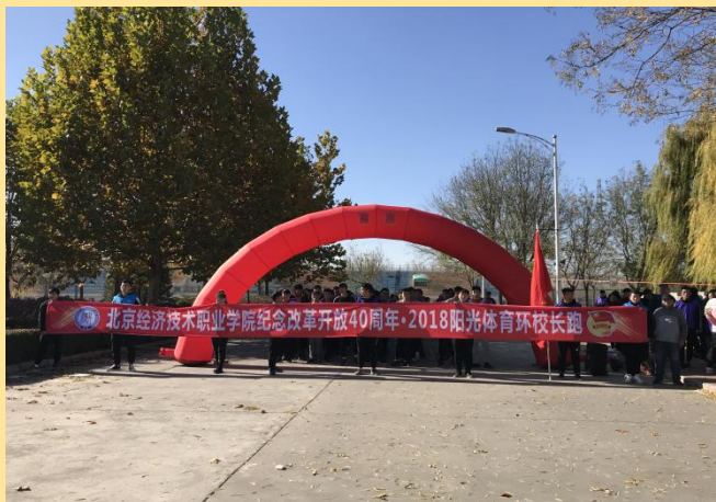
图 7：“与改革开放同成长 与北经发展共奋进”庆祝改革开放40周年环校长跑活动

为引导和激励广大师生牢记改革开放的艰辛、困难、风险和挑战，初心不改、矢志不渝，坚定地走中国特色社会主义道路，为学校发展贡献青春力量。2018年11月9日，我校开展了“与改革开放同成长 与北经发展共奋进”庆祝改革开放40周年暨2018阳光体育环校长跑活动，以展现当代大学生、青年教职工和志愿者良好的精神面貌，坚定不怕累、肯坚持的信念。