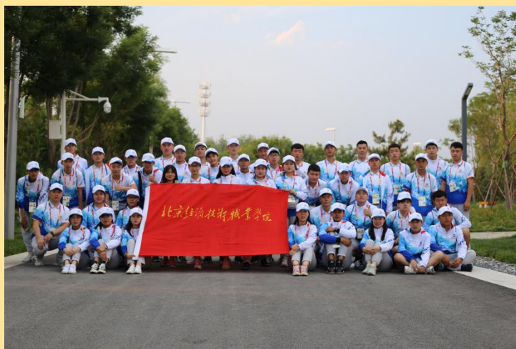
图 10：“2019 中国北京世界园艺博览会”志愿服务

2019 年 6 月 16-23 日，我校 45 名青年志愿者顺利完成连续 8 天的世园会志愿服务工作，志愿者们为国内外游客提供热情、高效、优质的服务。他们的服务受到了世园局、各展馆工作人员及游客的高度赞赏。他们以志愿者的身份，展现中国青年的风采，传承志愿精神，用汗水和微笑服务 2019 中国北京世界园艺博览会。