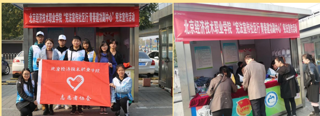
图 8-9：“宪法宣传社区行”志愿活动

为了让广大人民群众更好的知法、懂法、守法、用法，我校于2018年10月13日至2018年10月20日，分别在燕郊的燕京新城、纳丹堡社区、通州区志愿服务岗亭和学校教学楼展开了以“宪法宣传社区行 青春建功副中心”为主题的宪法宣传志愿活动。通过此次宪法宣传活动不仅对社区宣传起到了普法的作用，而且还提高了参加活动志愿者的法律意识。此次宪法宣传志愿活动效果较为显著