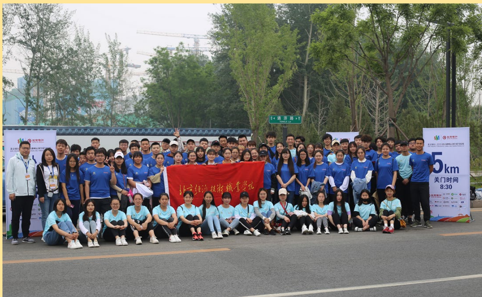
图 11：“2019 北京通州运河半程马拉松”志愿服务

2019年5月12日，由中国田径协会、北京市通州区人民政府、北京市国有资产经营有限责任公司共同主办的2019北京通州运河半程马拉松在通州开跑。我校100名青年志愿者服务此次赛事。