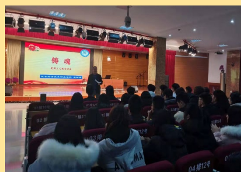
图1：“我和我的祖国”爱国主义教育大讲堂教育活动 图2：爱国主义教育大讲堂