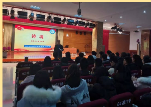
图1：“我和我的祖国”爱国主义大讲堂教育活动 图2：爱国主义大讲堂