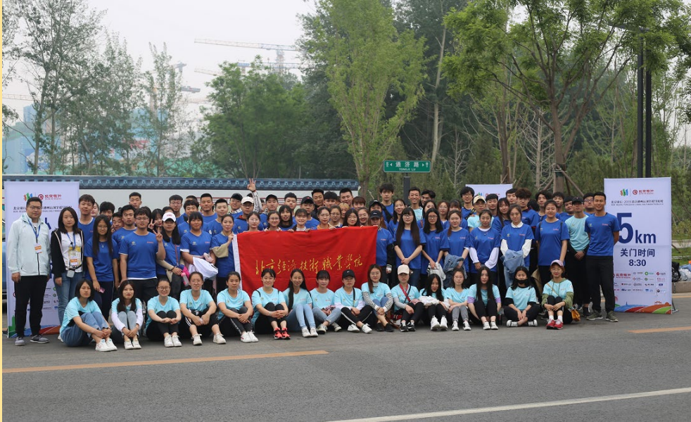
图 11：“2019 北京通州运河半程马拉松”志愿服务

2019年5月12日，由中国田径协会、北京市通州区人民政府、北京市国有资产经营有限责任公司共同主办的2019北京通州运河半程马拉松在通州开跑。我校100名青年志愿者服务此次赛事。