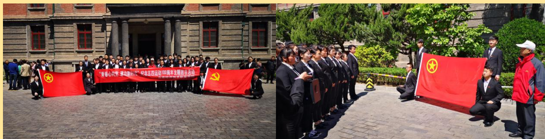
图 5: “青春心向党 建功新时代”纪念五四运动 100 周年主题教育活动

为纪念五四运动 100 周年, 坚定学生的理想信念, 追忆革命故事, 缅怀英雄先烈, 传承五四精神, 4 月 25 日, 学院优秀学生代表参观北大红楼纪念馆, 开展“青春心向党 建功新时代”纪念五四运动 100 周年主题教育活动。此次参观活动不仅激发了我校学生的爱国热情, 坚定了理想信念, 更增加了在校大学生团结奋斗的使命感和责任心, 强化了同学们为实现中华民族伟大复兴中国梦而贡献青春、智慧和力量的决心。