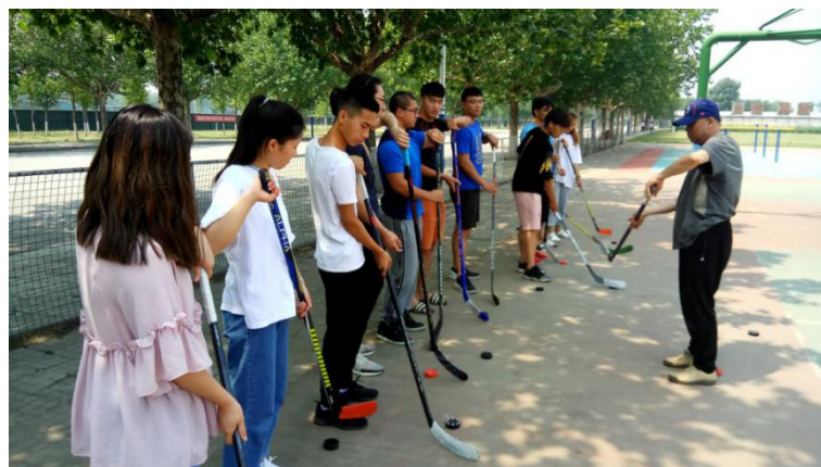
图：企业专家指导学生进行陆地训练

课程设置包括：冰球基本技术，冰球战术组合练习，冰球实战训练，体能专项训练，冰上安全知识，护具知识及适用方法，冰球运动发展概述、冰球竞赛与组织，冰球教学、球队组建等。