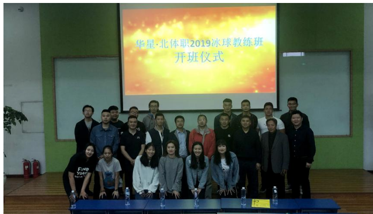
图：第一期冰球教练培训班开班仪式合影

为充分发挥校企双方的优势，发挥职业教育为社会、行业、企业服务的功能，为企业培养更多高素质、高技能的应用型人才，同时也为学生实习、实训、就业提供更大空间。华星集团与北京体育职业学院展开战略合作，并与 2019 年启动了第一期冰球教练培训班。