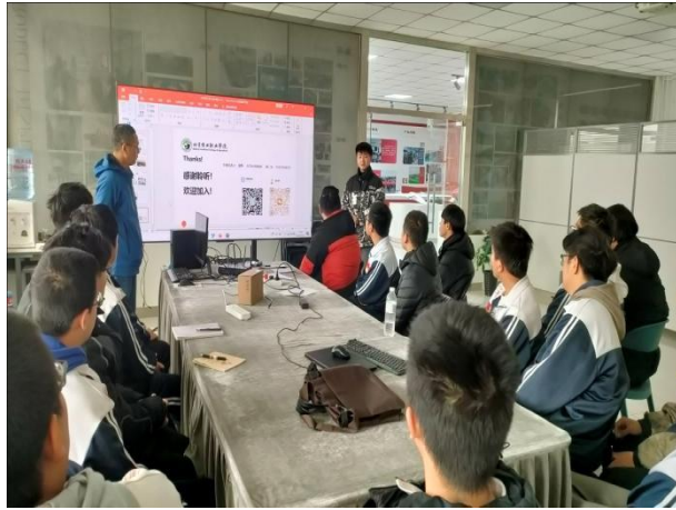
图 11 中职学生听北京农业职业学院专业介绍

中高职双方从解决企业需要什么人就培养什么人的问题为切入点，在人才培养的修订、教学实施、实习实践、考核评价、测评转段等全方位进行无缝对接。实现了共享优秀的师资资源、实践教学资源等，为学生打造了顺畅的中高职发展之路。