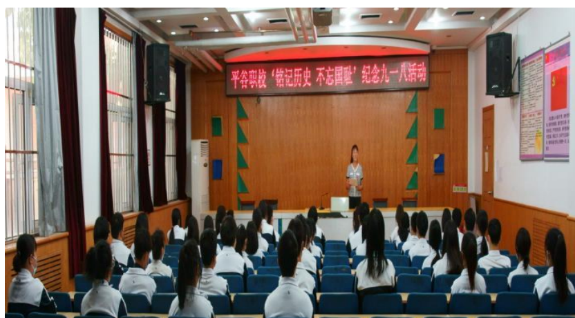
图 33 平谷区职业学校开展“纪念 9·18，勿忘国耻”主题教育活动