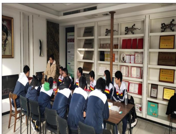
图 9 企业专家带领设施农业生产技术专业师生进行食品安全检测试验