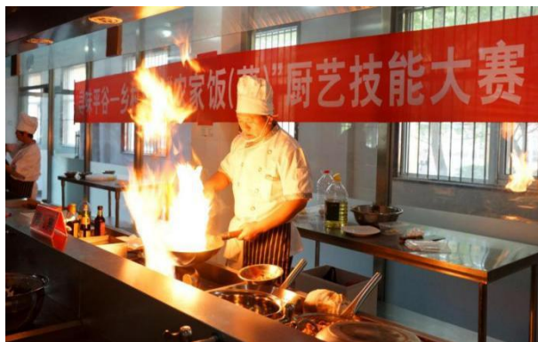
图 21 “寻味平谷”——农家菜厨艺技能大赛比赛现场

为推进平谷美食文化与乡镇特色产业相融合，挖掘餐饮文化内涵，树立美食文化品牌、推动旅游业、餐饮业发展。2023 年 5 月 30 日来自金海湖镇、镇罗营镇、大华山镇、熊儿寨乡、黄松峪乡和平谷区职业学校的 11 支参赛队、22 名选手参加厨艺竞技。厨艺内容分为热菜、面点两类：炒菜包括指定菜、抽签菜、创新菜；面点包括指定面点和创新面点。比赛共评选出一等奖 2 个、二等奖 4 个、三等奖 5 个。通过大赛，给民俗旅游经营者们提供一个互相学习共同提高的机会，搭建展示烹饪才艺的舞台。