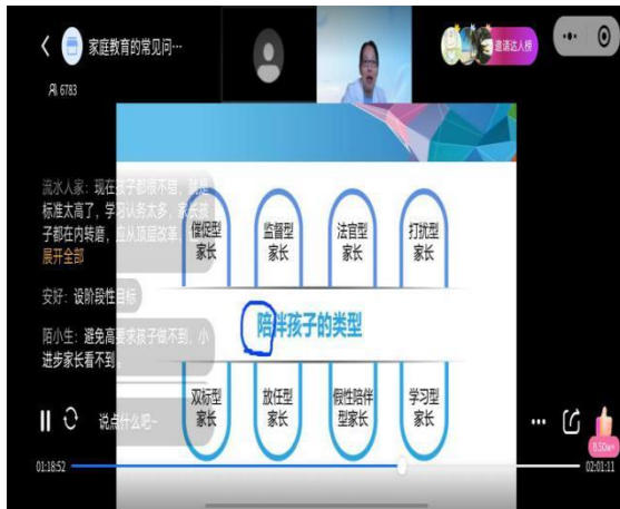
图 1 家校共育大讲堂线上讲座

我区坚持用“拥非凡的爱，做平凡的事”的师德信念引领教师队伍建设，注重班主任队伍建设和班级建设，打造有态度的学校，做有温度的教育。对职业学校学生家庭开展调查，并根据家长学历低、收入少、父母离异率高、隔代抚养多的家庭情况采取更加有针对性的家校共育措施，建立“三走进，四必访”家校沟通长效机制，通过家长委员会、家长会、家访、校园开放日等形式，走进学生家庭和将家长请进学校，以爱润心，启智养德开展家校共育教育。开设家校共育大讲堂，聘请在教育领域有建树的知名专家针对当前家庭教育的热点和难点问题，通过线上线下相结合的方式，面向全区广泛宣传科学家庭教育方法，引导广大家长正确育儿、科学育儿，与学校形成合力，助力学生健康成长。2023 年家校共育大讲堂活动共开展 14 期，线上线下参与人次达 81702 人次，该项目获评北京市 2023 年度终身学习品牌项目。