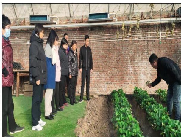
图 8 企业专家对设施农业生产技术专业教师进行培训指导

根据区域发展需求，平谷区职业学校与北京农业职业学院、北京嘉华种猪育种有限公司联合成功申报“农业中关村园区市域产教联合体”。学校积极与本区优质设农企业进行合作，与北京博田农业技术有限公司签订校企合作协议，学校在企业挂牌设立“平谷区职业学校设施农业生产技术专业实习基地”、“平谷区职业学校校外劳动教育实践基地”、“平谷区职业学校农民培训基地”。提升设施农业专业师生的专业技能水平，为区域经济发展储备人才。