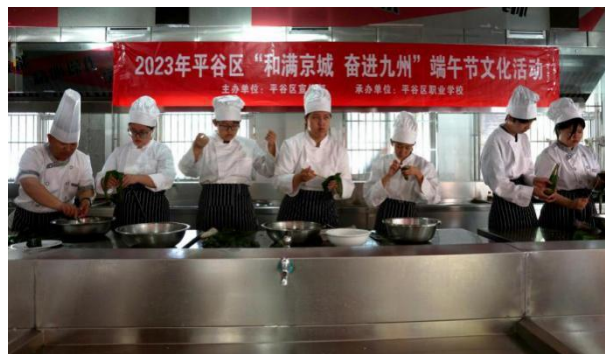
图 28 “和满京城 奋进九州”端午节文化活动