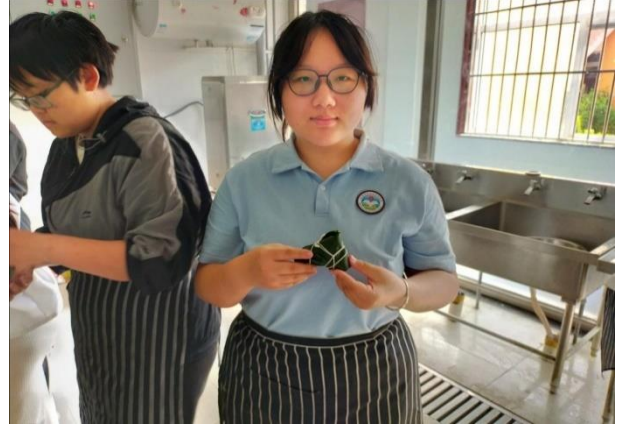
图 26 学生包粽子——“粽情”端午节