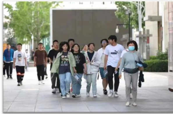
图 19 参加高职考试学生走出考场