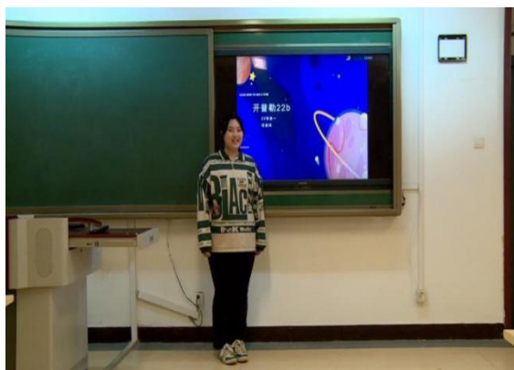
图6 学生录制航天 征文演讲视频

随着我国航空航天事业的蓬勃发展,学校新开设了航空航天知识社团,社团以国家航天事业取得的巨大成就为契机,先后开展了:航天科幻画、航天知识竞赛、航天知识征文演讲、航天模型制作等一系列健康向上、富有知识性、艺术性、多样性的社团活动,充分发挥社团文化在育人中的独特作用,培养学生的航天精神和爱国情怀,助力“三全育人”综合改革。一年来社团共组织6次大型社团活动,200多人参加了各种活动,社团推荐了10人参与市级航天科幻画比赛,2人参加市航天征文演讲比赛、1人荣获市级三等奖,一组学生参加北京市航天知识竞赛并荣获市级二等奖。