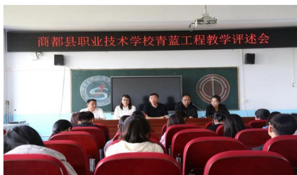
图 22 商都县职业技术学校青蓝工程教学评述会

业学校骨干教师，一位师傅为商都县职业学校优秀骨干教师，形成“2+1”师徒青年结对。师徒通过线上线下听评课、教学研讨、主题讲座、教学竞赛等形式开展工作。开展专题讲座三场，培训教师 213 人次，线上线下听评课 137 节，师徒研讨 12 次，徒弟们的教学设计能力、课堂组织能力等有了明显提升。商都县职业学校三位新教师在乌兰察布市教师教学能力大赛中分荣获三等奖。