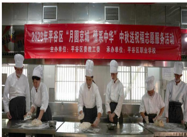
图 4 “月满京城 情系中华”中秋送祝福志愿服务活动