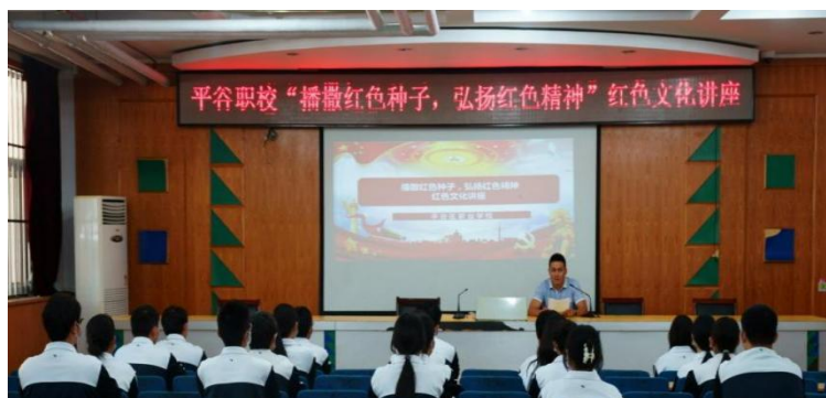
图 32 平谷区职业学校开展“撒播红色种子，弘扬红色精神”红色文化讲座。