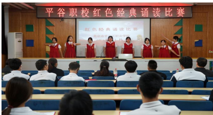
图 34 平谷区职业学校开展红色经典诵读比赛活动