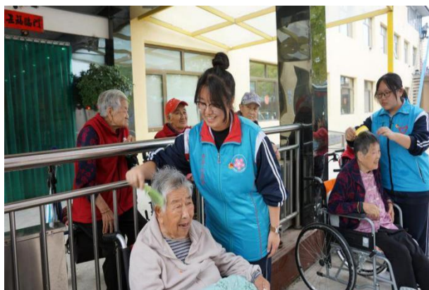
图 29 重阳节文化活动——走进东高村敬老院志愿服务