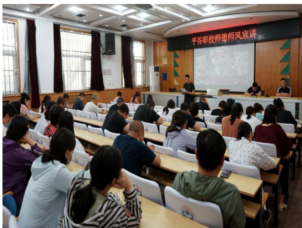
图 45 平谷区职业学校“师德师风警示教育大会”