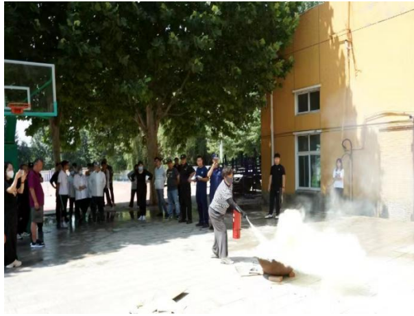
图 42 平谷区职业学校开展“一警六员消防培训考试”

常态化，重点部位人员重点管理，技防设备不断更新，食品安全有效保障，卫生工作持续推进，社会联动机制规范到位，实现了全年学校安全事故为零。