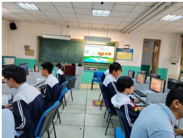
图 17 计算机技术应用专业学生进行图像处理技能大赛