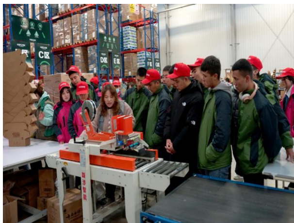
图 31 学校带领物流专业学生到企业参观实践