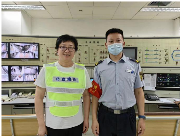
业教师进企业实践