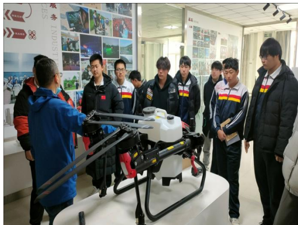
图 12 中职学生参观北京农业职业学院专业设备