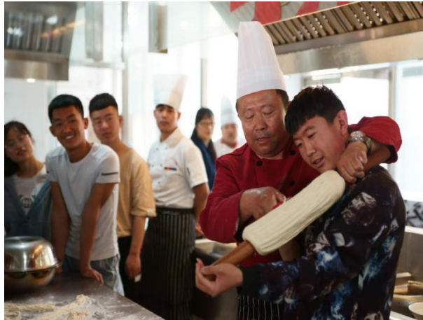
图 13 初中生参加烹饪专业体验活动——刀削面

学校成立职普融通课程开发小组，结合学校现有专业和初中生身心特点，开发了太阳能小汽车、泡菜的制作、液压挖掘机等职普融通课程，将职业教育的元素融入到职业体验课程中。在职业教育和普通教育之间搭建桥梁，为学生提供职业规划指导，引导他们选择适合自己的职业发展方向。通过这些做法，使学生对职业教育有了更全面的了解，提高了他们对职业教育的兴趣。