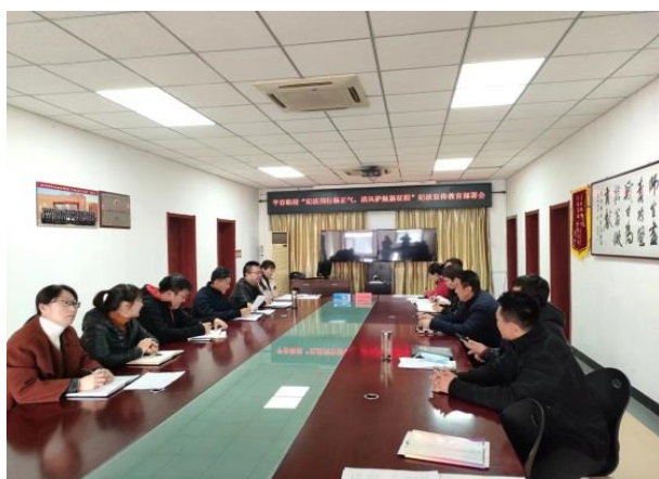
图 38 理论中心组会前学法

为扎实推动“纪法同行扬正气 清风护航新征程”主题教育月活动的深入开展，平谷区职业学校高度重视，精心谋划，用“七个一”方式，多层次、全方位开展“纪法教育月”活动，进一步强化党员干部纪法教育，引导广大党员干部加强作风建设，严守纪律规矩。一是理论中心组会前学法；二是组织全体党员观看警示教育片和二十大知识答题；三是召开主题党日活动；四是围绕廉政风险查找不足开展谈心谈话；五是改变工作思路，创新工作态度。