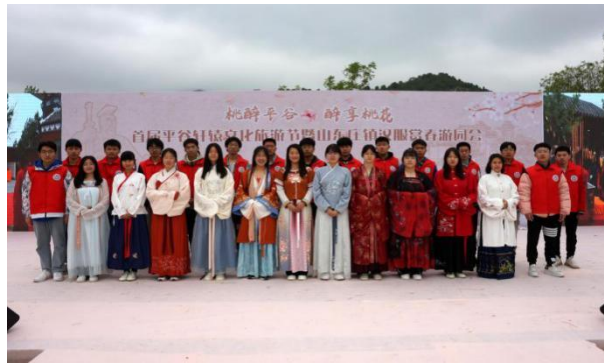
图 27 参加平谷区山东庄镇汉服赏春游园会志愿服务活动

为深入学习贯彻党的二十大精神，弘扬中华民族传统文化，落实立德树人根本任务，培养学生爱国之情，平谷区职业学校以多种形式开展主题教育活动，促进传统文化传承，共建特色文化校园。一是利用国旗下讲话倡导学经典、爱经典、用经典的文明习惯，开展“未来工匠”读书行动。组织学生早读、班会时间阅读党刊党报，历史、传统文化经典，并定期交流、撰写心得体会，培养阅读习惯；二是利用清明、五四、端午、中秋、国庆、重阳节、烈士纪念日等时间节点为契机开展主题教育活动。提升学生艺术底蕴、弘扬爱国主义精神。