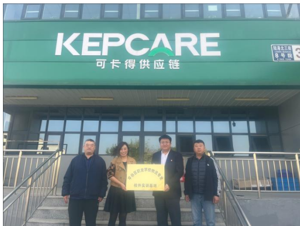
图 30 学校为北京信丰智仓供应链管理有限公司挂牌校外实训基地

平谷区职业学校为服务区域经济发展、助力高大尚平谷建设，申报了物流服务与管理专业，并与当地知名企业北京信丰智仓供应链管理有限公司开展校企合作，共同对学生开展技能教育和企业文化传播教育。带领学生走进企业，让学生了解企业文化的重要性和实践方法，亲身感受企业文化的氛围，让学生在实践中体会企业文化的内涵和意义。企业通过与学校的合作，传承和推广了自身的企业文化，提高了企业的社会形象和知名度。