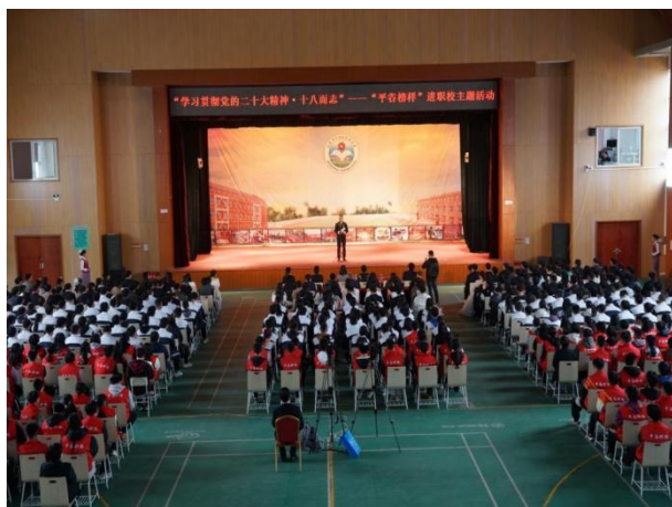
图5 “学习贯彻党的二十大精神，十八而志”——“平谷榜样”进校园活动