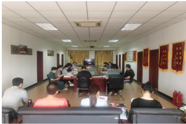
图 10 学校与合作企业的专家研讨、设计课程内容

我区职业学校多个专业与企业建立合作关系，校企双方成立专业指导委员会，把脉人才培养方向。一是校企双方定期开展研讨会。根据企业用人需求、岗位标准设计课程内容，培养企业真正需要的人才。二是邀请企业的技术骨干或专家作为课程导师，通过讲座、项目指导或实践课程等形式参与教学。三是与企业合作开展实践项目，让学生在真实的企业环境中应用所学知识。既可以提高学生的实践能力，还可以为企业提供创新思路和解决方案。