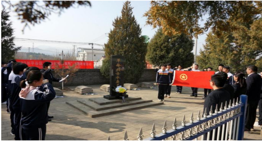
图 35 平谷区职业学校开展“绿谷红娃祭英烈”主题教育活动