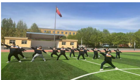
图 23 中华传统武术进课堂活动

平谷区职业学校根据党中央《关于培育和践行社会主义核心价值观的意见》和教育部《完善中华优秀传统文化教育指导纲要》等文件精神，始终坚持推进中华优秀传统文化进校园活动。先后开展了中华传统武术进课堂、中华经典文化诵读、中华优秀传统文化汉字书写（软、硬笔）、“粽情”端午节、校园篆刻等一系列具有传统特色的文化和技能活动，使学生在活动中感受传统文化和技艺的魅力，厚植热爱中华优秀传统文化的情怀，培养学生的文化自信。