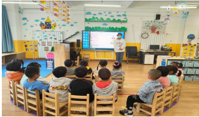
图 37 幼儿保育专业学生到幼儿园进行岗位实习