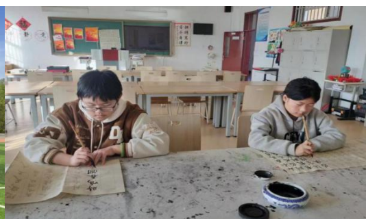
图 24 中华优秀文化软笔书法活动