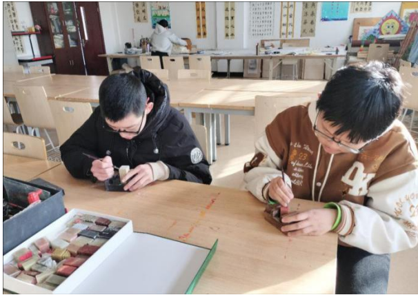
图 25 中华优秀传统文化篆刻活动