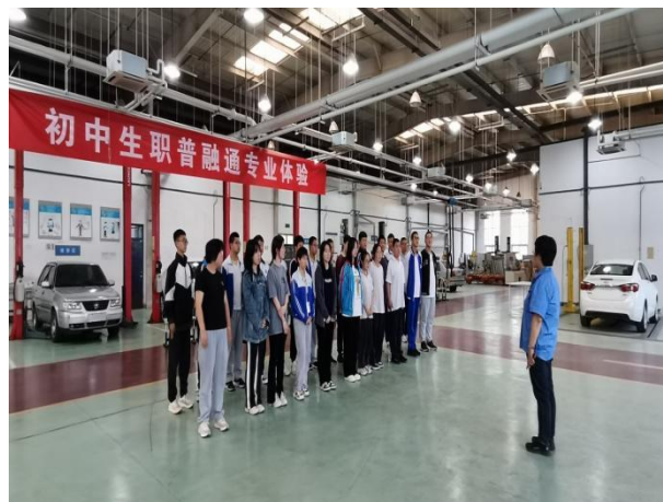
图 14 初中生参加汽修专业体验活动