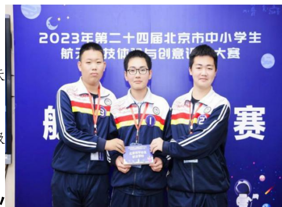
图7 学生参加市级 航天知识竞赛