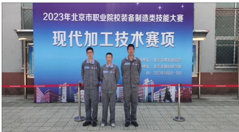
图 18 2023 年北京市职业院校技能大赛中职组现代加工技术（师生同组）赛项比赛中获得三等奖