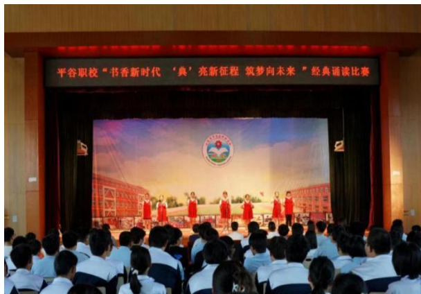
图 3 “书香新时代‘典’亮新征程 筑梦向未来”演讲比赛

一是通过宣传栏、微信、广播、会议等多种形式宣传“未来工匠心向党 文明同行谱新篇”主题教育活动的意义，进行活动部署，明确创建方向。二是组织开展系列党史学习教育，丰富校园文化建设，坚持党史教育课内与课外相结合，坚持主题教育和日常工作相结合，寓文明校园创建于教育教学之中。多样的活动形式不仅为学生们提供了展示才华的平台，更培育了工匠精神，坚定了同学们的理想信念，引领了校园文明新风尚，充分展示新时代中等职业学校学生精神面貌。