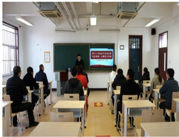
图 40 “纪法同行扬正气 清风护航新征程”纪法宣传教育