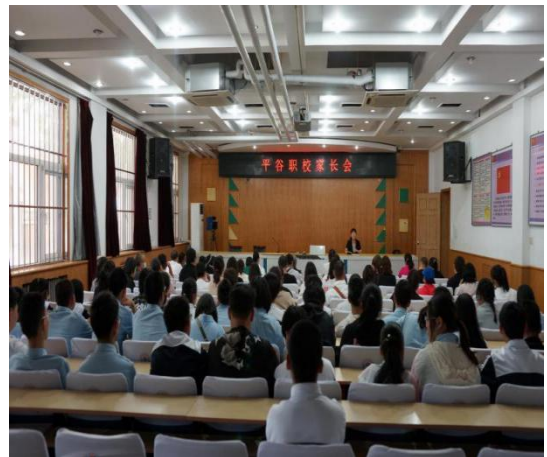
图 2 家校共育大讲堂线下讲座