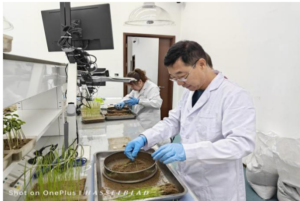
图 43 设施农业专

为提高平谷区职业学校教师专业技能和实践操作能力，加强高水平“双师型”教师队伍建设，推进校企融合，学校分层次、分类型、分阶段组织教师进行企业实践。实践中教师们学习所教专业在生产实践中应用的新知识、新技能、新工艺、新方法，增进了对企业生产和产业发展的了解；实践以接受企业组织的技能培训和在企业的生产岗位上操作演练的形式进行；实践中采取“师带徒”模式，通过生产现场考察观摩、专题讲座、小组研讨、技能培训、上岗操作和演练、参与产品开发和技术改造等形式实施；实践中鼓励和引导教师带着问题或项目下到企业，边实践、边调研、边研发、边创新，不断提高了实践活动的针对性和实效性。