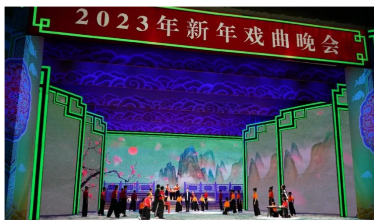
图 3.3 2023 年新年戏曲晚会

《定军山》正是秉承重要回信精神，创造性转化、创新性发展呈现戏曲经典。参加晚会的国戏全体演职员齐心协力认真排练，部分师生轻伤不下火线，带病坚持排练，在做好疫情防控的前提下历时 20 余天，最终高质量完成了演出任务。