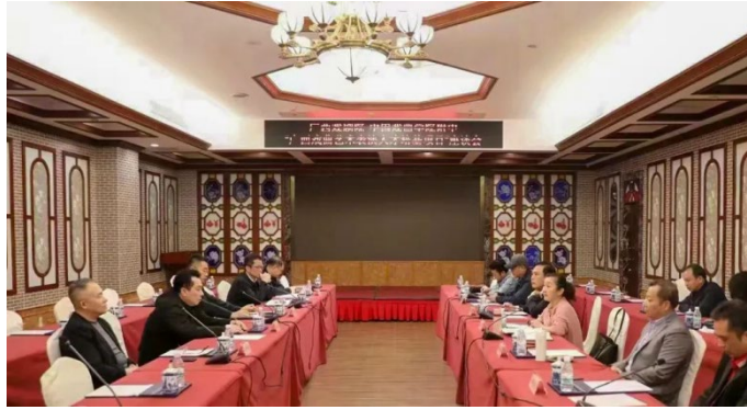
图 2.1 中国戏曲学院附属中等戏曲学校与广西戏剧院 广西戏曲艺术表演人才联合培养项目座谈会