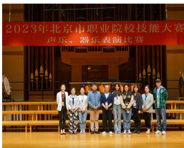
图 1.1 2023 年北京市职业院校技能大赛