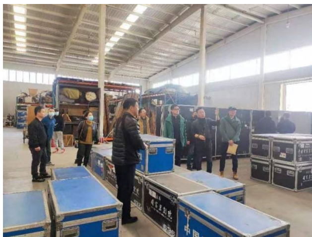
图 3.1 观摩学习