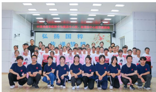
图 3.2 “弘扬传统文化·展示专业风采” 交流活动

为丰富校园文化活动，弘扬中华优秀传统文化，展现学生们积极向上的精神面貌，5月21日，戏曲音乐学科组织师生前往属地房山窦店中心小学及南尚乐中心小学举办了“弘扬传统文化·展示专业风采”交流活动。此次活动展现了附中学子良好的专业水准与精神风貌，通过演出交流实践创新了德育教育方式，引导全体师生在为人民服务中践行社会主义核心价值观。同时增强服务意识，加强校地联系，发挥资源优势，让优秀传统文化的种子在孩子们心中生根发芽。