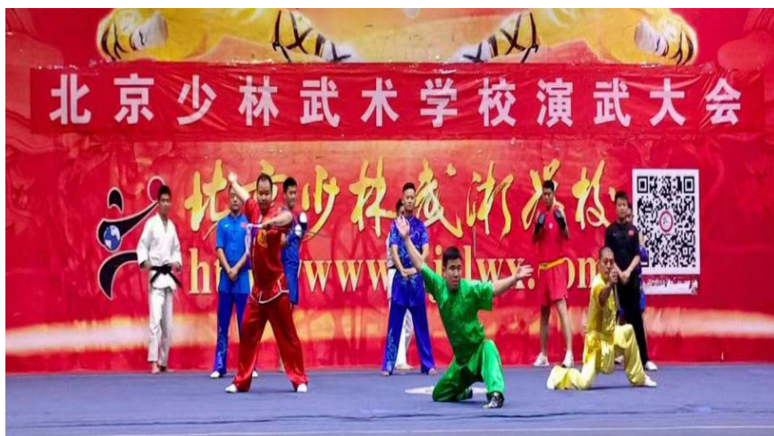
图3 “弘扬武术精神，传承非遗项目”武术演示大会

少年武术发展贡献力量。共10个团队500余人参加了活动，大会上各团队展演了太极拳、太极剑、南拳、南刀、南棍等武术项目，让现场观众感受到了中华武术的精彩与震撼。一剑一拳、一枪一棍都诠释着“千磨万击还坚劲，任尔东西南北风”的坚韧不拔，展现了中华儿女的飒爽英姿。