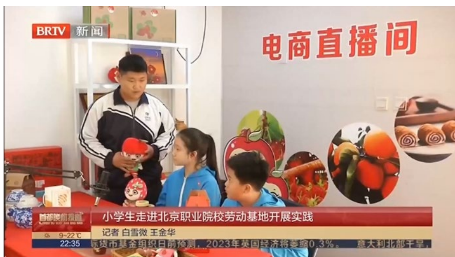
图 1 中小生走进昌平职业学校开展劳动教育实践

为推进职普融通，昌平区教委推动昌平职业学校为中小学开展职业体验和劳动教育，充分发挥劳动教育的综合育人功能。昌平职业学校充分发挥北京市中小学生职业体验中心（劳动教育基地）和昌平区中小学劳动教育实践基地作用，为不同学段、不同群体研发各类劳动教育和职业体验课程，与区域内外普通中小学开展合作，以课程培训、课题研究、成果建设为抓手，充分发挥职业教育资源优势，探索职普融通新路径。2022-2023 学年，昌平职业学校先后为近 80 所学校开展 1 万余人次的劳动教育课程服务。