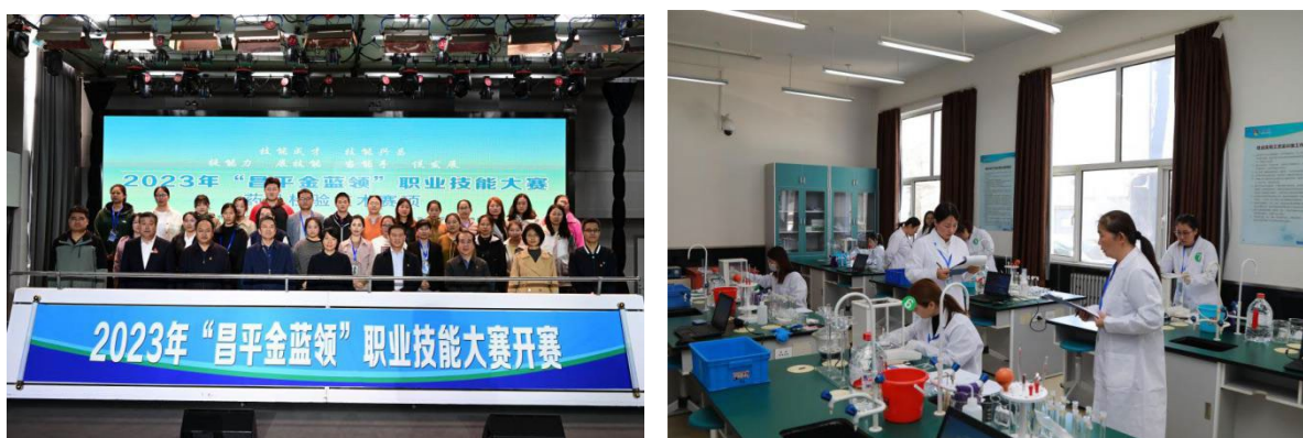
图 2 学校承办职业技能大赛药品检验技术赛项

医药健康产业是昌平区“十四五”时期重点发展的产业，昌平区以产业发展和人才需求为导向，2021 年，昌平职业学校新增了生物制药工艺技术专业以来，与扬子江药业集团北京海燕药业有限公司、华润三九北京药业有限公司等多家医药企业签订合作协议，校企双方合作共建，广泛开展订单班人才培养和员工培训，近两年总量达2400人天。2023年，昌平职业学校承办职业技能大赛药品检验技术赛项，为行业技能人才“练兵比武”搭建平台，以赛促学、以赛促干，提升药品检验从业人员技术技能水平，培养适应现代药物检验与分析的高素质技术技能人才，服务昌平区生物医药产业的高质量发展。