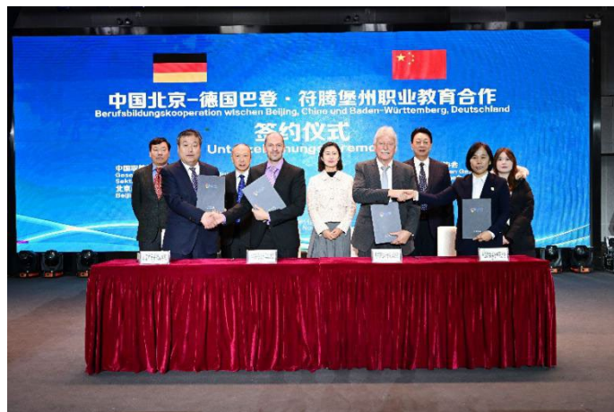
图 4 与德国卡尔斯鲁厄手工业协会签署中德职教合作协议

昌平职业学校以“双向循环”为发展目标，立足昌平国际一流现代化新城建设，面向首都国际交往中心城市功能定位需要，创新国际交流形式，“引进来 走出去”，打造昌平职教品牌。围绕电子商务、中餐烹饪、汽车运用与维修专业及信息技术专业（群）建设，从单向引进借鉴走向共建共享，实现中职学校教学标准走出去。受邀为新加坡工艺教育局开展了 10 次课程培训，共计培训 492 人次，共有 5 门课程获得 ITE 学分认证。担任中国职教学会国际合作工委、昌平区友好协会常务理事单位，推动中外人文交流和教育合作，热情接待圭亚那驻华使馆官员、芬兰高校联盟等代表团来校调研；协办驻华使节与北京友协理事“春华秋实”联谊活动，受邀发表主旨演讲，面向 24 个国家驻华外交官推介昌平文化，展示职业教育社会贡献力，受到广泛关注，大大提升学校国际影响力。