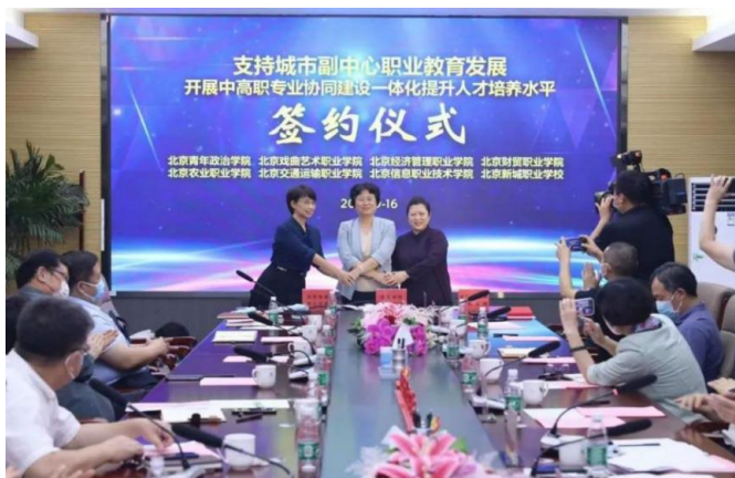
图 6 北京新城职业学校中高职衔接专业建设指导委员会成立

北京新城职业学校与 7 家高职院校，包括北京青年政治学院、北京财贸职业学院、北京交通运输职业学院、北京经济管理职业学院、北京农业职业学院、北京信息职业技术学院以及北京戏曲艺术职业学院就建立中高职衔接专业建设指导委员会进行签约。通过签约，进一步强化“3+2”中高职衔接合作办学，充分发挥北京职业教育特色高水平院校和专业建设的引领示范和辐射带动作用，开启新的更深入、更紧密的校校合作协同办学进程，共同推动北京职业教育、通州区职业教育整体高质量发展。