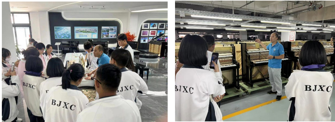
图 5 学生走进星海钢琴集团实践体验

在与星海钢琴的深度合作中，教师和企业专家积极创新教学方法与手段，共同推动课堂教学改革。课堂不再拘泥于教室，教学也不再是教师的单向传授，注重学生职业技能和职业素养的培养。运用项目化教学、真实工作任务驱动教学、案例分析和情景教学法，推进教学训做评一体化。依据人才培养目标和教学目标，精准对接企业需求，以“企业和岗位要求”为目标，融入产业行业企业最先进的元素到教学过程中，逐步调整完善以能力为本位、理论知识与实践技能一体化的课程体系。