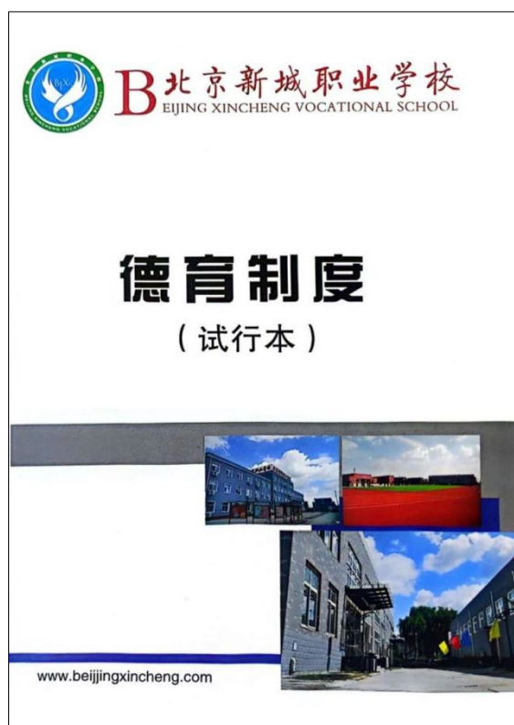
图 1 北京新城职业学校德育制度（试行本）

《学生思想量化考核细则》等系列管理考核机制，明确各项管理制度和标准。每周出年级量化考核分、班级量化考核分、个人思想量化考核分，每月出月考核分，对班主任而言考核分是班级管理工作的镜鉴，明确在本周工作中存在的问题，以便及时纠正或弥补，逐步完善班级管理工作。个人思想量化考核分是学生个人管理的镜鉴，明确自己存在的问题，及时改正。通过系统化德育管理，成效显著，学生良好的习惯在悄然形成，班级管理形成特色。