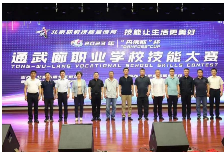
图 9 2023 年“丹佛斯”杯通武廊技能大赛在北京新城职业学校盛大开幕

大赛展示了“通武廊”三地职业教育成果，加强了三地职业学校相互交流、相互学习，为三地职业学校学生搭建了同场竞技、互通有无、互比互学、相互提高的交流平台。