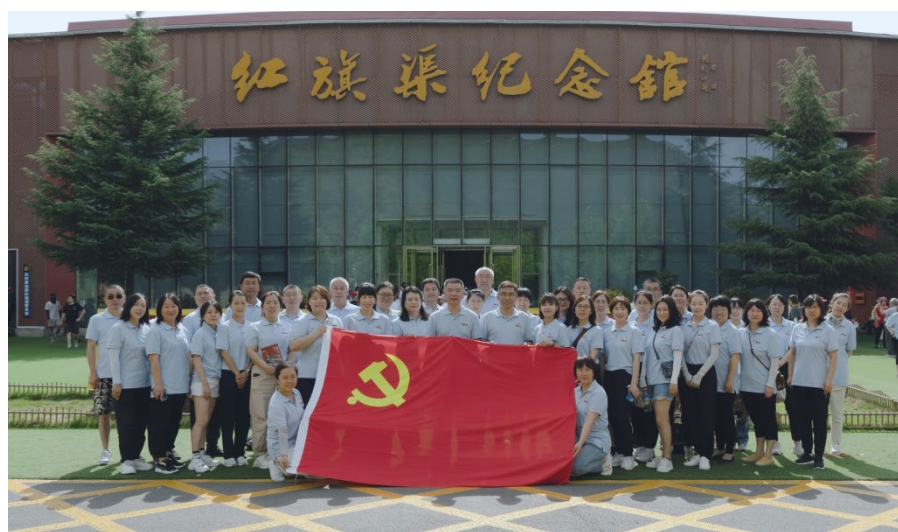
图 14 赴红旗渠参观学习

职业学校实施党建铸魂工程，开展“三亮三争”行动，通过党员亮身份、亮标准、亮承诺三亮行动，接受师生监督，促进优质服务。通过争当学习先锋、争当师德先锋、争当教学先锋，三争行动不断促进教师专业成长，促进学生全面发展。四联动指建立支部委员联系年级组、党小组长联系教研组、党员骨干联系班集体、党员教师联系特殊学生的四联动机制，激发全体党员服务意识、担当意识，培养忠诚、干净担当的教师队伍。五指以“新承”党建品牌为引擎，深入学习贯彻党的二十大精神，扎实开展三会一课、主题党日等，不断提升领导干部、支部团队、党员名师、班主任和团支部五支队伍能力素质。