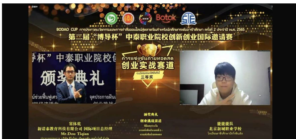
图 12 第二届“博导杯”中泰职业院校创新创业国际邀请赛颁奖仪式

2022 年 12 月 23 日召开线上颁奖仪式。本次的创新实战&创业挑战赛，邀请了 93 所中泰院校，2276 名参赛学生，416 支团队，424 位指导老师。新城职业学校取得了三等奖的好成绩（总排榜第四名）。