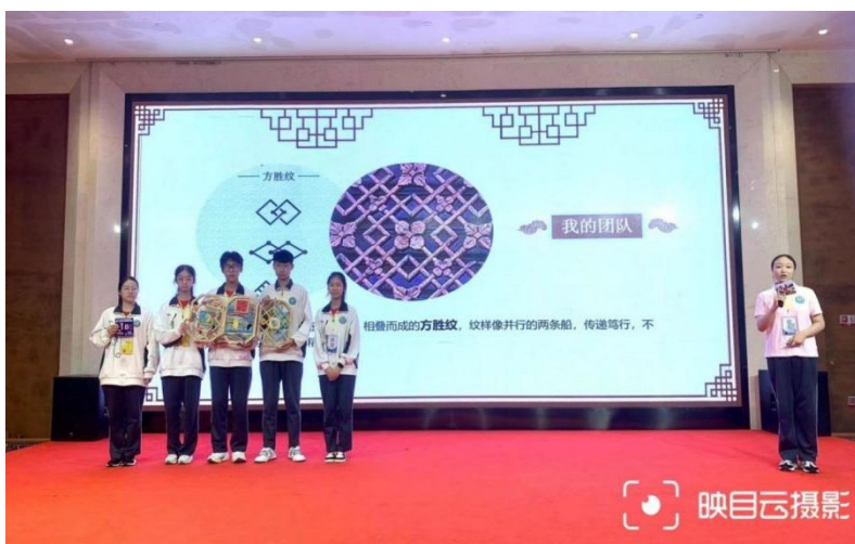
图2 “创意花窗”赛项荣获全国一等奖第一名

过劳动实践活动，学生了解了专业技能和技巧，增强了专业技术与实际工作相结合的经验，提升了就业和职业发展竞争力，实现了以技能展优势，以劳动促发展的目的。