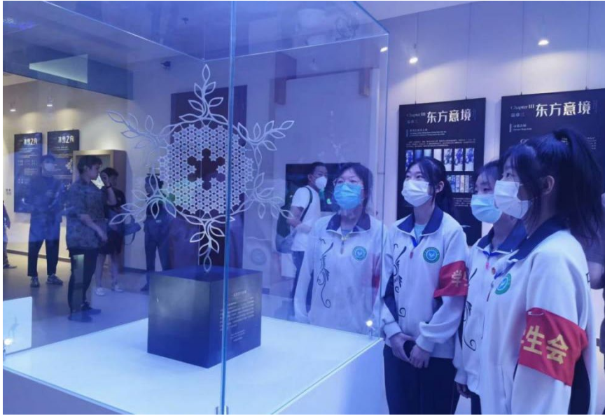
图 13 走进国家大剧院，为学生科普艺术之美