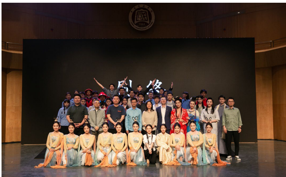
【图片 1-2】以原创思政音乐剧构建“大思政课”新平台