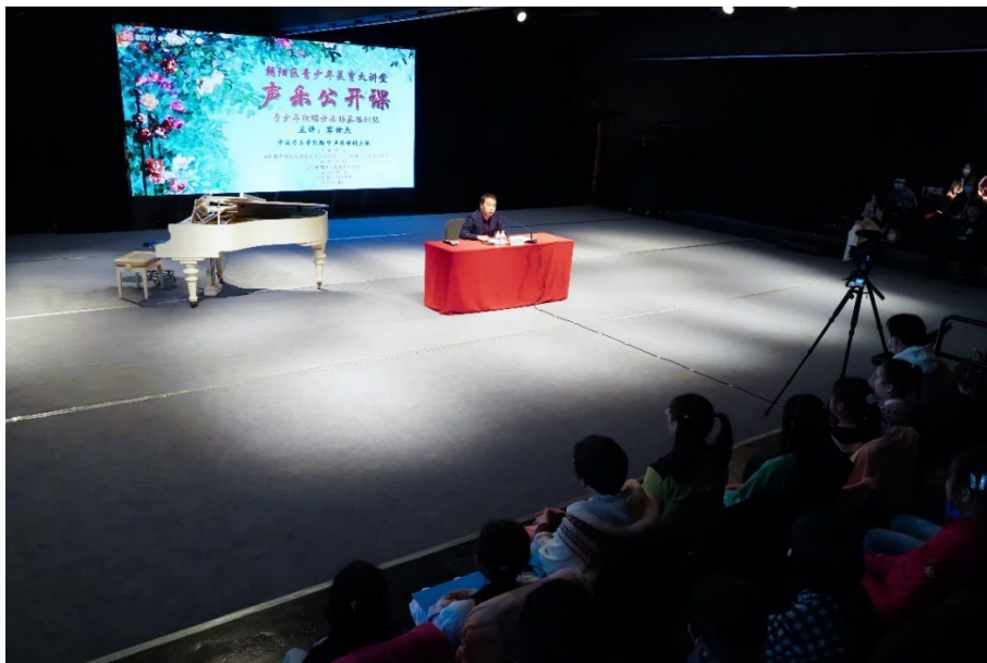
【图片 2-1】国音附中积极贡献朝阳区文化建设