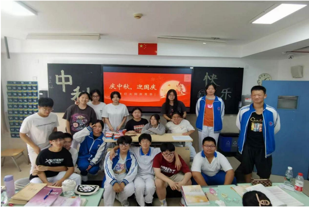
图 3-1 “月圆京城、情系中华”主题班会