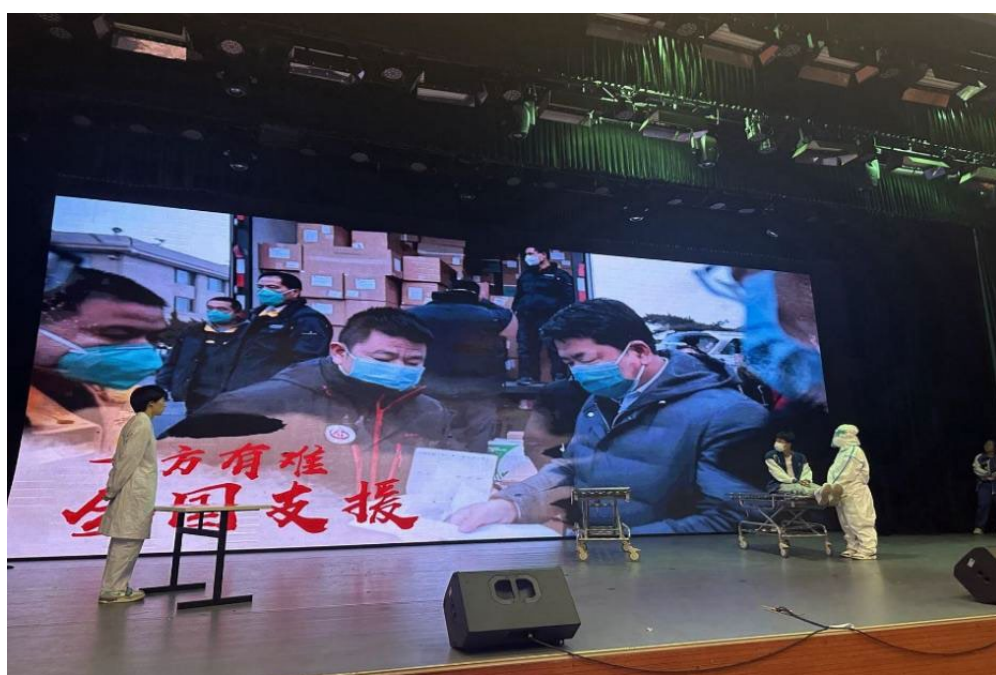
图 1-2 话剧《使命》剧照 2