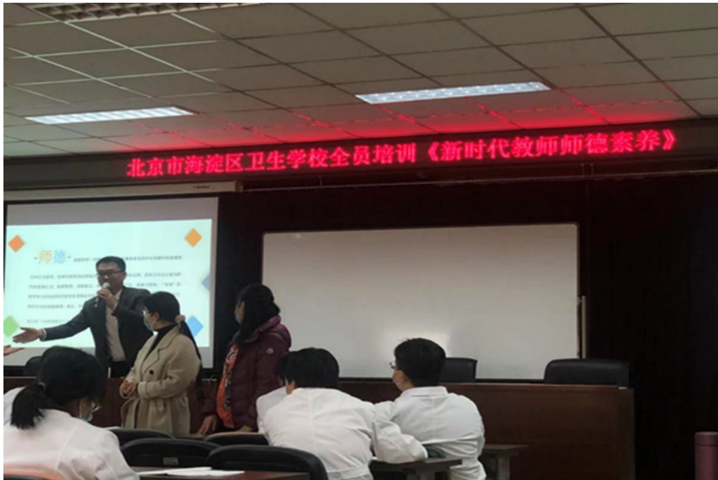
图 6-4 学校教师全员师德素养培训