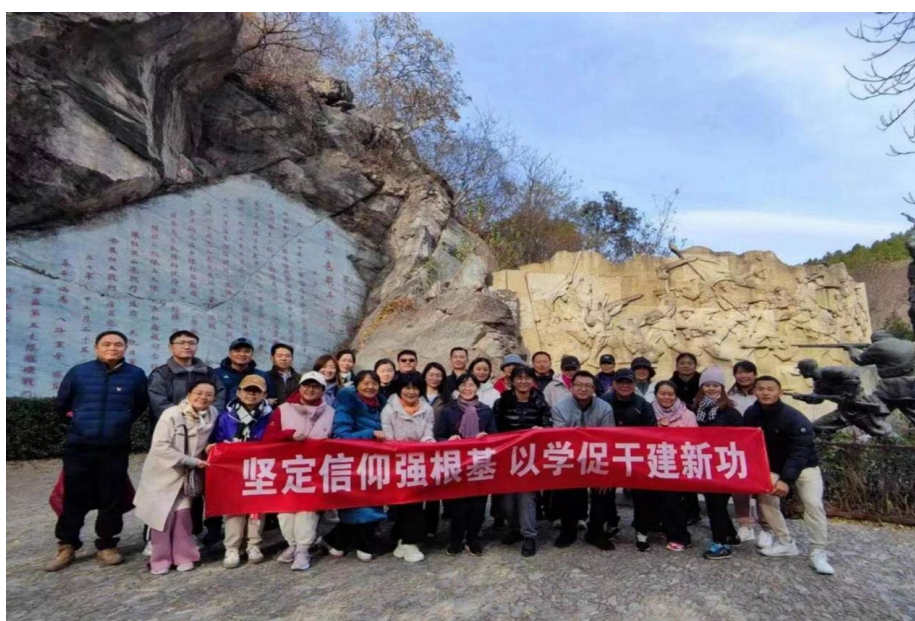
图 3-2 “坚定信仰强根基、以学促干建新功”主题党日活动

百望山是北京市爱国主义教育基地，是开展党性教育的好课堂。党员们先后参观了绿色文化碑林、黑山扈战斗纪念馆和海绵城市展览馆，认真观看老一辈革命家、书画艺术家关于绿色文化宣传的题词，接受革命先辈们英雄事迹的洗礼和中华优秀传统文化的熏陶，学习海绵城市科普知识，追忆平西抗日游击队与日本侵略者浴血奋战的一幕幕场景，先烈们舍生忘死的无畏精神使全体党员干部再次感悟入党初心，坚定理想信念，激励党员们学英雄、强本领、勇作为，自觉将红色文化的精神力量转化为推动学校高质量发展的实践行动，立足本职工作，更加发奋图强。