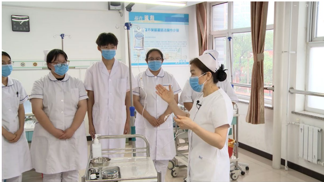
图 1-10 专业课程二组参加 2023 年北京市职业院校技能大赛教学能力比赛

为进一步提高教育教学质量，促进“能说会做善导”的“双师型”教师成长，不断提高教师的师德践行能力、专业教学能力、数字素养水平、综合育人能力和自主发展能力。学校重视并督促教师积极参加各类教学能力比赛，实现以赛促教、以赛促学、以赛促改、以赛促研，真正实现三全育人，提高育人水平。本年度学校分别派出基础护理学、病理学2个专业课程教学团队参加北京市职业院校技能大赛教学能力比赛，2个教学团队分别获得了北京市中等职业教育组三等奖，展现出学校教师队伍育人水平和教育教学改革创新成就。