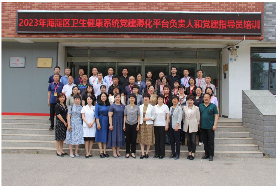
图 2-2 2023 年海淀区卫生健康系统党建孵化平台负责人和党建指导员培训会

认真贯彻落实《2019—2023年全国党员教育培训工作规划》和市、区两级党委有关党建工作指示要求，把持续跟进习近平新时代中国特色社会主义思想教育培训作为首要政治任务，把中国共产党党史学习教育作为全年培训主线，把提升本系统党员政治素质、使命意识、奉献精神作为主要培训目标，在卫生健康工委的正确领导精心组织，协调配合，创新机制，科学管理，较好完成了党员教育培训工作。海淀区委党校卫生健康工委分校党员培训共举办培训班 5 期 21527 人次，其中“大党课”培训 4 期、“线上”培训 1 期，较好发挥了基层分校主阵地、主渠道作用。