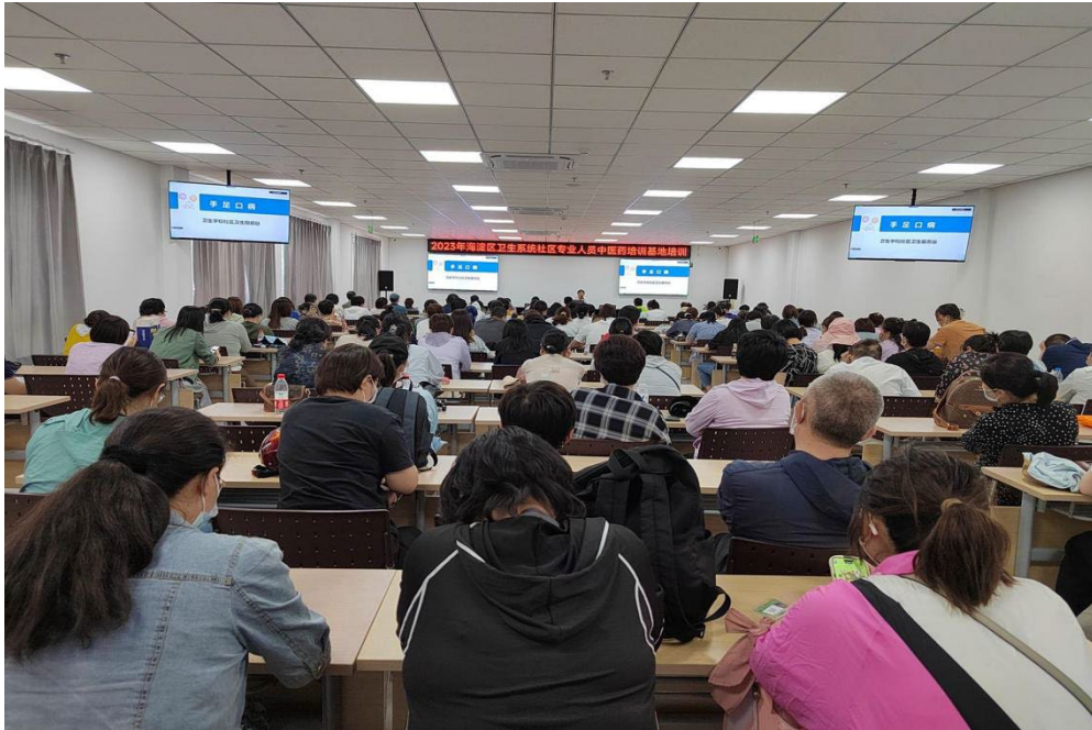
图 2-6 2023 年海淀区卫生系统社区专业人员培训