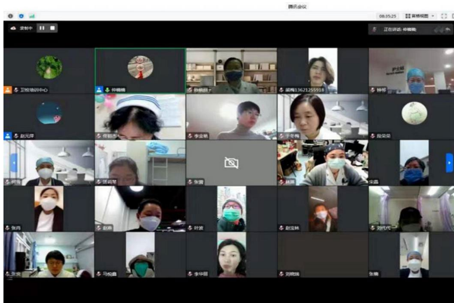
图 2-5 2022 年海淀区长期护理保险评估员培训线上授课