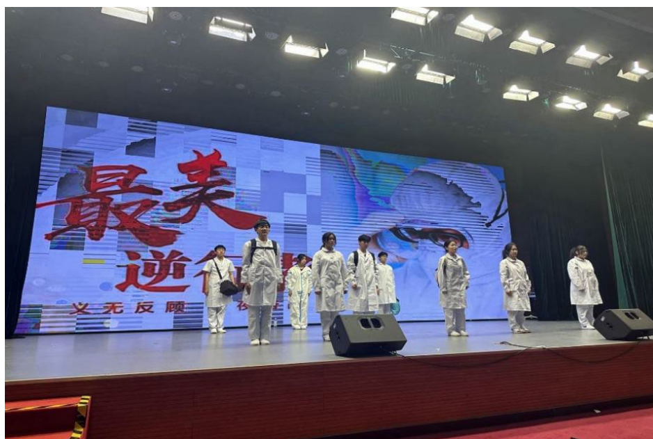
图 1-1 话剧《使命》剧照 1

话剧《使命》作为学校五四青年节汇演节目的同时，也是一堂生动的思政课，师生演员共同为全校观众献上一首战疫使命的赞歌，向抗疫英雄致敬，用行动诠释责任和担当。将抗疫精神与职业使命内化于心、外化于行，引领全校师生坚定信仰、勇于担当。