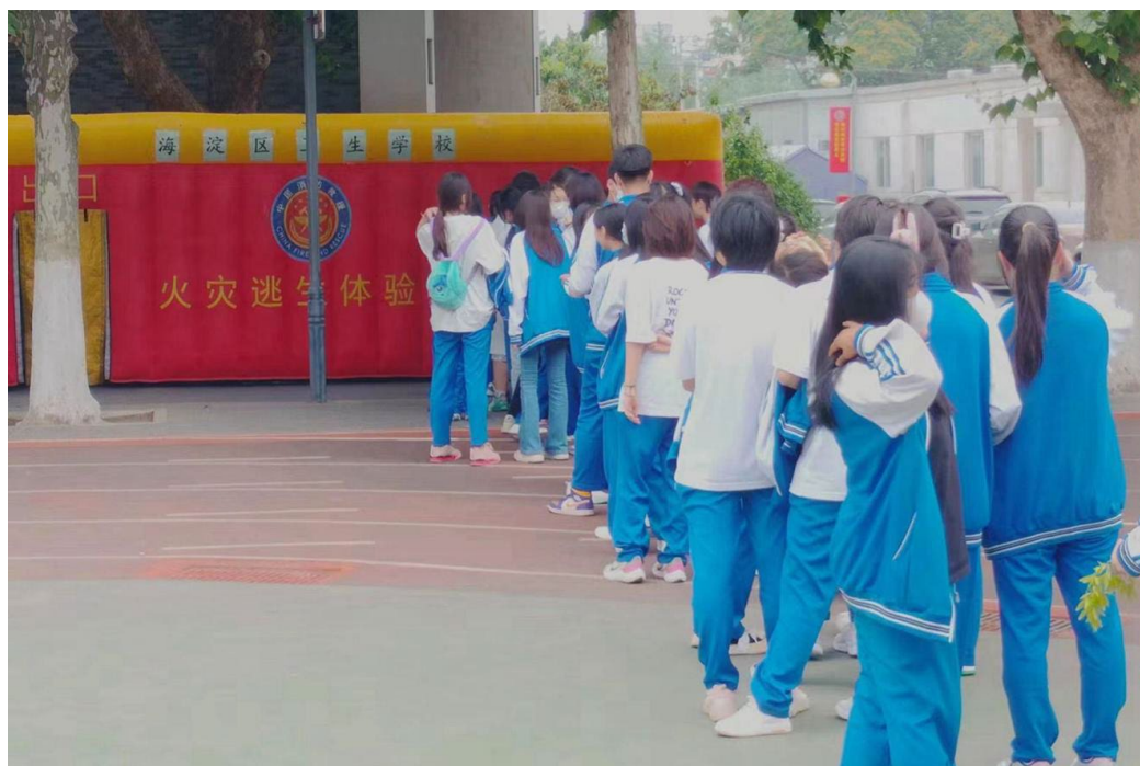
图 6-1 消防疏散演练活动现场 1