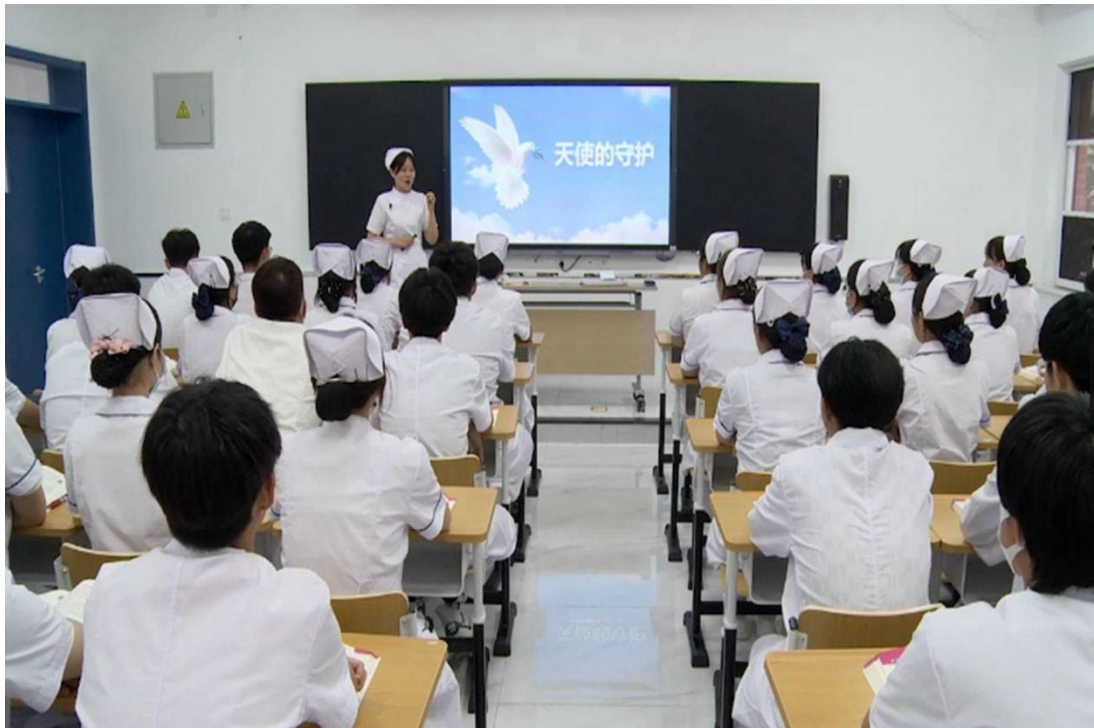
图 1-6 青霉素静脉输液护理实践教学