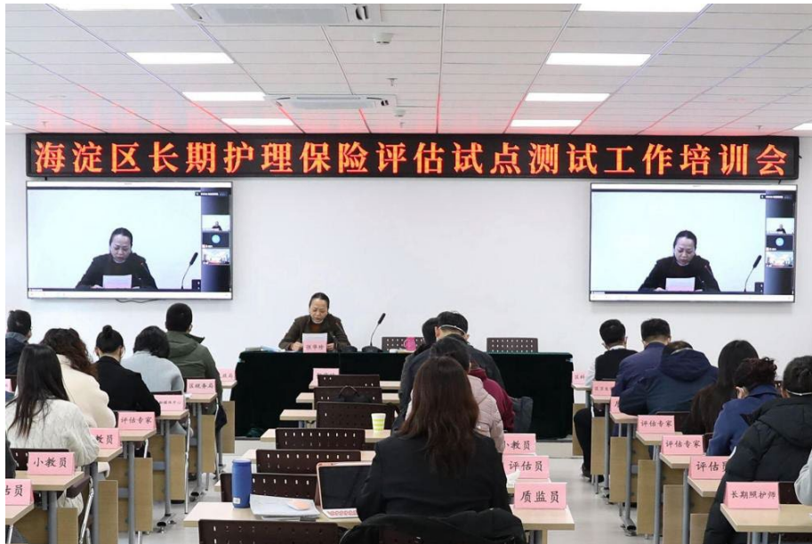
图 2-4 2022 年海淀区长期护理保险评估试点测试工作培训会