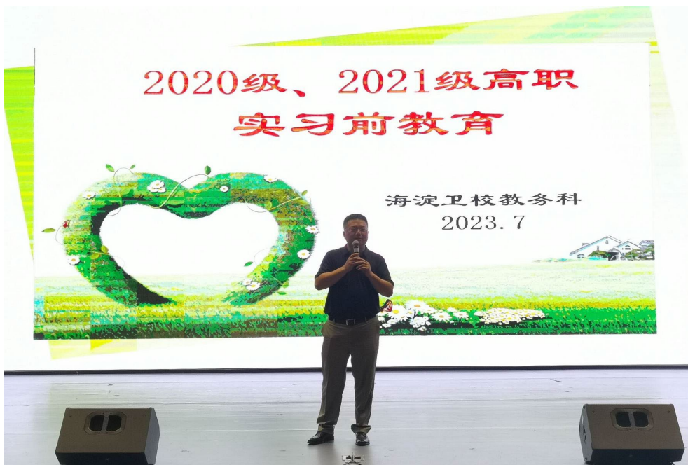
图 5-1 2020 级、2021 级实习前教育