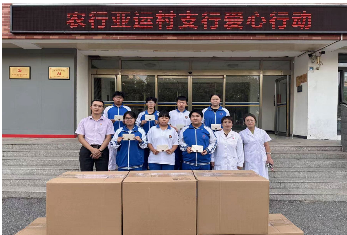
图 2-1 捐助受灾学生 助力乡村振兴

针对 2023 年 7 月全市特大洪水灾害情况，学校心系住在房山和远郊区县的学生家庭。在第一时间启动学生应急救助机制，迅速落实每一个学生的位置、安全及受灾情况，根据学生家庭受灾情况进行了核查和汇总，按照严重程度等级划分 3 个级别，在第一时间给予了 17 名受灾学生分别为 1000 元、800 元、500 元不等的受灾捐助（其中 1000 元等级为 10 人，800 元等级为 3 人，500 元等级为 4 人）。同时发动社会捐助，得到了农业银行亚运村支行的大力支持，该银行为每名受灾学生捐助了包括学习和生活用品等方面的爱心物资，并带去了一封信，鼓励他们战胜灾难，重拾信心，扬帆启航。学校注重灾后心理辅导，及时鼓励受灾学生及家长振作精神，克服难关，发扬艰苦奋斗精神，积极做好灾后重建工作，尽快恢复正常的生产生活秩序。