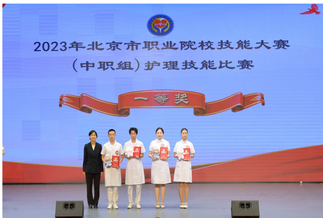
图 1-8 学生获北京市职业院校技能大赛护理技能比赛一等奖