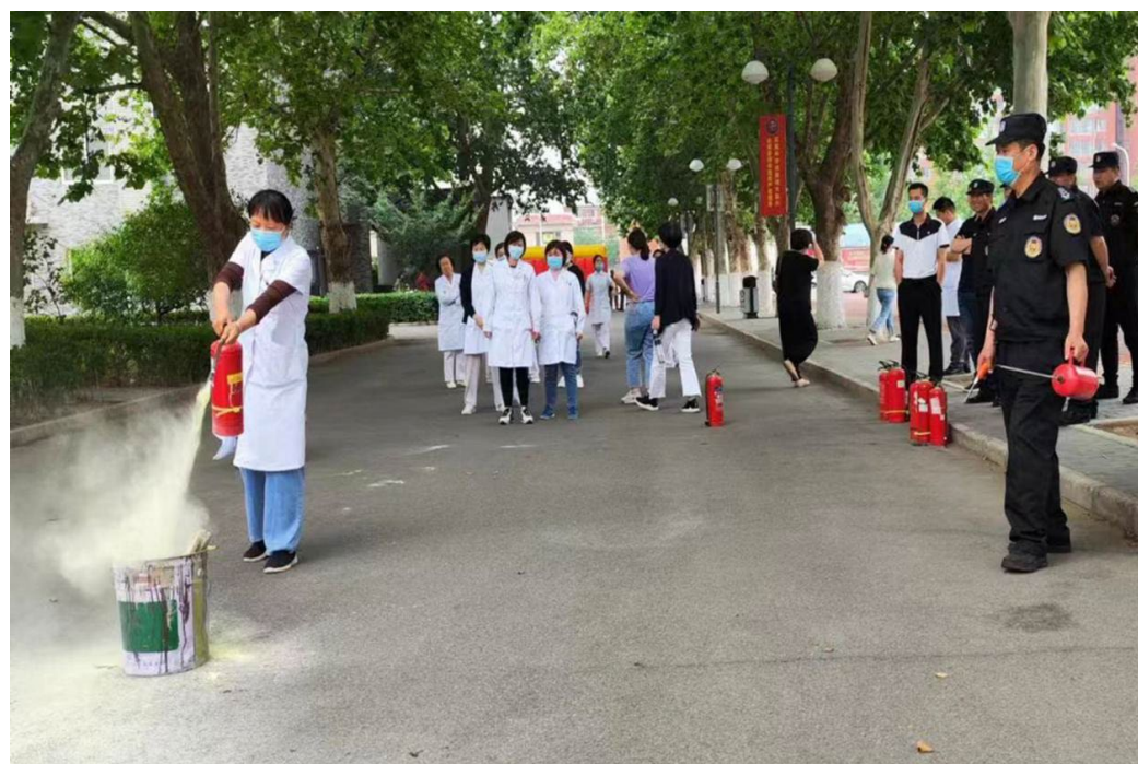
图 6-2 消防疏散演练活动现场 2