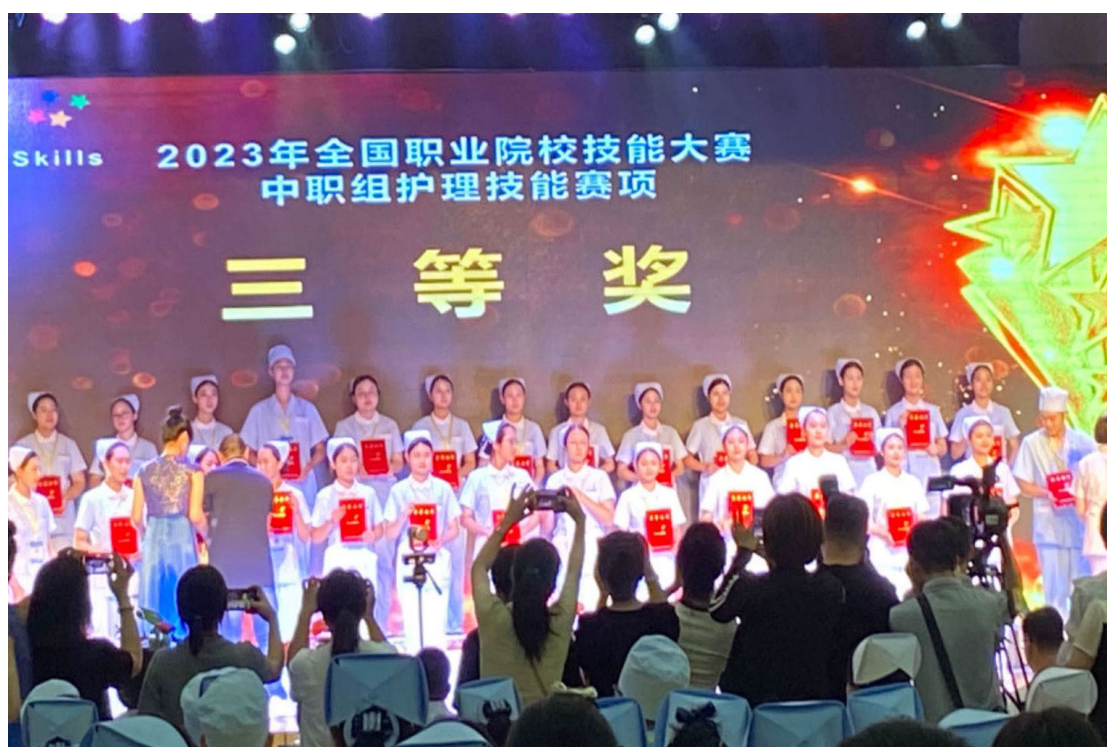
图 1-9 学生获 2023 年全国职业院校技能大赛中职组护理技能比赛三等奖