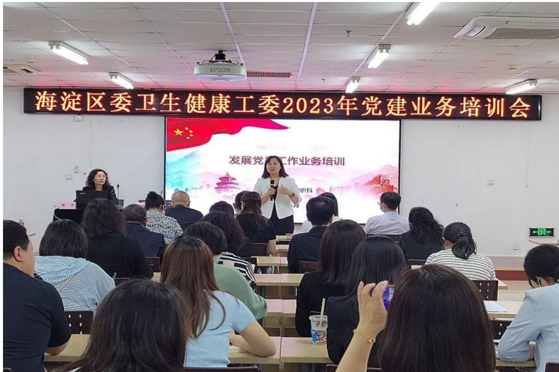
图 2-3 海淀区卫生健康工委 2023 年党建业务培训会