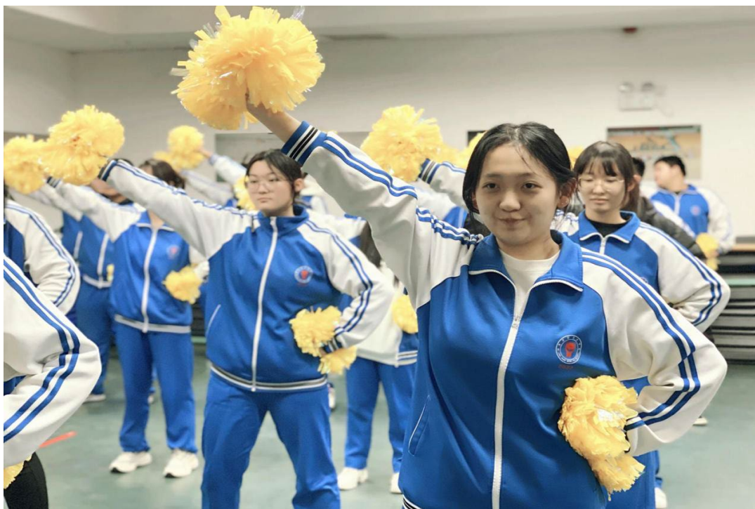
图 1-4 强健体魄 思政育人

视频，从动作、音乐、服装、编排等方面解析其融入的中国传统文化元素，进行思政育人，通过唱响时代的刀剑如梦、中国功夫、男儿当自强和大中国等剪辑“金曲”，熏陶学生，引导学生以情怀去传承，以极具观赏性的啦啦操项目为媒介，传播传统之美，唤起学生担起坚定文化自信的使命，为展现中国风貌添砖加瓦。