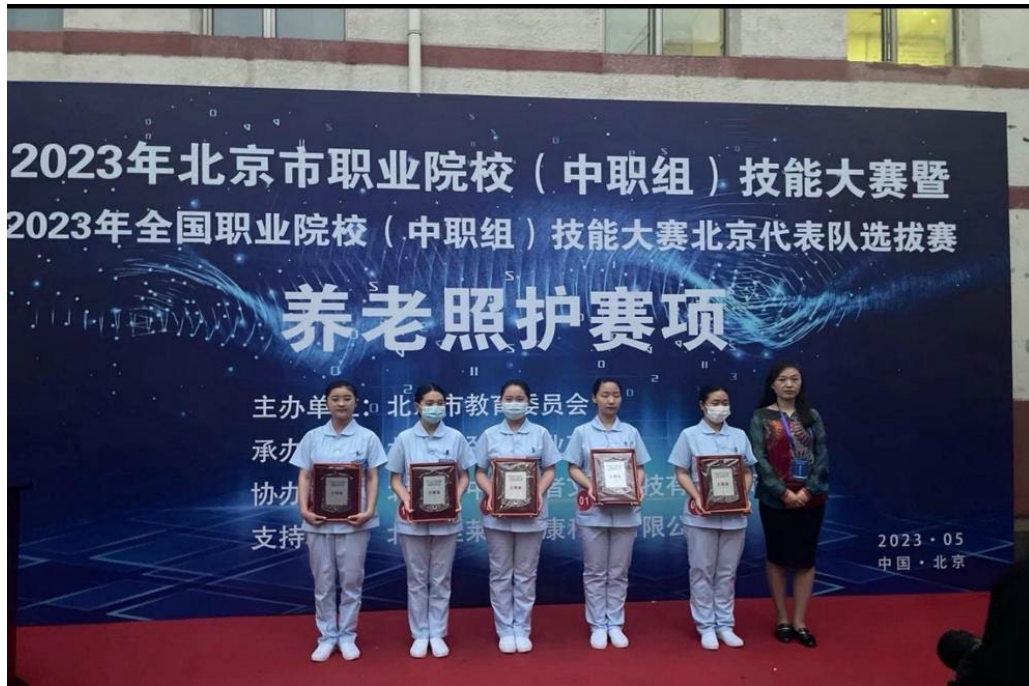
图 1-5 学生获北京市养老照护大赛三等奖