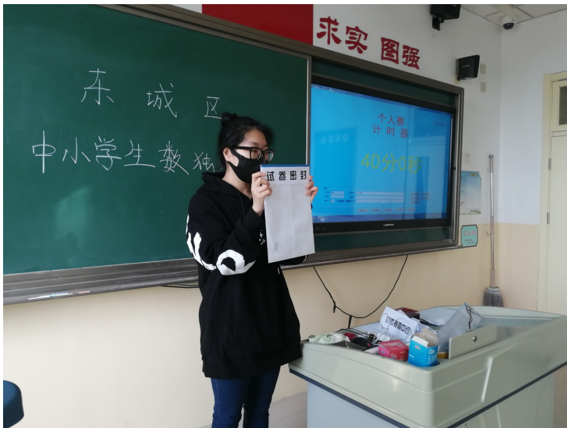
图 2：独社团参加东城区中小学生数独比赛

虽然学校学生人数少，但因为全部寄宿，在下午 4 点半之后，学校开设了丰富多彩的课后服务课程，只要有需求，学校就尽可能满足。多年来，学校形成了一系列课后 430 课程，内容包括舞蹈、航模、数独、书法、古筝、羽毛球、足球等，充分满足学生个性化发展需要。通过课后服务课程，许多同学发展出积极健康的兴趣爱好，学生的书法、绘画、诗朗诵等作品多次在市区级活动中获奖，学校的数独、航模社团也频频参加市区级竞赛并获奖。