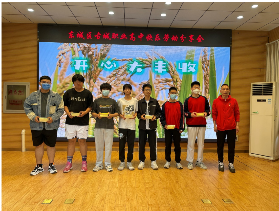
图 18：2023 年 5 月学校召开农业劳动果实分享会

揣回来课间偷偷吃掉了。以后吃饭吃多少打多少，倒掉的都是血汗。”这些鲜活的劳动实践成果是纸面宣传说教所达不到的。