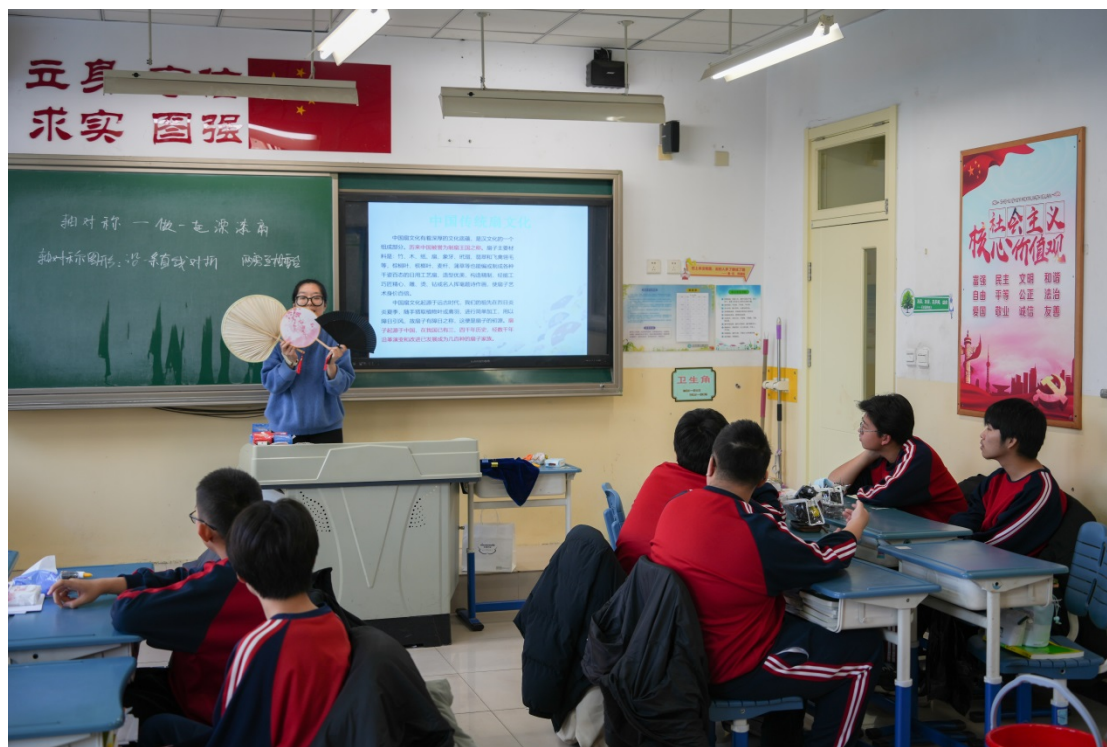
图 24：2023 年 11 月骨干教师展示课

学校积极搭建教师专业发展平台，促进教师专业发展；积极发挥区校两级骨干教师的示范作用，以“进德修业”为主线，党支部牵头成立学校教师发展工作室，问题导向，科研引领，践行核心价值，培育道德情感，筑牢思想根基，潜心钻研业务，增强育人能力，工作室以德育研究、心理健康、学业评价、校园文化四个小组为抓手，鼓励引导教师参与其中，开展学习培训、课题研究，将教育教学工作由经验型上升到研究型，理论指导实践。为办好专门学校，全面提高育人质量。