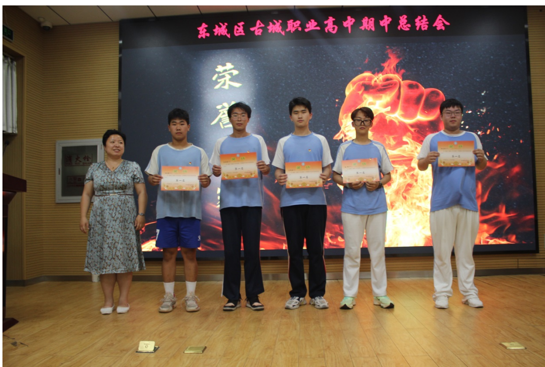
图 20：2023 年 5 月召开期中总结会对五星评价优秀学生进行表彰