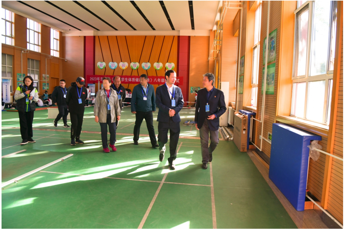
图 7：2023 年 10 月东城区教委主任周林视察学校体育考试工作准备情况

依托《中华人民共和国预防未成年人犯罪法》和《中华人民共和国未成年人保护法》两法落地以及《家庭教育指导法》的实施，学校聘请首都师范大学北京市青少年社会工作研究院，对学生开展班集体建设拓展训练，面向班主任开展家校社普法专题培训，加强对监护人及家庭教育进行有效指导，形成合力提升全面育人的能力和水平。