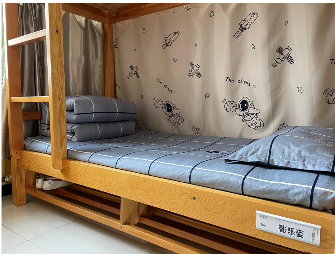
图 17：学生宿舍内务评比图片

寄宿制学校，内务卫生是我校日常教育中重要的组成部分。学校德育处制定了规范的内务评比标准，从整理内务开始逐项规范标准，日日检查，周周评比，以军事化管理的内务规范帮助学生营造整洁舒适的生活学习环境，从而养成伴随终身的良好个人卫生习惯。