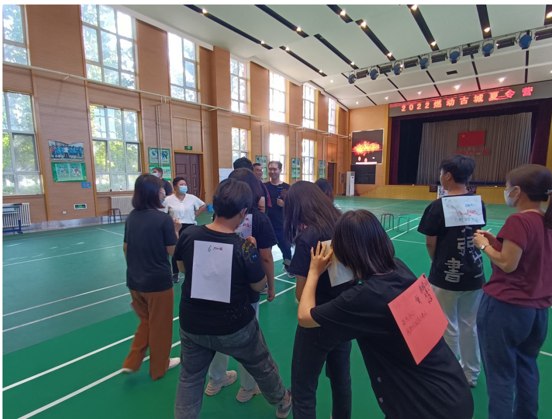
图 8：2022 年 9 月学生参加首都师范大学超越青少年社工服务站的心理夏令营活动

借助东城区学生援助中心工作机制，开展对特需学生的援助工作。对全区有特殊需求的学生开展心理、社工援助，行为矫治，普法宣传等工作。杜绝校园霸凌，构筑平安校园，学校做了服刑家庭社会维稳的学生援助，严重违纪被学校劝退学生的援助，工作覆盖中小学全部学段，赢得了兄弟学校的广泛好评。