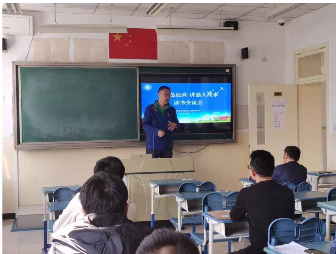
图 23：2023 年 10 月开展“读红色经典，讲感人故事”读书交流会活动

加强校本研训，实现理论研学活动的全覆盖，不断提高培训内容的针对性，提高思想政治和业务水平。以“五个结合”的学习方式促进教师思想政治觉悟和业务水平的不断提高，即集体组织学习与教师自主学习相结合；专题讲座与专题论坛相结合；校内学习与校外学习相结合；书本学习与网络学习相结合；集体学习和团队学习相结合。