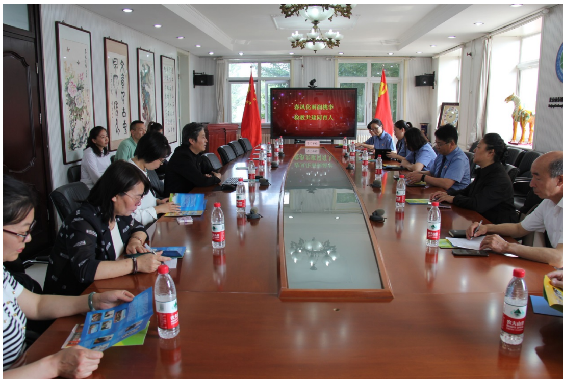
图 16：2023 年 5 月接待东城区人民检察院、河北蔚县检察院一行调研交流

学校坚持“强身心、乐求学、行善举、会生活”的育人目标，着力突出教育的职业性和实践性，帮助学生发展社会适应能力。二十大报告指出，要办好人民满意的教育，全面贯彻党的教育方针，落实立德树人根本任务，培养德智体美劳全面发展的社会主义建设者和接班人。职业教育旨在培养出具有专业技能的合格人才，在专业学习过程中更加注重学生与社会、与岗位之间的契合度，将劳动教育与德育、智育等相结合，帮助学生养成良好的思想品德，增加学生的专业知识、技能，提升审美素养，对于职业素养的提升都能起到良好的促进作用。通过劳动教育和实践教学可以实现对学生劳动素质的培育，能够帮助学生养成良好的劳动习惯，提升学生的身体素质与精神面貌，养成笃实力行的做事态度，培育学生不畏艰难、顽强拼搏的意志。