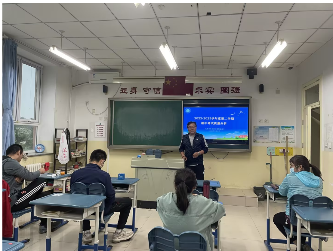
图 3：2023 年 5 月 12 日学校分教研组召开期中考试质量分析会

为帮助老师们用现代信息技术手段精准分析教学情况，高效进行数据分析，学校划拨专门资金以购买服务的形式引入智能化阅卷系统，以利于对试卷质量以及学生成绩的快速精准分析。学校在推动此项工作之前召开了教师动员会和系统培训会，但老师们从手批阅卷到批阅电子扫描试卷，仍然非常不适应。为了能够快速拿到第一手数据，大家配合学校工作，在平台技术人员的帮助下，现在已经形成从智能化组卷到测试后扫描、批阅、成绩分析全过程的智能化服务，在数据支持下，每次期中、期末考试之后学校都在一周内开展质量分析会，应用平台数据精准分析教学情况，对老师的教学行为也有非常大的助力。