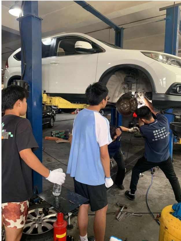
图 12：2023 年 6 月高三毕业生到企业参加工学交替活动