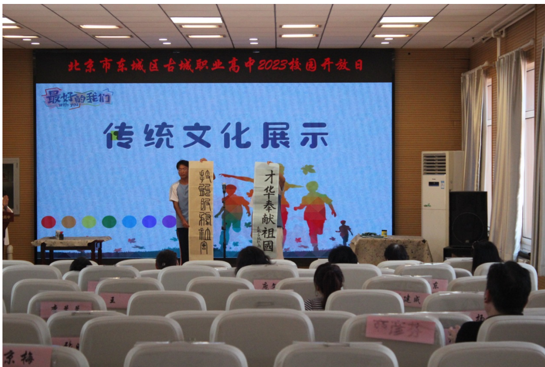
图 9：2023年6月，学生在校园开放日现场挥毫泼墨

升学生核心素养，2022年11月学校召开“诵唐诗经典 展书法风采”唐诗诵读、汉字书写比赛。指导教师为同学们推荐了李白、杜甫、王维、白居易等唐诗名家适合诵读的篇目，还推荐了一些适合书法练习的篇幅短小的诗词楹联。语文教师和班主任老师对同学们的诵读ppt和背景音乐进行逐一整理，对制作或播放有困难的同学进行一对一指导。比赛最终推选出31名选手参加唐诗诵读区级比赛，32名选手参加汉字书写区级比赛。