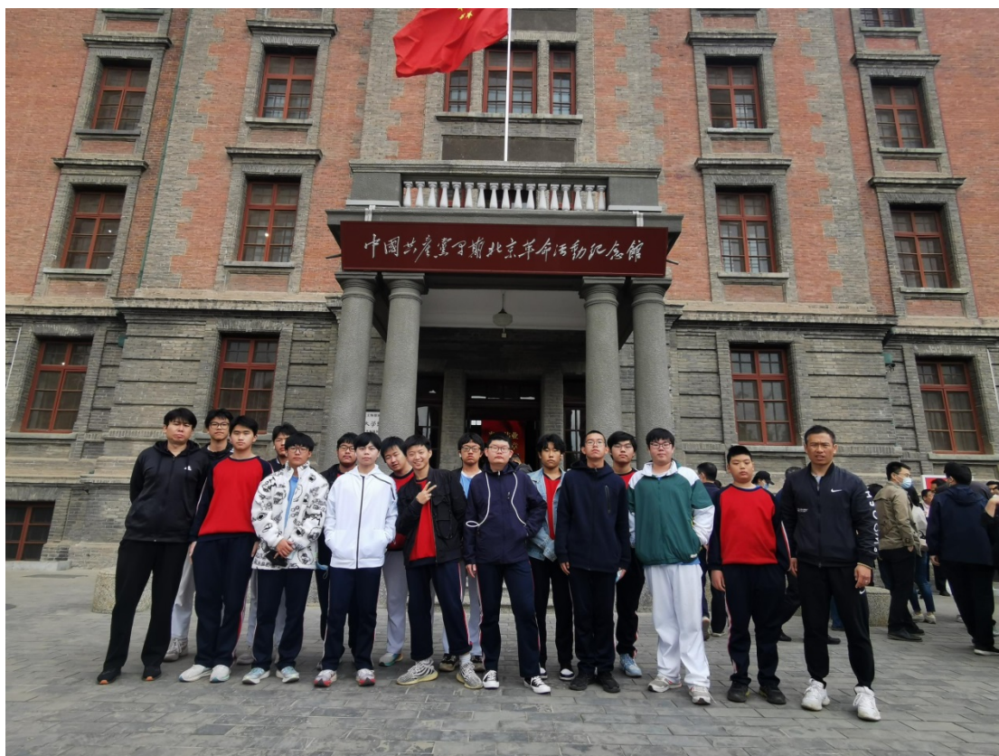
图 11：2023 年 4 月学校师生参观北大红楼合影

馆内翔实的文字资料，丰富的年代展品，向大家展示了新文化运动诞生发起的全过程及新中国成立产生的深远影响，全体师生认真聆听讲解员的讲解，踏寻先烈足迹，用心感受着那个时代的风云变化。学生们也决心要把“五四”精神继续传承并发扬下去，不负前辈的嘱托和期望，教职工们坚定信念，立足本职，办人民满意的教育，培养德智体美劳全面发展的新型人才。