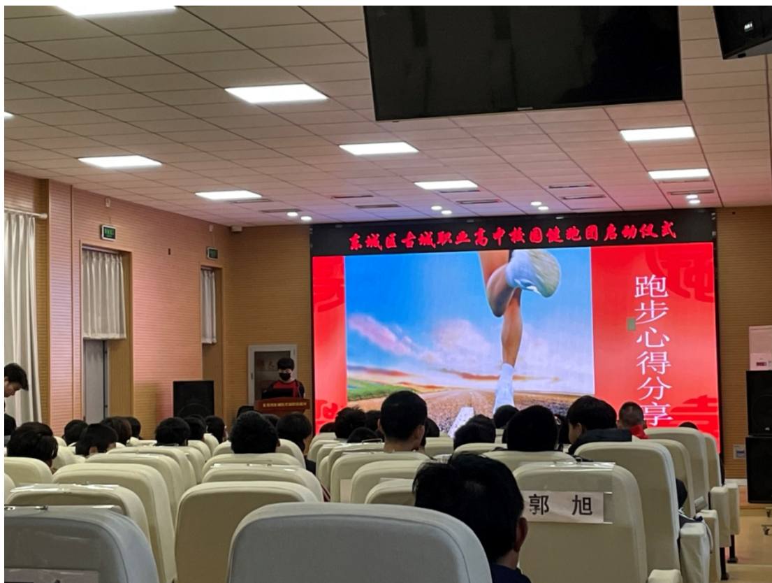
图 10：健跑团成员在学生大会上分享跑步心得

红色健跑团成立于 2021 年，以纪念红军长征为契机，引导广大青少年学生积极投入健身运动，致敬革命先辈，形成积极健康的生活习惯。健跑团成立两年以来，深受学生欢迎，即使在疫情居家期间，大部分成员依然能够在班级微信群坚持打卡锻炼。这一活动既能让学生接受爱国主义教育，又能起到强身健体的作用，磨练了学生的意志品质，培养了学生的健康生活习惯，一举多得。