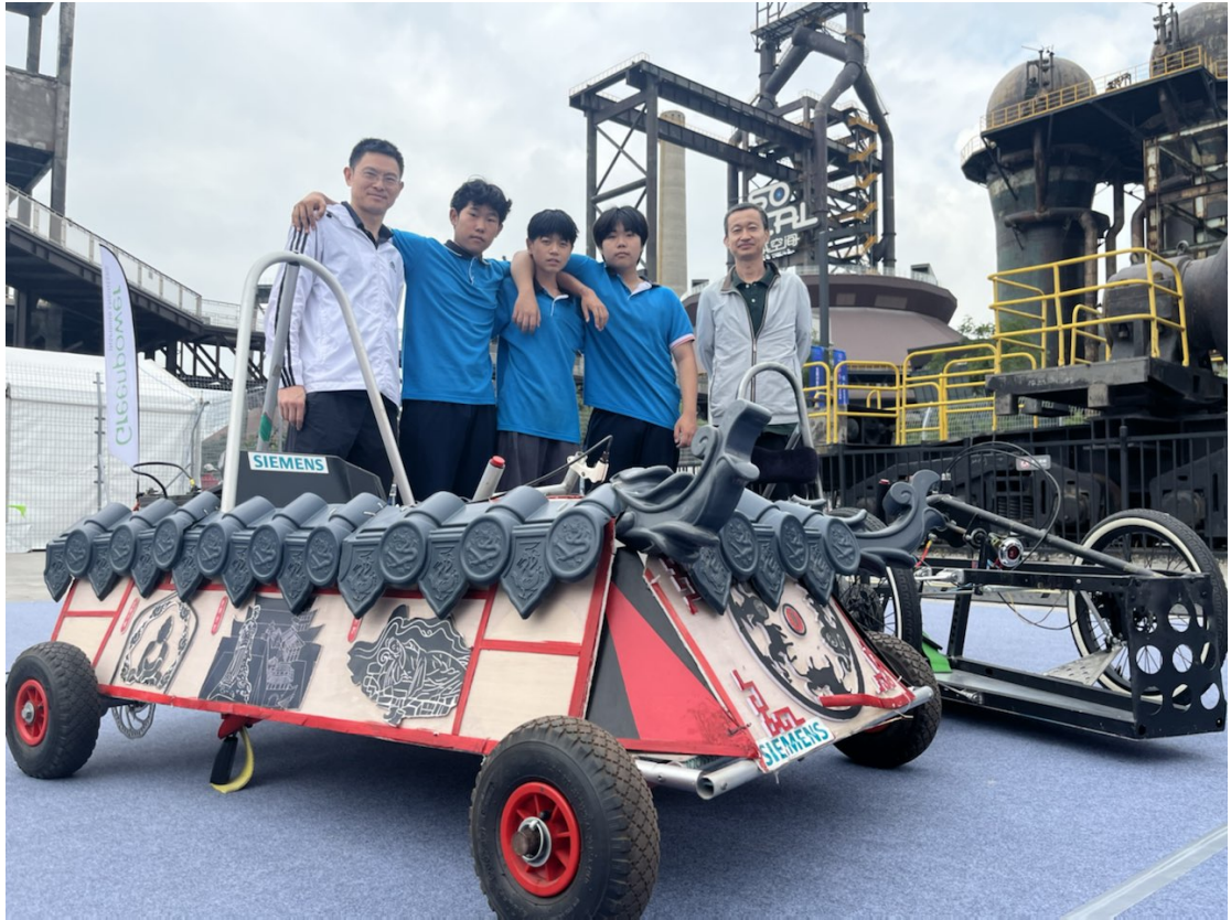
图 6：2023 年 9 月 23 日学校车队在首钢园参加中小學生工程車挑战赛活动

学校作为东城区青少年体育综合项目活动中心，以全国校园足球特色学校为契机，学校积极配合教委体卫科承担了 2023 年国家学生体质健康标准测试工作，2023 年 10 月顺利完成全区四、六、八年级体育考试现场测试工作，为东城区学生体育考试积累了全流程组考经验。同时，为我市学生体质健康水平提升做出积极贡献，为东城教育体育卫生工作走在全市前列做出积极贡献。