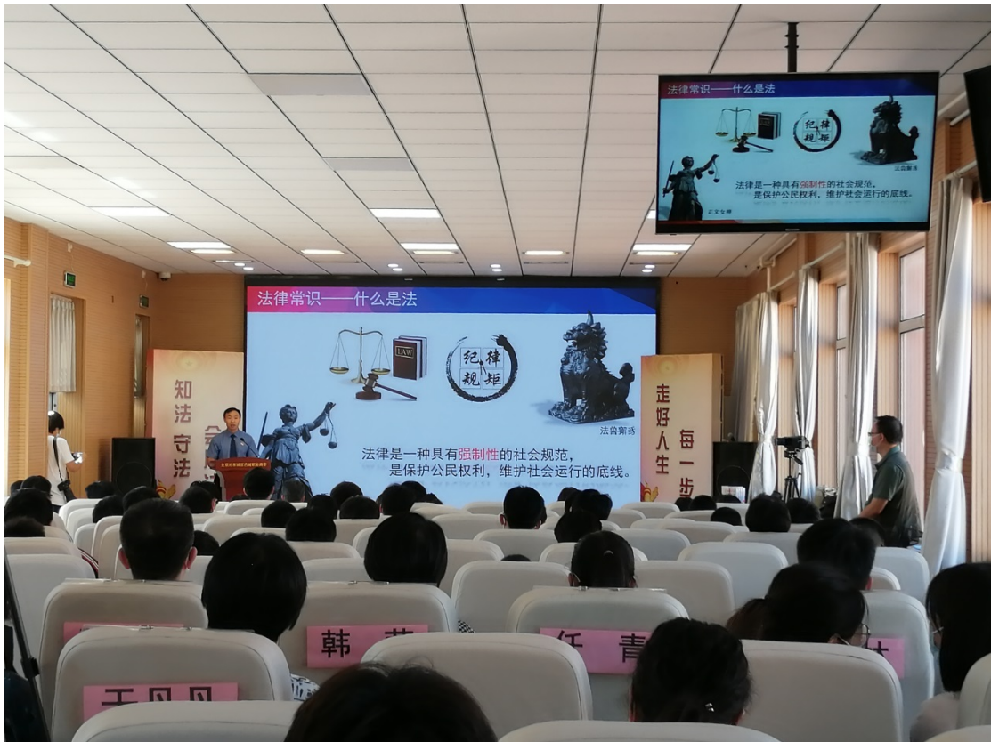
图 15：2022 年 9 月邀请东城区检察院检察长进行普法讲座