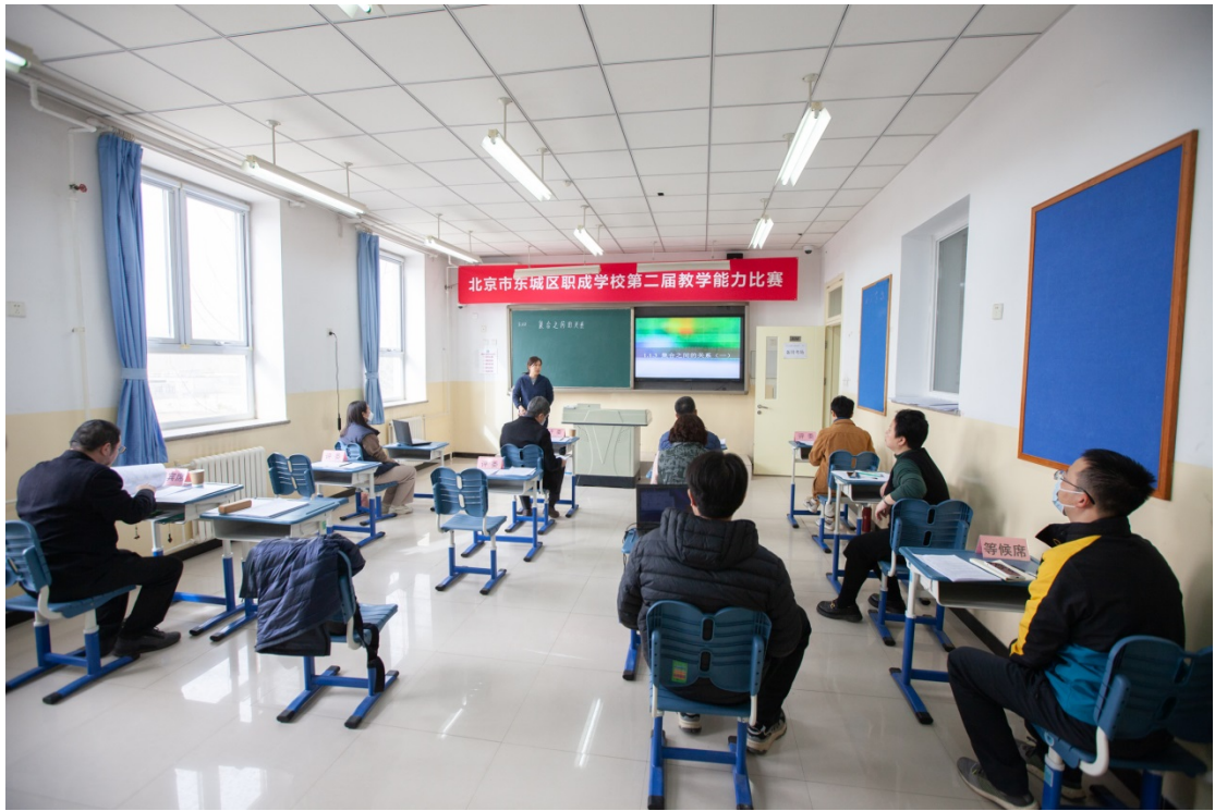
图 21：2023 年 3 月举行“北京市东城区职成学校教学能力比赛校级预选赛”活动