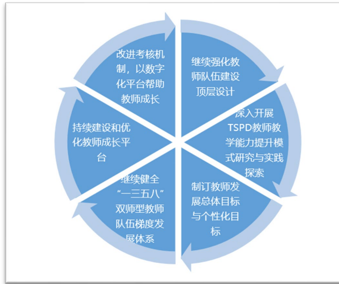
图 6-5 高水平双师型教师队伍建设 6 大建设任务

依据 TSPD 模式，制订和发布《北京市对外贸易学校 2022-23 高水平双师型教师队伍建设方案》，成立“北京市对外贸易学校高水平双师型教师队伍建设工作小组”，明确 6 大项 17 小项师资队伍建设任务，多部门共同参与，从组织、制度、人力财力物力等各方面加以保障。