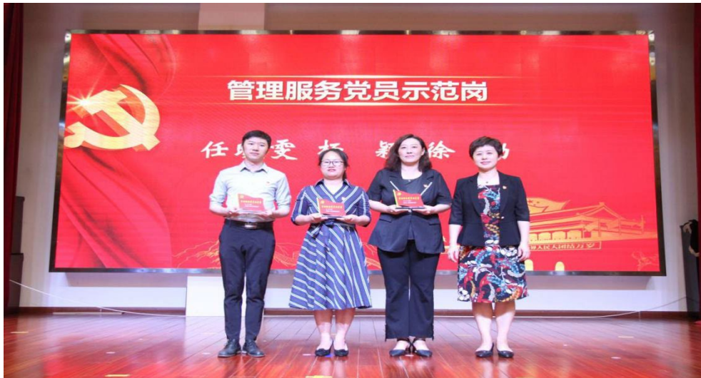
图 6-2 党员示范岗评选

党委坚持党建工作与业务工作同谋划、共部署、共落实，两手抓、两促进。把政治标准作为选拔干部人才队伍的首要标准。重点关注干部在关键时刻、困难挑战面前的表现。注重把对党员的要求落实到日常工作要求中。党员干部冲锋在前。党员示范课堂、党员示范班级和党员示范服务标兵在各个领域发挥着先进模范作用。