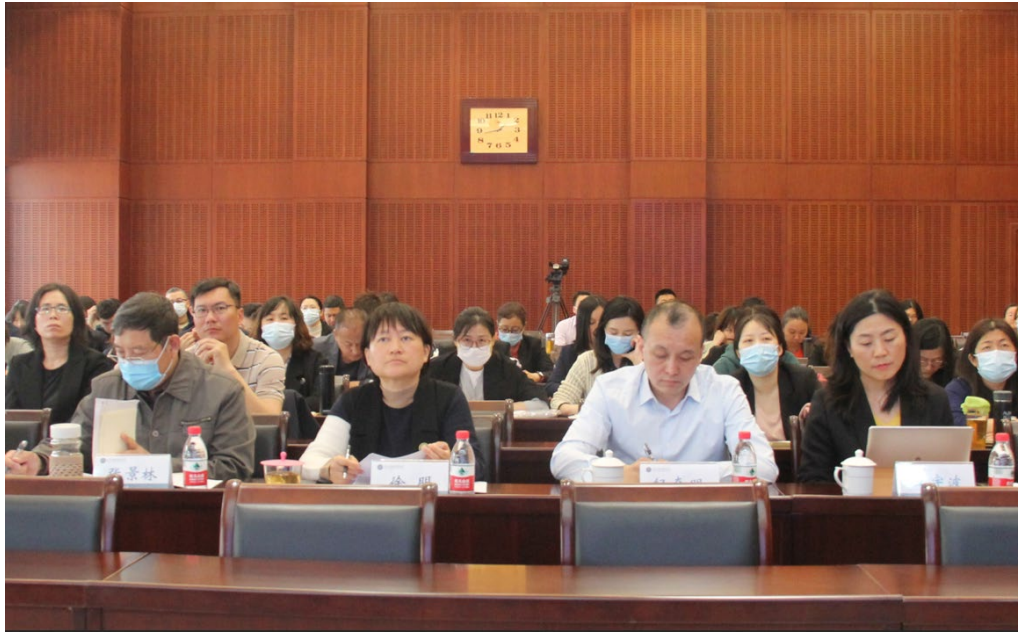
图 6-6 北京市对外贸易学校高水平双师型教师队伍建设工作推进会

目前，学校专任教师 85 人，硕士以上 45 人；专业教师 64 人，其中双师型教师 56 人，占比 87.5%，比 2022 年略有提高。专任教师发表论文 37 篇。