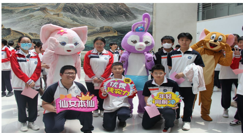
图 6-3 “护航青春·心悦贸校”心理健康游园会

随着《全面加强和改进新时代学生心理健康工作专项行动计划（2023-2025）》的出台，学校在促进学生身心健康、提升学生心理品质上持续发力，构建心理健康宣教、咨询服务、预防干预、资助帮扶的“四位一体”心理育人机制，进一步引导学生关注心理健康、塑造健全人格，培育理性平和、阳光自信的健康心态。在“5·25”心理健康节之际，学校以“护航青春·心悦贸校”为主题开展心理健康游园会活动，活动设置“释放烦恼·表达善意”、“涂鸦放松·绘我心声”、“爱的抱抱·传递温暖”、“绽放笑容·定格瞬间”四个丰富有趣的互动体验环节。活动吸引了 500 余名师生参与，同学们在活动中积极参与、热情投入，真正达到了放松心情、调节身心的效果，营造温暖积极的校园文化氛围。