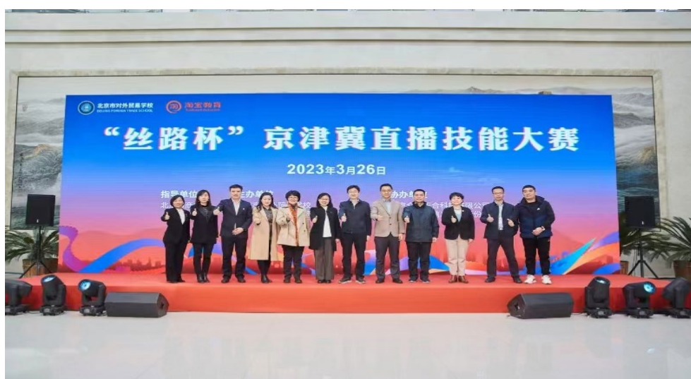
图 2-5 “丝路杯”京津冀直播技能大赛

学校举办京津冀“春晖杯”跨境电子商务运营技能竞赛和“丝路杯”京津冀直播技能大赛。“春晖杯”是由北京电子商务协会行业指导，共有来自京津冀地区 7 所中高职院校参加比赛，充分展示了跨境电子商务专业的教学创新与发展成果，提高了学生的动手、创新能力。“丝路杯”由北京市商务局指导，来自 19 所京津冀地区职业院校和部分电商企业报名参赛。比赛通过信息化平台开展直播技能竞技，为职业学校师生提供高水准直播技能竞技与切磋的平台，提升职校学生的理论水平和实操能力。