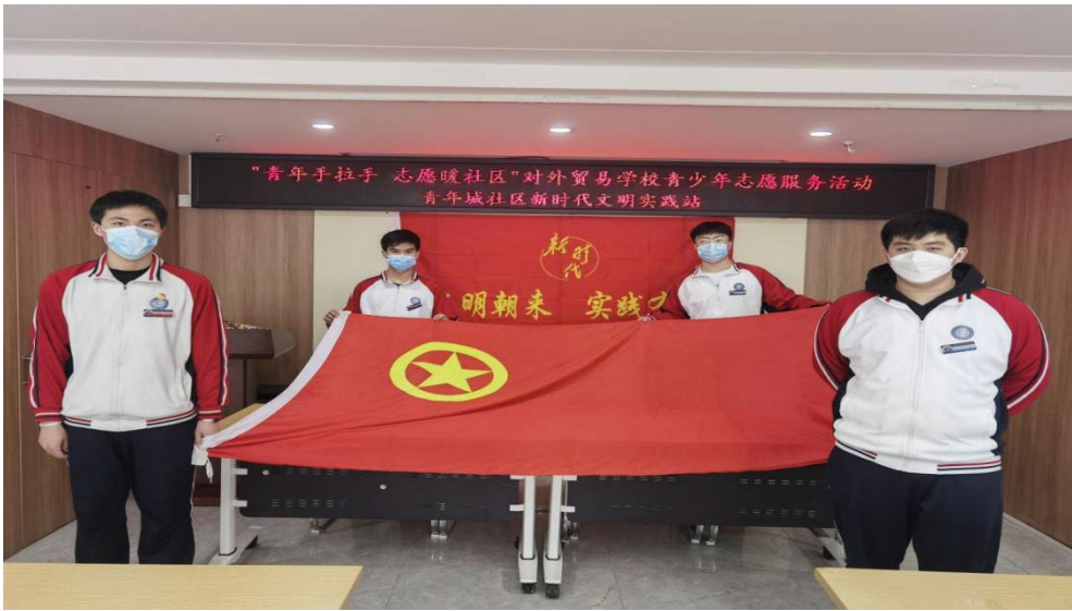
图 2-2 电商小队进社区