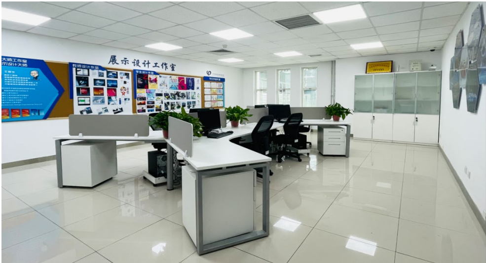
图 3-1 王新生大师设计工作室环境文化营造