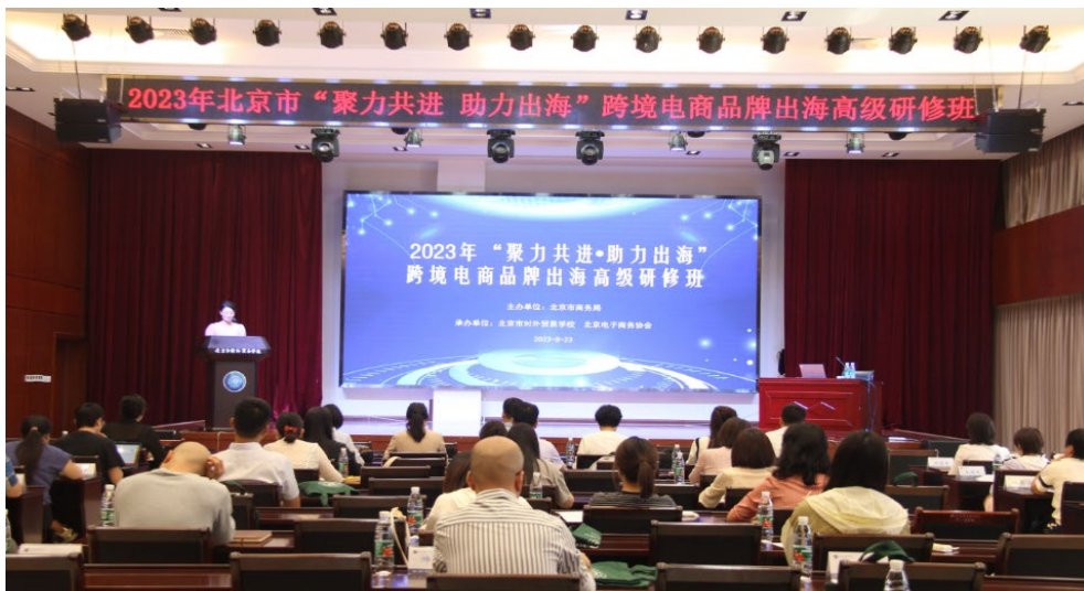
图 2-1 电子商务高级研修班开班仪式

电子商务高级研修班聚焦首都跨境电子商务发展领域与方向，邀请来自对外经贸大学、中国国际电子商务中心、菜鸟网络、盈科律师事务所的专家，全面解读全球跨境电商发展新格局、新机遇。组织学员深入北京亦庄保税物流中心、东港北京产业园进行实地研学，现场了解 AI、区块链等技术在跨境电商领域的应用。此次培训为本市电商行业各方提供了深入交流的平台，提升了学员对新时期跨境电商品牌出海新热点、新趋势的理解和认识。