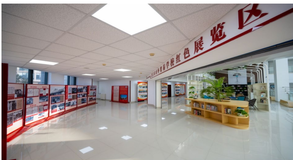
图 3-5 校内打造校内红色教育基地

“红色剧本”强体验。学校引入《抗日保卫战》和《保卫天津》两部红色情景剧本沙盘，通过角色扮演，让师生“跨越时空对话”，沉浸式体验红色历史，传承红色精神血脉。