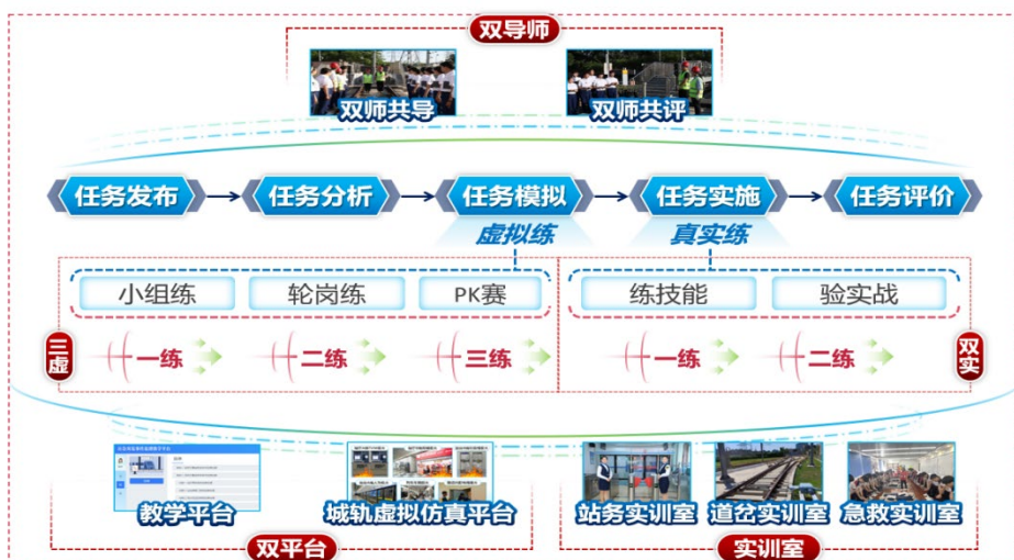
图 1-5 “双平台-双导师-三虚双实”教学模式

城市轨道交通运营服务专业积极探索教学模式改革，依据地铁站务人员典型岗位任务，构建使用“双平台-双导师-虚实结合”教学模式，融合岗课赛证，梳理教学计划，重构教学内容，通过双导师共育人才，将岗位标准规范融入课堂。为解决学习全过程数据整合难、突发场景课堂复制难的问题，校企共同研发教学平台和城轨虚拟仿真平台，将企业典型案例转化为虚拟仿真实训任务，构建“双平台-双导师-虚实结合”教学模式。《城市轨道交通应急突发事件处理》等专业核心课程均采用本教学模式进行教学，并以此为基础参加全国教师教学能力大赛获得二等奖，得到专家与评委的广泛认可。