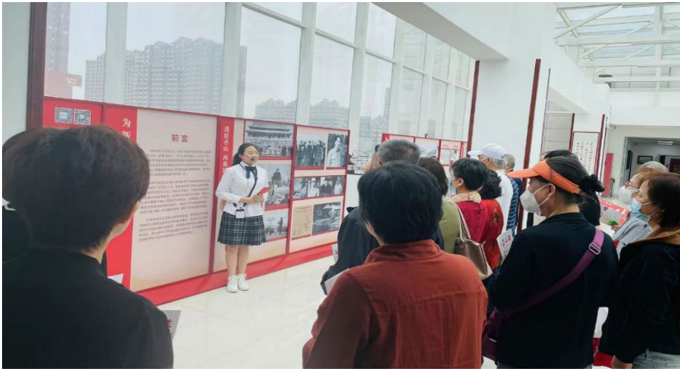
图 3-3 红色讲解员