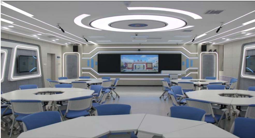
图 1-6 学校智慧教室