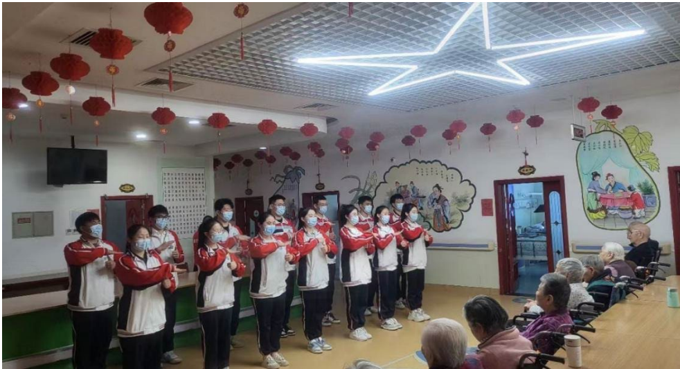
图 6-4 走进敬老院，开展志愿服务活动

歌舞社团的同学通过与老人亲切交谈、切磋棋艺、赠送小手工艺品，通过献上合唱、朗诵、舞蹈、书法等富有专业特色的节目，为来广营乡江达养老院的老人们带来了温暖和关怀，在表达“尊老、爱老、敬老”之情的同时，提高了学生们对“奉献、友爱、互助、进步”的志愿服务精神的认识，让关爱的种子播撒在学生们的心田，让学生们学会关爱，懂得感恩。