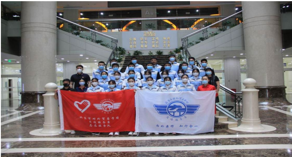
图 2-3 首都图书馆文化志愿者服务

志愿服务团队获得了主管部门和社会的高度认可，2023 年 6 月获评首都图书馆优秀文化志愿服团队奖，累计有 54 人荣获建党 100 周年特殊贡献奖；2 名教师荣获首图优秀志愿教师奖；1 名学生荣获首都图书馆优秀志愿者奖。