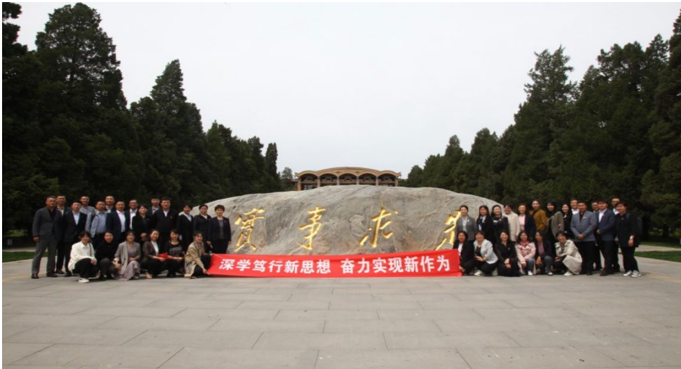
图 6-1 学校组织党员干部到中央党校参观学习