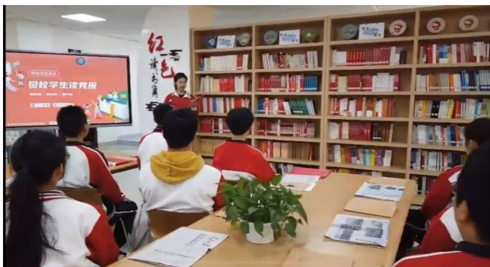
图 1-2 贸校学生读党报主题活动

“书香”是指以软硬件建设为抓手，打造阅读空间、丰富阅读资源，构建书香校园环境，营造浓厚的读书氛围，让书香氤氲校园；“墨韵”是指以构建书香育人机制为目标，开展阅读活动、实施阅读评价、推动阅读联动，促进师生阅读习惯的养成。一年来，打造红色阅读空间、贸校学子读党报、“争做贸校红色讲解员”、组织读书分享会等系列活动陆续开展，成效显著。