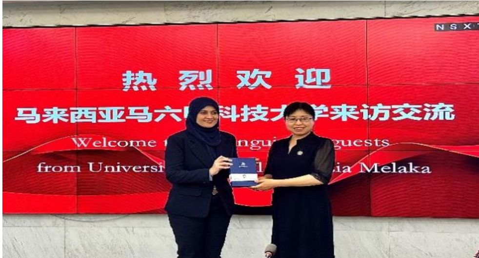
图 4-1 接待马来西亚马六甲科技大学教育同仁

体系等方面的经验交流；三是与国内外民航运输服务领域专家进行广泛合作，制定与翻译了航空服务英语等 4 项适应国际民航运输服务标准的课程标准，为国内外学生学习提供了便利。