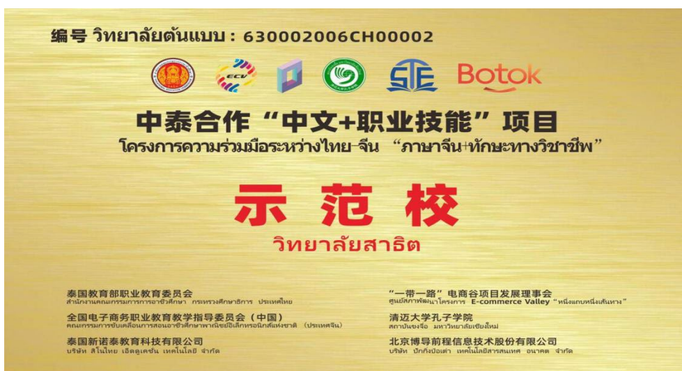
图 4-2 中泰合作“中文+职业技能”项目示范校