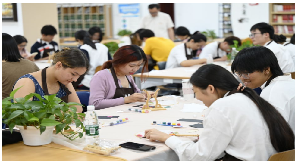
图 4-3 与一带一路沿线国家学生开展文化交流

7月6日上午，学校开展“制扇至美——传统压花团扇制作”活动，首都师范大学来自“一带一路”沿线国家的留学生参加了活动。活动中，花艺老师从团扇文化、工具及花材选择等内容进行详细讲解和指导，学校学生和留学生按照老师讲述步骤，边探讨边创作；双方同学还分享了个人兴趣爱好，了解了学校专业课程设置以及在校的课程安排，并对课余生活，校园文化，各自不同的生活习惯等等进行了跨文化交流。团扇象征着团圆美满，是中华文化的重要组成部分。本次活动促进了中外学生的跨文化交流。