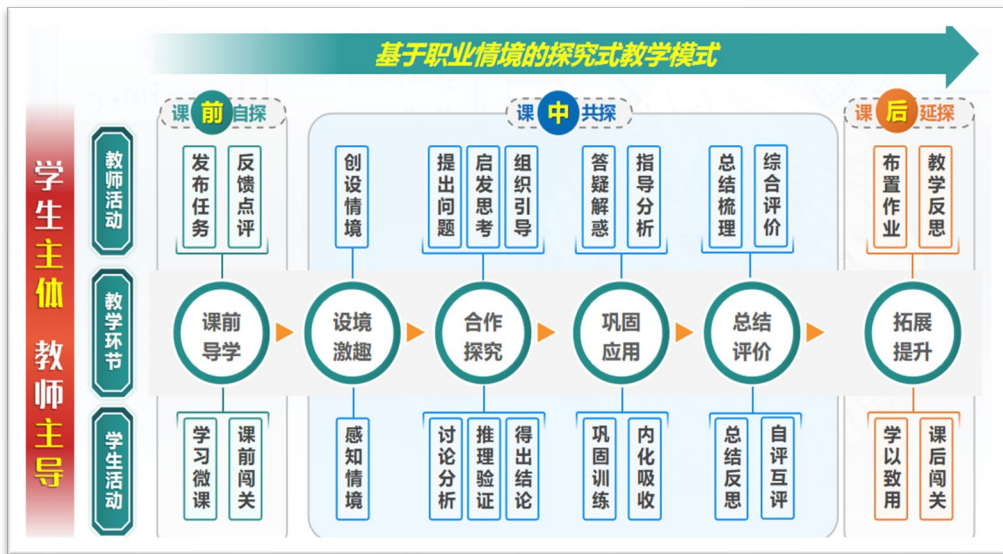
图 1-4 数学课程“基于职业情境的探究式”教学模式图