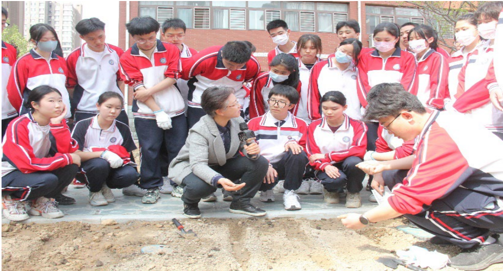
图 1-3 传承农耕文化 弘扬劳动精神

“享成果 懂珍惜”。 组织丰收节，让学生共享劳动成果，培养学生热爱自然，珍惜粮食的良好习惯。