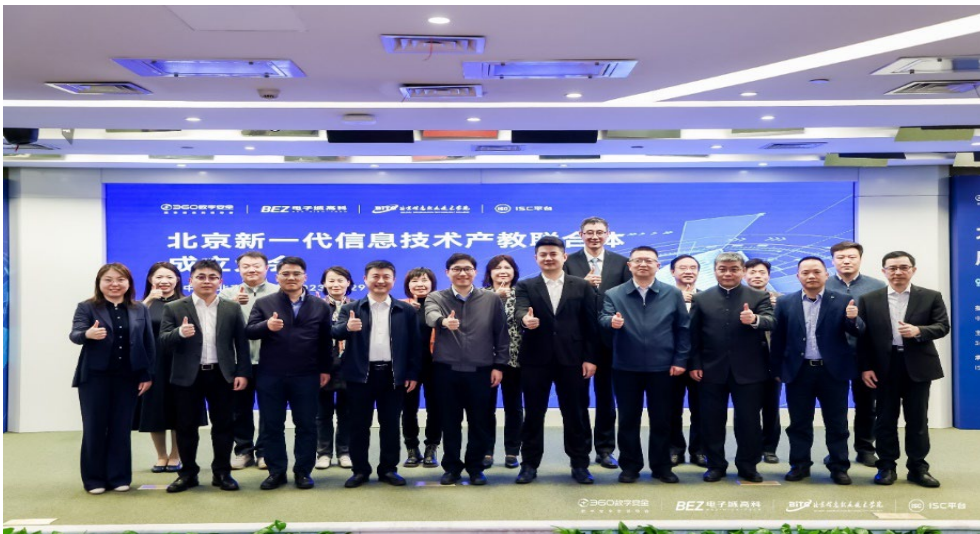
图 5-2 北京新一代信息技术产教联合体成立仪式

由北京信息职业技术学院牵头，以中关村科技园区朝阳园为基础，学校与全市 40 余家单位联合成立北京新一代信息技术产教联合体。联合体政产学研用一体，推动新一代信息技术与职业教育的深度融合。学校依托全域数字化运营专业群等特高项目，大力支持产教联合体建设，对标信息技术产业发展前沿，深化产教融合，加快教学资源建设和课程开发步伐，提高人才培养质量。学校将联合体成员单位，从标准、技术、人员、行业交流等方面，聚力服务首都建设，为实现新一代信息技术产业高质量发展贡献力量。