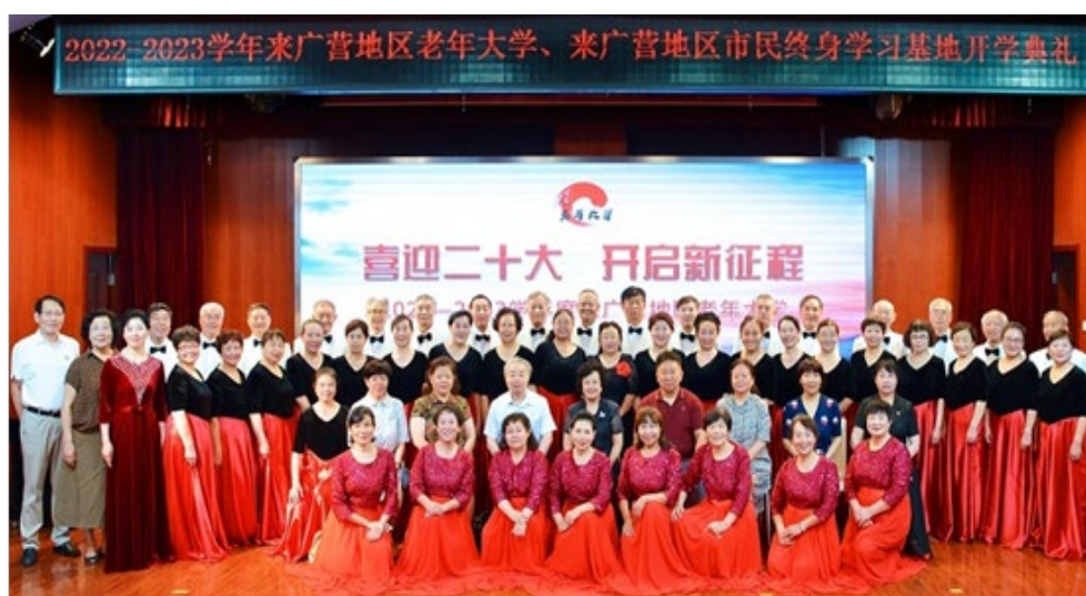
图 2-4 来广营地区老年大学“喜迎二十大 开启新征程”开学典礼