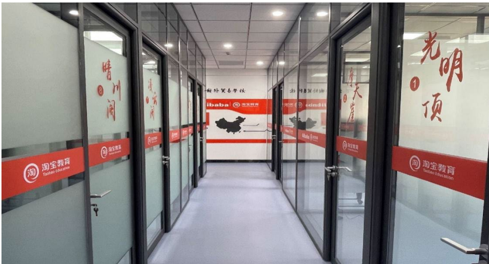
图 3-2 阿里巴巴直播电商学院实训基地

阿里巴巴直播电商学院专门设置了淘宝教育文化展示区域，展示淘宝教育的发展历程、文化理念、发展成果以及直播电商最前沿技术。直播实训基地中所有的直播间以金庸武侠小说中的地名来命名，展示阿里企业文化中独具特色的武侠文化，同学们开展直播聚首“光明顶”，笑傲“凌云阁”。把阿里巴巴“新六脉神剑”的企业文化搬进教室，把教学环境打造成工作环境，加强校园文化和企业文化的融合，为校企双方在各项活动中的高效沟通奠定了基础，也为双方共同的发展愿景提供了保障，确保人才培育、资源共享、技术创新、社会服务等内容的高质量落地。