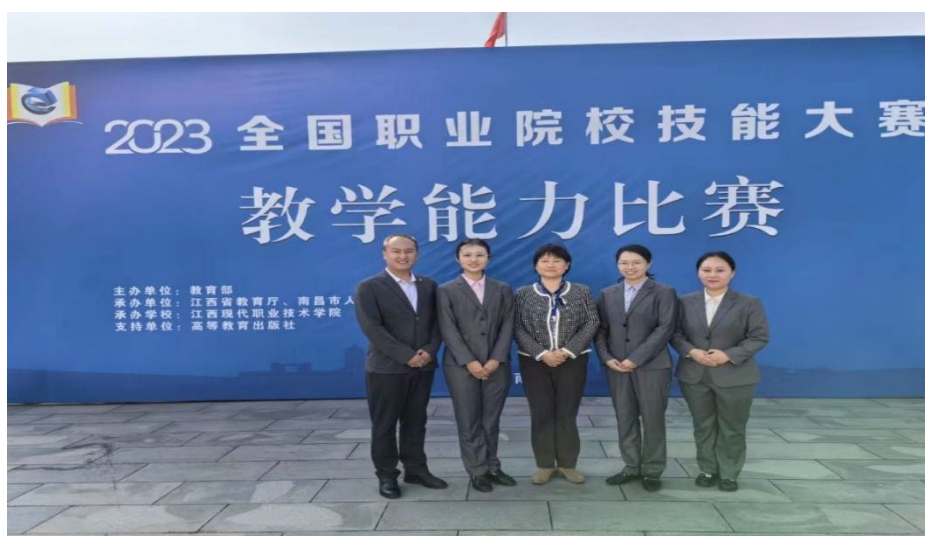
图 6-7 轨道团队代表北京市参加全国职业教学能力比赛荣获二等奖

学校选派 3 个教学团队参加北京市教学能力比赛，全部获一等奖。轨道团队和国商团队代表北京市参加全国职业院校教学能力比赛，分获二、三等奖。