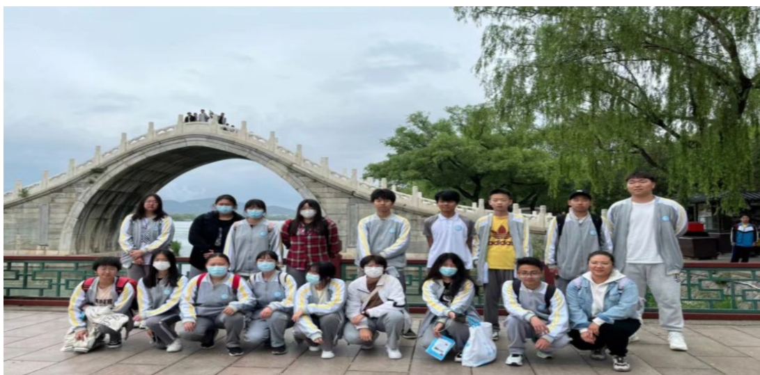
图 1.1.1 浏览京都古河道—参观颐和园

针对中职学生的性格特点，开展主题教育月活动。9月“纪律教育月”：新学期“开学典礼”、“书记、校长讲开学第一课”，新生“系好人生第一粒扣子”，入学教育。10月“请党放心，强国有我”主题教育月：升旗仪式以爱国为主题对学生进行教育，高一新生天安门观看升旗。11月“安全教育月”：安全教育主题班会，消防安全讲座，消防演习。12月“职业生涯规划月”：学生职业生涯规划设计比赛，优秀毕业生入校演讲。3月“志愿服务月”：青年团员敬老院慰问。4月“文化传承月”：清明节为革命烈士扫墓。5月“风采展示月”：校园文化节，“班级红歌歌唱”比赛，朗诵比赛等活动。6月“放飞梦想月”：毕业典礼，让学生感恩母校，着眼未来。每月都有安全教育主题：交通安全、防溺水安全、“同伴进校园”一预防艾滋病教育、“911”消防安全、防诈骗网络安全、食品卫生安全、预防校园霸凌教育、法制安全等专题教育。各种专题教育活动的开展，涵盖了学生健康成长、道德品质形成过程中的各方面工作。