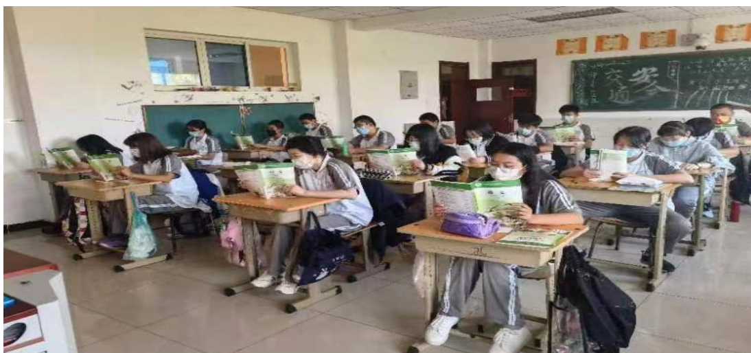
图 3.1 学生晨读

每天早晨班主任组织学生开展经典诵读活动，学校印制中华优秀传统文化经典诵读手册，弟子规以及优秀古诗文，朗朗的经典诵读陶冶着学生们的性情，传承着优秀传统文化。