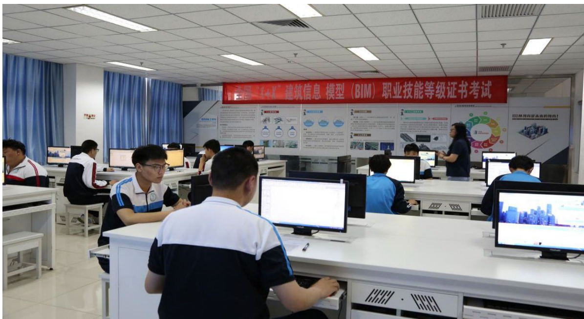
图 1.4.2 “1+X” 建筑信息模型职业技能等级证书考核