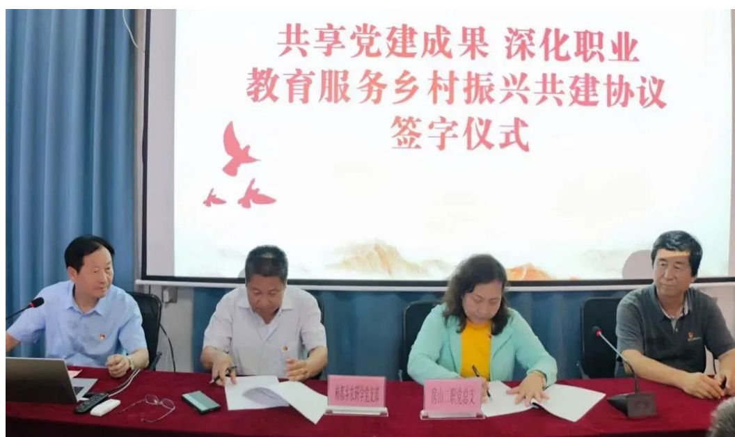
图 6.5.1 房山区职业教育服务乡村振兴工作室启动仪式

6.5.4 根据北京市“双师型”教师认定条件，通过技能提升项目，“双师型”教师比例达 86%。为教师申报高一级职称创造条件，优化教师职称结构。联合开展专业市场调研活动，修改完善 10 个专业的人才培养方案。组织无人机操控与维护专业、大数据专业、建筑工程造价专业等专业教师，参与专业提升能力培训和“1+X”师资培训项目 7 个，32 人次培训 1200 余学时，有效提升教师专业建设能力和职业素养。