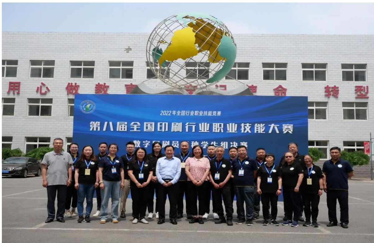
图 1.9 承办第八届全国印刷行业职业技能大赛