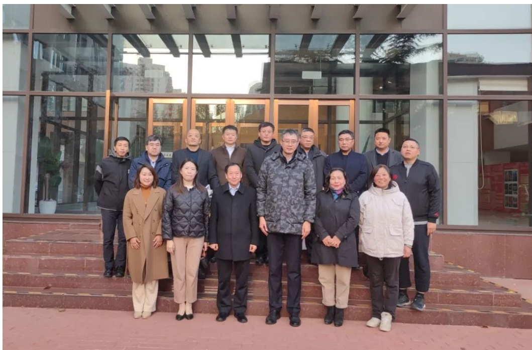
图 1.1.6 走进北京信息职业技术学院调研

“走心工程”：走进课堂，从文化课、专业课、德育课、班团会四类课堂入手侧重培养学生个人品德。走进家庭把家委会、家长学校、家访、家教活动整合起来，侧重于培养学生家庭美德。走进企业以实习前、实习中、实习后三个不同阶段所开展的活动为主线，侧重于培养学生职业道德。走进社会开展社会实践、志愿者服务、社区服务，培养学生良好的社会公德。“走心工程”立德树人新模式，使学校德育管理思路日益清晰，德育管理体系日益完善，育人成效日益突显。