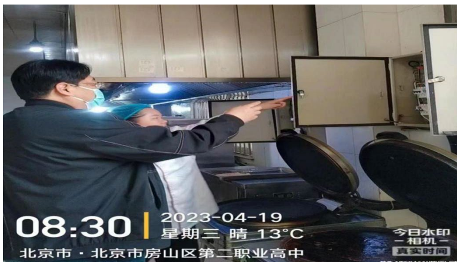
图 6.3.6 检查食堂用电情况