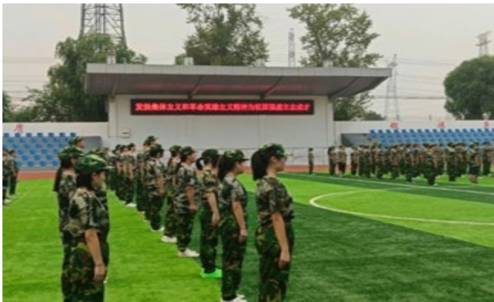
图 3.3 学生队列展示

2023 年 5 月 16 日，全国国防示范校授牌仪式在我校隆重举行。我校荣幸的成为七所示范校之一。首先，同学们聆听了张茂忠英雄的事迹，其次观看了国防教育展板，了解到国防教育的重要性、国家对国防教育的重视性。最后同学们来到操场体验模拟射击。学校积极做好“国防教育+红色教育”的品牌培育，进一步增强我校师生的国防观念，深化国防教育精神。在 2023 年 8 月中旬对高一新生进行了军训活动，在七天的军训中增强了学生的身体素质、培养了吃苦精神，磨炼了意志品质，提升了自信心和责任感，学生的文明礼貌的养成在军训中也初见成效。