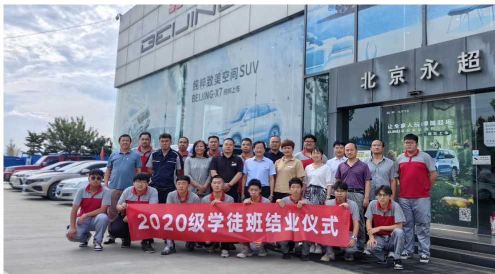
图 5.1 第六届现代学徒试验班结业

房山区第二职业高中汽车运用与维修专业现代学徒制试点工作，遵循职业能力形成规律，探索形成“3+2+2+1”的岗位课程设置，“3”指以汽车机修岗位课程（维护、修理、诊断）；第一个“2”指汽修专业主要拓展岗位课程（钣金、喷漆）；第二个“2”指辅助拓展轮岗课程（维修顾问、库房管理）；“1”指视需要启用的岗位课程（汽车销售）。校企双方构建了以“行为规范、理论扎实、技能娴熟”作为人才培养主方向，构建了“多维度、双重共进式”现代学徒制学业评价标准。学校评价从理论知识、操作技能、行为习惯三个维度进行评价，企业从工作任务完成质量、学徒手册完成质量、企业学徒期间表现三个维度进行评价。校企双方评价合格才能达到学徒出师标准。