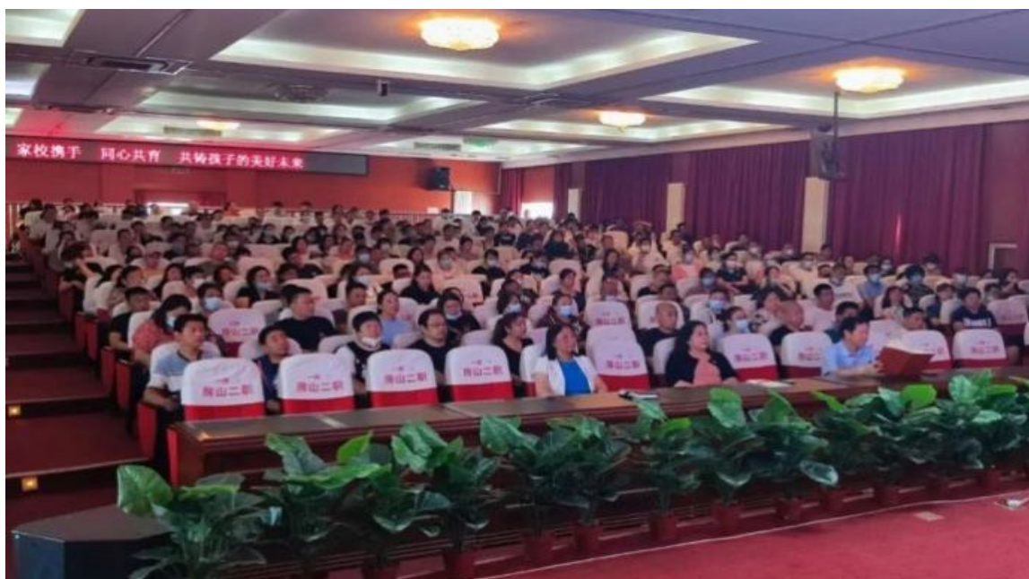
图 1.1.4 家长会现场

1.1.6 加强家校联系，为学生的健康成长同心共育，携手同行。每学期召开一次家长会，让家长深入了解学校的办学理念、办学特色、学生的学习内容、专业发展前景、学生的在校状态和日常存在问题等，利于家校共育。开通家长热线、组建家委会、开展家庭教育讲座、校园家长开放日、家访等多种形式，凝聚家校育人合力，引导学生努力成为“有理想信念、有优良品德、有过硬本领、有责任担当”的新时代职高生。