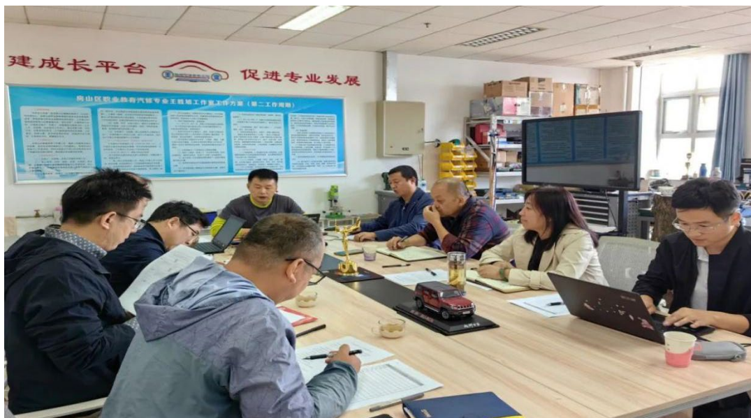
图 1.7 与企业专家沟通交流

条件;同时,学校申请的市级课题《校企合作背景下房山二职无人机操控与维护专业建设的实践与研究》成功立项,目前正在和相关企业一起有序开展实质性的研究。科教融汇、产教融合、校企合作办学是我校矢志坚守的办学方向,是学校高质量发展的不竭动力。