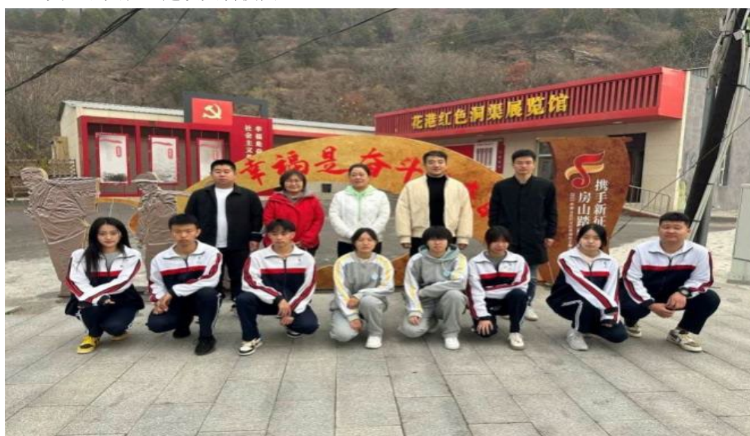
图 1.1.3 雏鹰社团山区调研

1.1.3 充分发挥学校共青团、学生会的作用，培养学生的自我管理能力。在政教处、团委领导下，通过开展健康有益的活动，把广大学生凝聚在一起，带领学生共同进步。实现做“有样”中职生的培养，打造“He”美二职文化，建设文明校园。