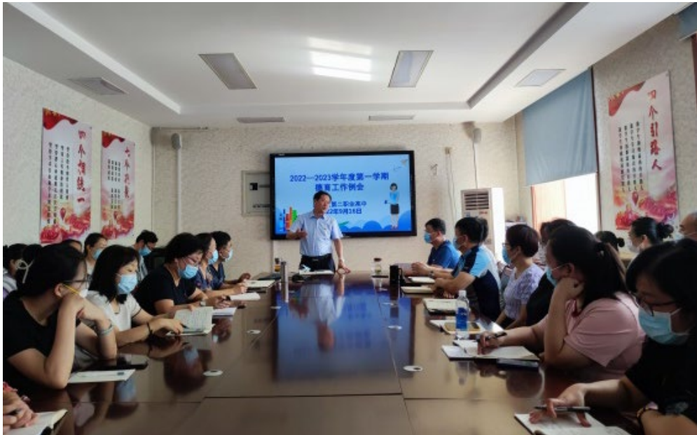
图 6.5.5 班主任例会

署，并对班级管理出现的典型案例进行分享，通过谈论交流，实现共同提高；三是制定骨干班主任培养计划。本学年计划培养校级骨干班主任 15 名，区级骨干班主任 5 名，落实到人；四是每学年都选派班主任参加班主任能力大赛（市级），借助大赛帮助班主任提高管理能力，找到差距，努力提升学校德育品牌，也为班主任个人素质的提升提供了平台。