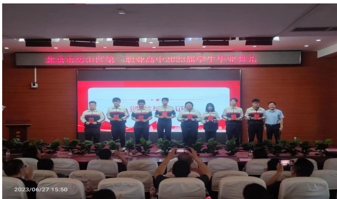
图 1.1.2 2023 届毕业生典礼

1.1.3 充分发挥学校共青团、学生会的作用，培养学生的自我管理能力。在政教处、团委领导下，通过开展健康有益的活动，把广大学生凝聚在一起，带领学生共同进步。实现做“有样”中职生的培养，打造“He”美二职文化，建设文明校园。