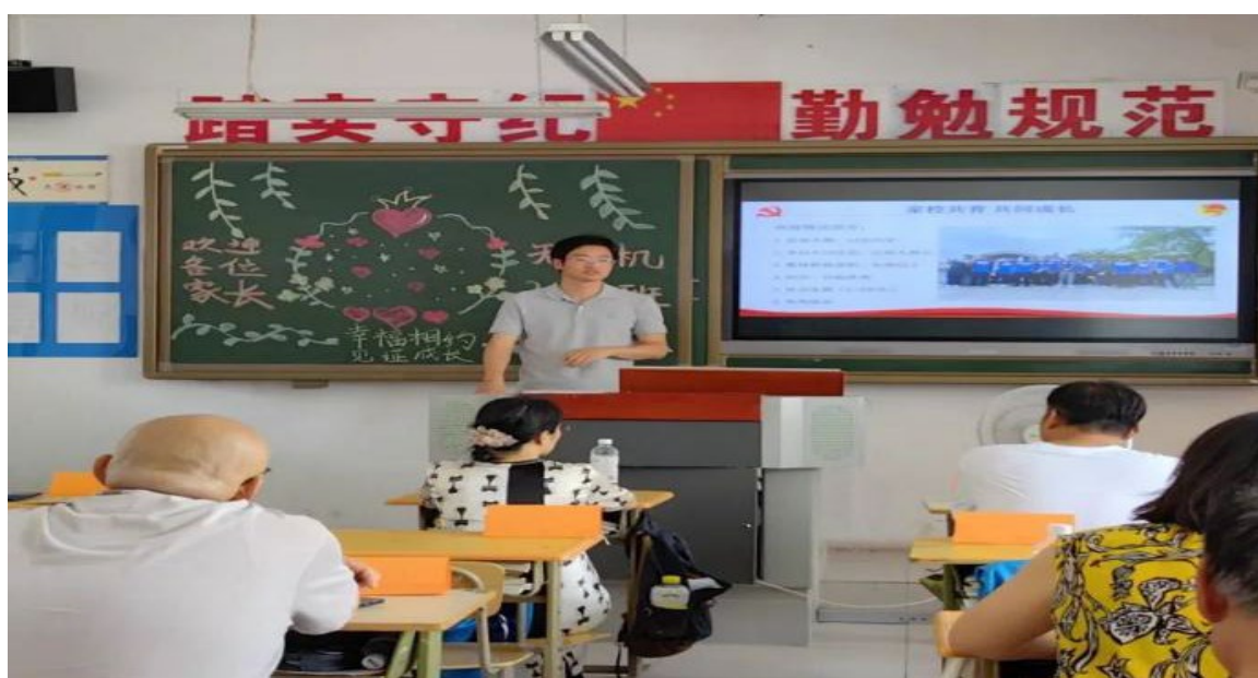
图 1.1.5 班级家长会