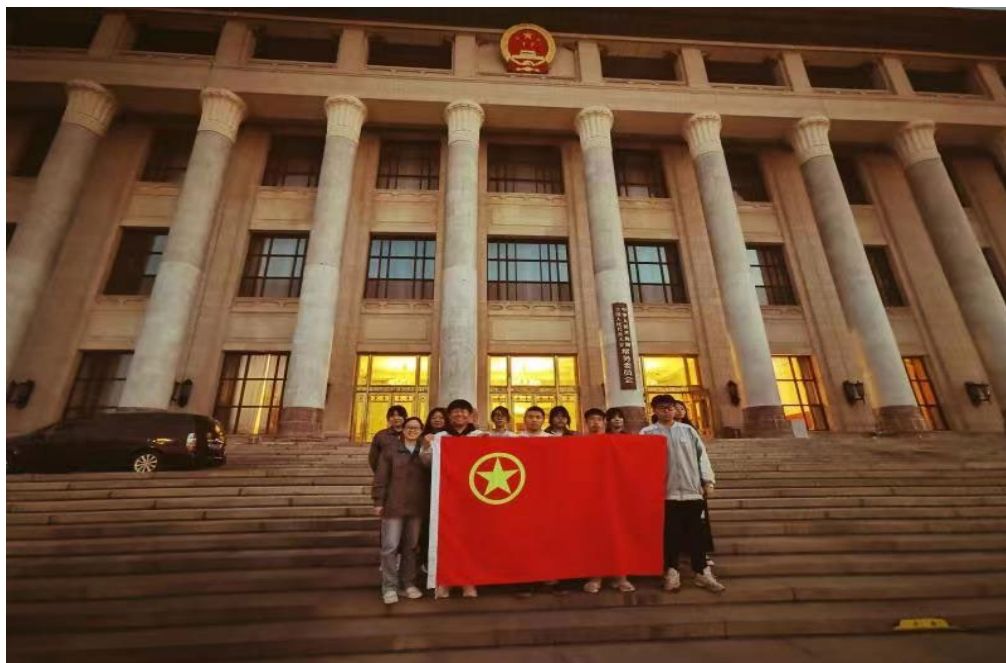
图 6.1.师生人民大会堂送文件

远跟党走”的信念，连续六年的“零伤病”、“零浪费”、“零事故”的“三无”战绩，选树出一大批具有政治认同、职业精神、法治意识、健全人格及公共参与核心素养的榜样学生。充分展现了高质量党建引领学校高质量发展的成果。