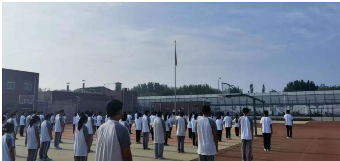
图 6.6.3 周一升旗

学校注重学生日常行为习惯的培养，坚持“管、教、育”相结合的管理方式，健全完善学生管理规章制度与学生行为规范，进一步细化学生的日常行为要求，教育和引导学生养成良好的道德品质、行为习惯和健康向上的生活乐趣。将养成教育作为学生日常教育的重要内容。形成了由政教处、系部主任、班主任（宿管员）、学生干部为主体的四级管理体系。引导学生自觉规范自身行为，促进学生德智体美劳全面发展。