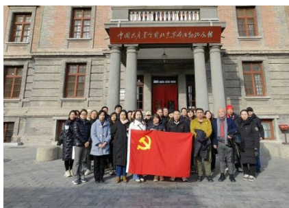
图 20 党员教师北大红楼参观

11 月 28 日，为深入学习贯彻习近平新时代中国特色社会主义思想，北京市求实职业学校党委组织开展了“走进北大红楼”主题党日活动。北京大学红楼位于东城区五四大街，始建于