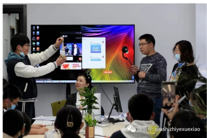
图 28 电商直播实训 1

学校与京东文化教育公司共建共享电商直播人才培养生产性实训基地，旨在为学生提供真实的职业环境，增强其实践能力和职业素养，同时也为企业培养合适的人才，推动产业的发展和社会服务能力的提升。通过牵头建设该实践基地，学校与企业实现了深度合作，共同推动了产教融合的发展。学生们在实践基地中获得了真实的职业体验和实战机会，提高了其实践能力和职业素养。同时，企业也通过参与实践中心的建设和运营，培养了合适的人才，推动了产业的发展。此外，该实践基地也为红十字会基地线上直播培训提供了场地和技术支持，也为京津冀和内蒙古巴林左旗、卓资县和察右后旗等职业院校参观和培训提供了条件，发挥了实践中心的影响力，为更多学生、企业、社区提供更好的实践机会和发展平台。