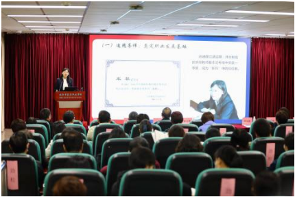
图 34 市级骨干车菲名师展示活动

“博实”计划助力名师成长。博实计划针对学校市级以上骨干，建立名师工作室，通过导师带教活动多维度助力名师在院校、企业及专业领域确立发展影响力。