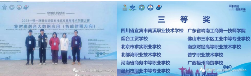
图 27 “一带一路”暨金砖国家技能发展与技术创新大赛获奖

学校会计事务专业与数字化财税行业云账房网络科技有限公司开展产教融合共同体，实现了产教资源整合，构建了产教供需对接机制，并签订了学徒制培养模式下联合培养学生的校企合作协议书。这使得代理记账公司得以引入校内，共建共享生产性实训基地，校企推进中国特色学徒制模式下课堂教学改革，形成了校企双师双境教学，学徒三段进阶式培养路径，学生在真实业务环境下识岗、跟岗、顶岗的工学结合课程的学习，并在课程中提升爱岗敬业、责任担当、制度自信的思政素养，以及诚实守信、精益求精的工匠精神。通过校企双元育人，学校成功实现了中高职人才培养的对接和提质。同时，这也提升了教师数字时代下新技术迭代发展与时俱进的实践能力，并增强了师生的社会服务能力。学校的会计事务专业核心课《代理记账业务》课程教学设计荣获北京市教科院职成教研所组织课程思政标杆选树项目特等奖，课堂教学、考核方案和教案也荣获一等奖；团队教师还参与了国家教学资源库建设任务。此外，还指导学生获得了“一带一路暨金砖国家技能发展与技术创新大赛之第二届财税融合大数据应用(智能财税)赛项总决赛”三等奖的好成绩。这些成果充分展示了行业产教融合共同体的强大作用，这不仅推动了学校的专业建设和发展，也为整个行业的发展提供了有力的支持。