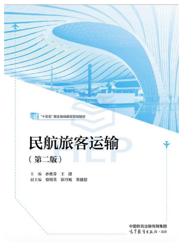
图 9 《民航旅客运输》教材

学校致力于专业团队建设,在产教融合的基础上,积极扩大专业的引领能力。2021 年-2022 年,8 个专业参与教育部专业教学标准及实训基地标准建设制订,其中 3 个专业(文秘、幼儿保育、计算机平面设计)牵头国家专业教学标准制定,数字财经商贸系作为中职牵头校和执笔人参加了中职国家金融事务专业实训标准的研制工作。4 个专业(商务日语、金融事务、航空服务、图书档案数字化管理)参与教育部标准制订,提升骨干教师在专业领域的影响力。在专业教师系统吃透专业教学标准的基础上,学校积极组织专业骨干参与规划教材开发。经过学校推荐,网络、航空服务、幼儿保育、金融事务等专业共有 10 本教材入围“十三五”复核教材及“十四五”规划教材,参与 2 本规划教材编写,在评选中位列全国中职第十名。2023 年,2 本专业教材被推荐为北京市职业教育优质教材。5 个专业积极参与国家资源库建设。参与国家标准建设的目的在于拓宽专业教师视野,占领专业发展的制高点。如幼儿保育专业成功申办了全国职业院校技能大赛中职组婴幼儿保育赛项,在全国同类专业中起到了引领、辐射作用。