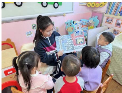
图 8 学生深入幼儿园实践

幼儿保育专业通过特高骨专业建设，创新了“园校一体、五双融合”的人才培养模式。“园校一体”即园校双方在建设理念、发展需求和发展目标上达成共识，实现行政管理、业务管理和业务执行三个层次的深度融合，将决策、执行与监督形成合力，生成双向资源整合的共同体，在课程设置、教学与教研、教师培训与服务等方面建立园校融合运行机制和制度，共促发展。“五双融合”即“双环境、双导师、双角色、双课程、双评价”融合。学校与幼儿园双环境下，将岗位工作任务转化为课程教学内容，将岗位工作能力标准转化为实践学习评估标准；专业教师与幼儿园教师“双导师”进行实践教学与评估；学生既是学习者又是幼儿园实践者，“双角色”完成实践学习，学生在学校教师的指导下进行校内学习、模拟训练，在幼儿园观察并记录幼儿园教师工作过程，并在真实环境中完成实践任务；学校专业教师和幼儿园教师共同评估指导，学生在评估中反思改进，学校教师在指导过程中根据学生学习需求和目标达成，调整优化学习内容。