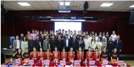
图 12 汇报演出后与学生与领导合影

为充分发挥北京中职优势教育资源，助力巴林左旗中职教育，华夏职业学校幼儿保育专业优秀学生到北京市求实职业学校进行为期三周的学习交流活动。学校为本次活动精心组织了开营仪式，定制学习课程和教学实践，并安排专业教师对 5 名即将参加大赛的学生进行针对性辅导。此次交流主要是借助北京先进的教育资源，雄厚的师资力量，多元的教学模式，通过短期学习，使华夏职业学校幼儿保育专业优秀学生接触和了解幼儿保育学科的学术前沿动态，扩展视野，提高专业水平，为成为一名优秀的幼儿保育工作者打下基础。