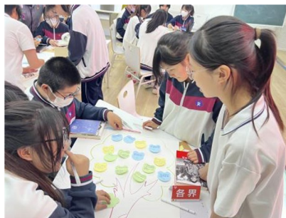
图5 学生制作读书心得展示材料