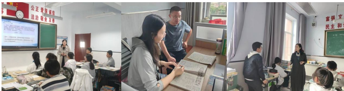
图 14 三位支教教师工作中

话、辩论赛等大赛评委，多次为察右后旗地区师生开展说课培训、教科研培训以及读书讲座，受到师生热烈欢迎。