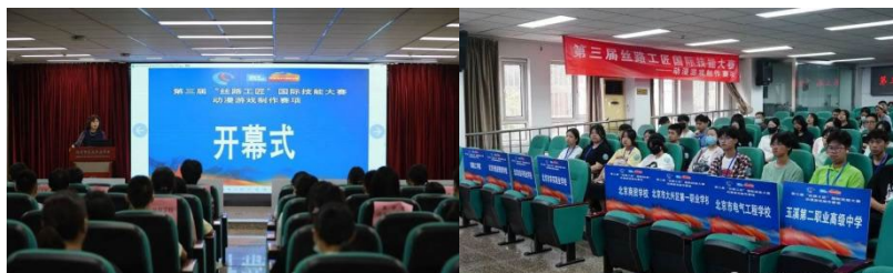
图 23 第三届“丝路工匠”国际技能大赛——动漫游戏制作比赛

打造北京职业教育国际化品牌，提升首都职业教育国际影响力。大赛以“和平合作、开放包容、互学互鉴、互利共赢”