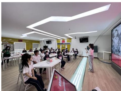
图4 介绍习近平知青生活事迹

书记的七年知青岁月，引导学生以绘制思维树的学习形式，感受他吃苦耐劳的精神和崇高的精神境界。学生在学习交流中结合阅读内容各抒己见，分享心得，展示学习成果，深刻感悟习近平总书记在知青生活中脚踏实地为群众办实事的务实精神和开拓精神。