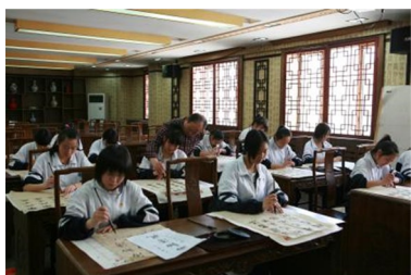
图 15 学生上书法课

书法学习让学生通过书写了解了书法文化知识，也增强了学生的文化自信。学校设有书法专业教室，在近 180 平米的专业教室中，配备了适合学生书写的课桌椅和投影设备。为了让学生在潜移默化中感受到书法文化的魅力，教室内专门配备了展示柜，陈列了文房四宝等书法用品，还从西安碑林采购了一整套古人碑帖陈列其中，使学生随时随地都能够观赏和体味书法文化的博大。在教室墙外还建设了很有特色的书法文化展示墙，里面既有名帖名砚，又有学生和老师们书法佳作，营造出书法学习氛围，也美化了校园。通过在全校开展书法教育，让书法这一民族优秀传统文化在学生心中扎下了根，学校也被教育部授予中小学优秀传统文化书法项目传承校。