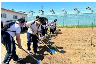
图 17 体验春种的艰辛

区 101 农场进行农耕劳动社会大课堂综合实践活动,让学生充分体验从种到收的农耕全过程。劳动过程中,学生通过亲手种植与收获,体验劳动的艰辛;看到家畜们在悠闲地寻食散步,享受着丰富的食物,感受到了人与动物的和谐相处。活动不仅锻炼了学生吃苦耐劳、克服困难的坚强意志,也培养了学生珍惜劳动成果的情怀,养成勤俭节约和艰苦朴素的好作风。