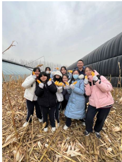
图 18 感受丰收的快乐

农耕文明是中华优秀传统文化的重要组成部分,应该得到保护和弘扬。因此学校把劳动教育与传统的农耕文化紧密结合,组织学生参与农业的田间耕作活动。让学生亲身体验,学校分别在春秋两季组织学生到通州