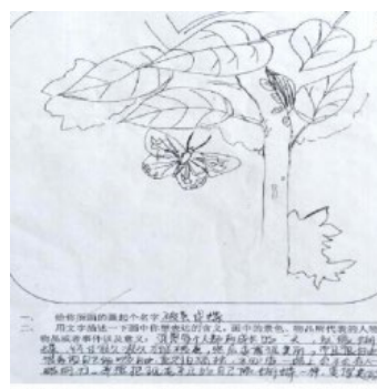
图7 学生破茧成蝶意象画

以意象画开启德育教育入心路径，搭建心育正能量场域的心育方法，已推广应用到河北、内蒙、贵州、山西、甘肃等地，帮助教师读懂学生的内心，引导更多教师建立和谐的师生关系，培养更多学生具有积极心理品质。