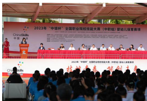
图 10 全国婴幼儿保育大赛开幕式

比赛遵循“基于教学、高于教学、引领教学”的原则，设置“职业素养测评”、“婴幼儿保育技能实操”、“婴幼儿早期学习支持”三个模块，充分发挥赛项对职业教育的“树旗、导航、定标、催化”作用，提高相关专业的办学水平，助推保育员专业化发展。求实职业学校作为首届婴幼儿保育赛项（中职组）的承办校，克服了赛项新，赛事复杂，