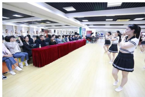
图 32 视导组观看学生技能展示