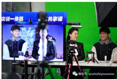
图 29 电商直播电实训 2