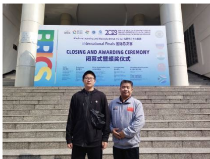
图 26 2023 年金砖国家职业技能大赛机器学习与大数据国际总决赛

依托联合体,学校大数据技术应用专业的学生在 2023 年 11 月金砖国家职业技能大赛数据分析可视化、机器学习与大数据国际总决赛中获得