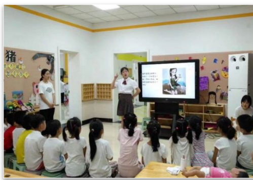
图 30 幼儿保育专业学生教学实践

幼儿保育专业作为学校的骨干龙头专业，以服务民生福祉为使命担当，支撑国家战略和区域经济社会发展，目前开办了一园五址的学校附属幼儿，在园幼儿达 460 人。一年来，不断拓展其办学功能，专业建设立足朝阳、服务首都、辐射全国、走向国际，努力建设为首都一流、全国领先、具有一定国际影响力的中职学前教育专业。