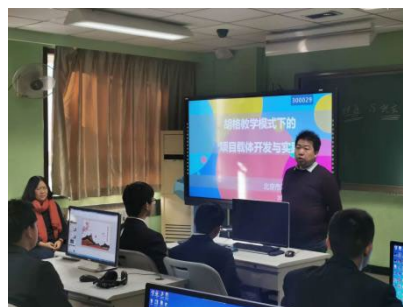
图 22 进行胡格项目教学

作为北京市教育科学院教学改革项目——澳大利亚 TAFE 和德国胡格项目的牵头实验校，学校积极探索并吸纳国外先进教育理念，提升学校专业办学品质。幼儿保育专业通过学习和实践，将澳大利亚 TAFE 理念进行本土化改造，形成了“三位一体，四轮驱动”园校院一体化人才培养机制实践研究成果，获得北京市教育教学成果二等奖，为进一步提升专业人才培养质量打下了坚实基础。动漫与游戏专业借鉴德国胡格项目式教学理念，教学做一体，教学质量取得质的飞跃。