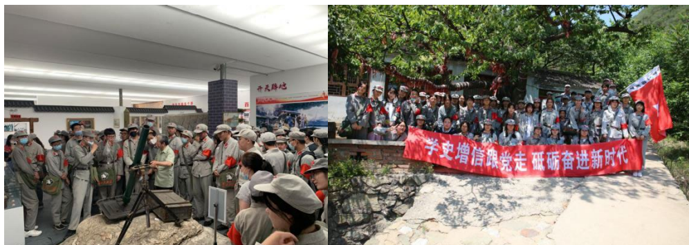
图 21 学生体验红色之旅

红色教育作为立德树人教育内容之一，学校每年都组织学生前往爱国主义教育基地，宣讲红色故事，传唱红色歌曲，体验红色之旅，进一步激发学生们的革命斗志。穿红军装、走红军路，亲身感受抗战时期红军的艰难困苦；巧过关卡、冲锋陷阵，感受战士们忘我牺牲的英雄气概；传递情报、翻译线索，体验了“地下”工作的严酷与艰辛；紧握长枪、高举军旗，在长城之巅“胜利会师”，体验了革命胜利的激动与豪情。此外，学校还借助全民国防教育日、清明