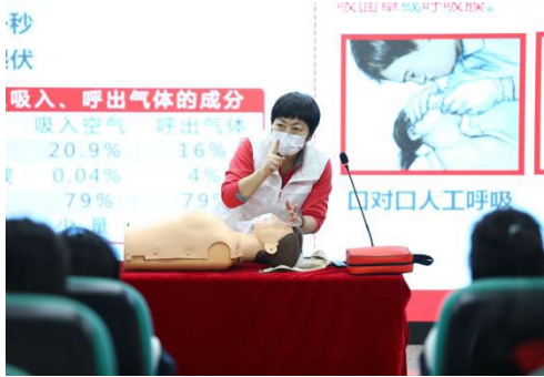
图 11 红十字应急救护培训

学校借助求实职业技能培训学校对外培训平台，长期专注于红十字应急救护知识普及、传播与技能培训，是红十字精神“人道、博爱、奉献”的坚定拥护者。作为北京市红十字会、朝阳区红十字会的双料应急救护培训基地，在市区两级红十字会的引导与指导下，学校对外分别开设 4 学时、8 学时、16 学时培训课程，培训内容涵盖心肺复苏及创伤救护知识实操演示与讲解，常见急症现场处理、现场避险逃生知识、突发事件和意外伤害现场应对等应急救护知识技能等，本学年面向企业、街道、学校等提供应急救护培训 7000 多人，同时还组织了 4 次志愿服务活动，取得了较好的成绩和荣誉。本学年荣获北京市朝阳区红十字会颁发的“公益事业贡献奖”和北京市红十字会颁发的“北京市人道奖先进集体”，提升了学校的社会培训知名度，扩大学校服务社会的影响力。