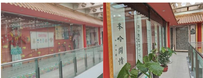
图 16 传统文化廊