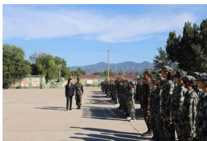
图 2 学生接受国防教育

习为“核心”，形成高一以军训和急救培训为重点，高二以红色教育实践活动为主题，高三以选拔国旗护卫队树榜样为引领