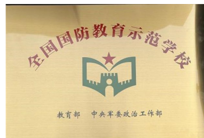
图 3 国防教育示范校铜牌

的“三阶梯”，突出爱党爱国爱军教育。2023 年 3 年，学校被教育部、中央军委政治工作部认定为中小学国防教育示范学校。