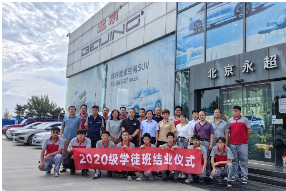
图 5-1 第六届现代学徒试验班结业