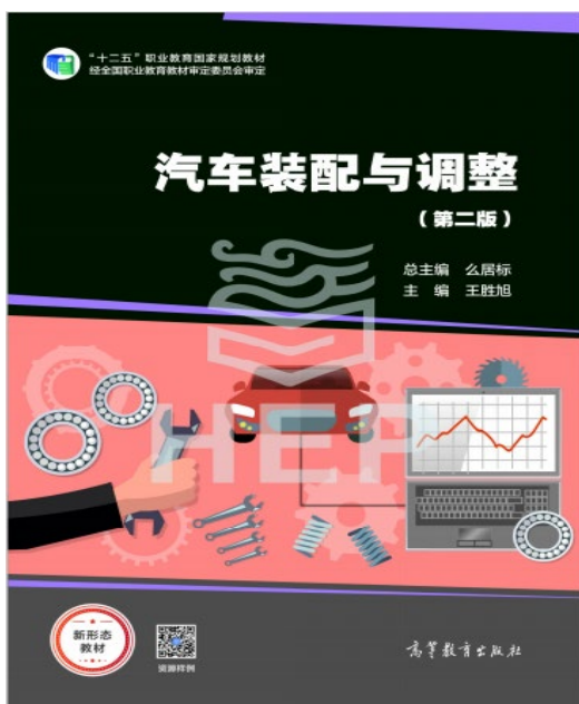
本书二维码资源列表

房山区第二职业高中持续推进落实《职业院校教材管理办法》，扎实推进职业院校新常态教材工作改革创新，与产教融合体内大学、高职和中职、长安汽车北京公司等行业企业合作。对接职业教育国家教学标准体系。立足校企合作和企业实际生产线模式，坚持以工作过程为导向和典型工作任务为载体。能够适应现代学徒制教学需求和应用互联网技术现代化教育信息技术手段，配套网络教学资源。有机融入思政元素，在链接资源中融入了中国汽车企业故事、工匠精神等内容，培养学生爱国敬业及民族自信；同时在生产工作环节为学生在学徒或实践过程中养成爱岗敬业、形成以 7S 为主的良好职业习惯提供了有效载体和平台，教材入选“十四五”职业教育国家规划教材。