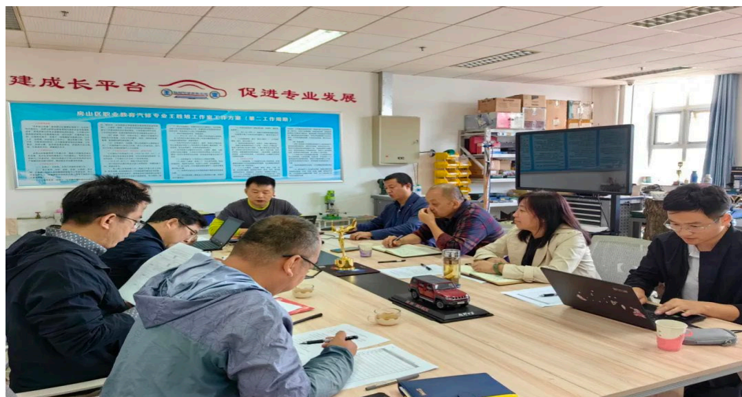
图 1-7 与企业专家沟通交流

学校与北京航景创新科技有限公司、北方天途航空技术发展（北京）有限公司、北京信息职业技术学院深度合作，对我校新办无人机专业建设进行全方位、立体式打造，为“2023 级《无人机操控与维护》-《无人机应用技术》人才培养方案”在服务岗位、培养目标和规格上进行了确定，构建了课程体系，特别是与区域内优质企业航景创新科技有限公司合作，成功申办了飞行空域，为学生实习实践创造了有利条件；同时，学校申请的市级课题《校企合作背景下房山二职无人机操控与维护专业建设的实践与研究》成功立项，目前正在和相关企业一起有序开展实质性的研究。科教融汇、产教融合、校企合作办学是我校矢志坚守的办学方向，是学校高质量发展的不竭动力。