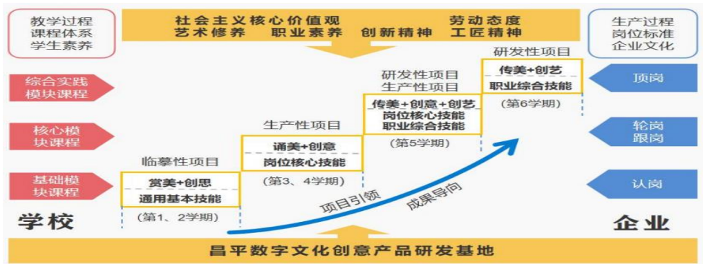
图2 “双主体、项目化、技艺创融合”现代学徒制人才培养模式图

数字媒体艺术专业群与亿和文华、若森数字、立思辰等企业合作，建立集群化产教融合平台，开展“双主体、项目化、技艺创融合”现代学徒制人才培养。依托昌平数字文化创意产品研发基地，学校企业双主体育人，教学过程与生产过程对接、课程体系与岗位标准对接、学生素养与企业文化对接，开展临摹性项目、生产性项目、研发性项目等项目制教学，实现专业技能、艺术修养、创新创业“三融合”，培育能适应数字文化创意产业岗位技能迅速迭代，具有“厚人文、有创意、善设计、精技术”品质的复合型媒体人。