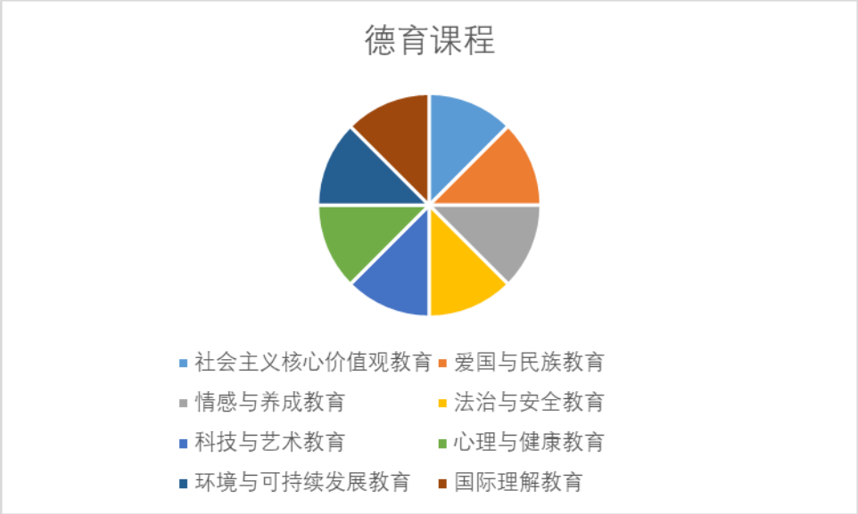
图3 北京市国际美术学校德育教育主题

北京市国际美术学校围绕“社会主义核心价值观教育”“爱国与民族教育”“情感与养成教育”“法治与安全教育”“科技与艺术教育”“心理与健康教育”“环境与可持续发展教育”“国际理解教育”八大主题（见图3），实施德育课程。学校注重开发新的德育课程资源，比如邀请北京京剧院的老师为学生进行京剧文化教育活动。