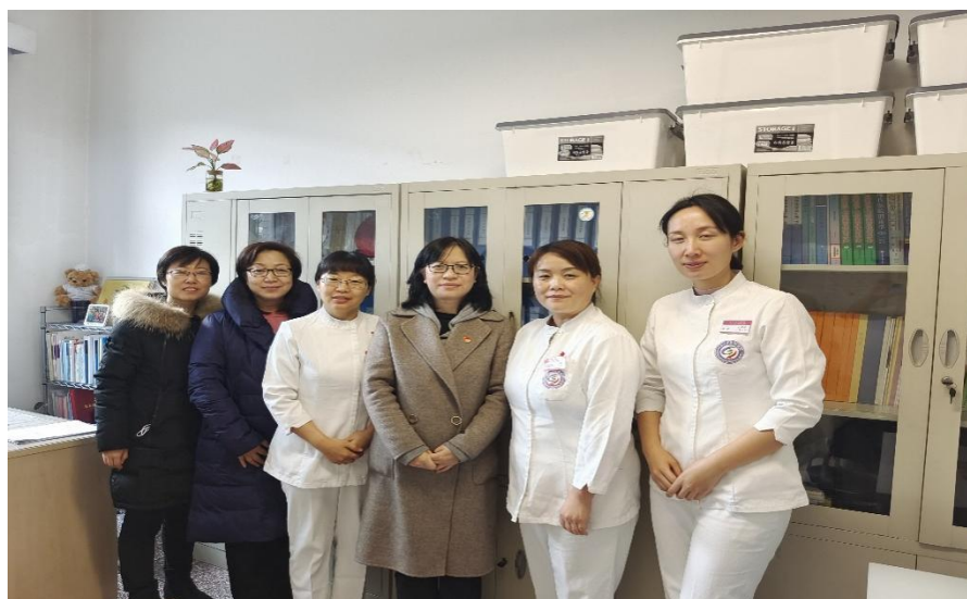
图 4 首钢工学院护理专业老师到北京大学首钢医院实地考察

10 名护理学生和 5 名社区康复学生到首钢医院实习，学生在医院实习期间，学习并实操了各项专业技能，在相关科室带教老师和同学们的共同努力下，每位同学的理论水平和实操技能均得到了明显的提高。最终在医院和学生的双向选择下，5 名护理专业的同学留院就业，为医院的发展注入了新鲜血液。