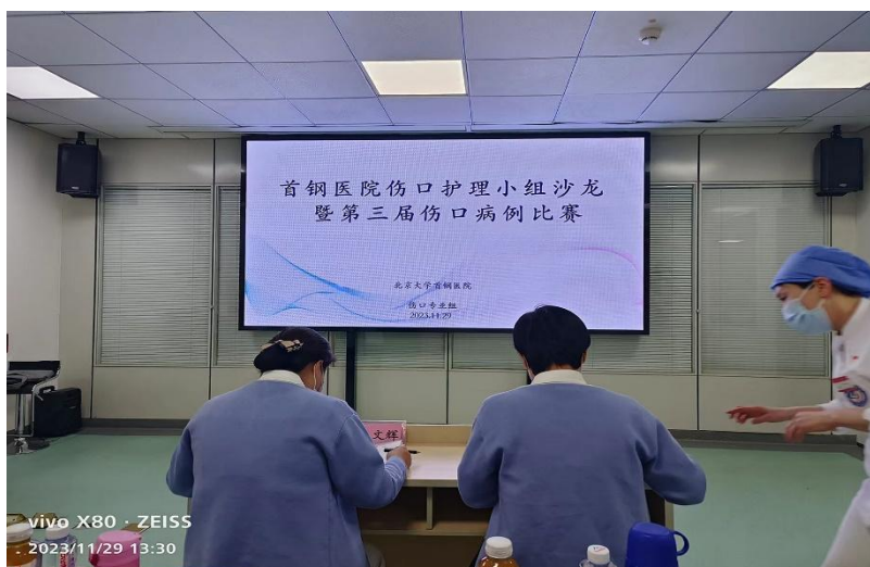
图 11 护理专业教师参加首钢医院造口沙龙比赛

首钢工学院标准化病人工作室于 2020 年创设，致力于标准化病人的培养，在护理教研室不断创新教学能力的同时，专业老师积极持续进行专业能力的自我培养，与北京大学首钢医院深度合作，从日常查房到大科室教学查房延伸到专科护士的各项护理活动中，共同探讨临床的进展和教学过程中的要点，在教学活动和临床工作中共同寻求护理技能提高和理论循证的方法，在教科研过程中校企共同进步。