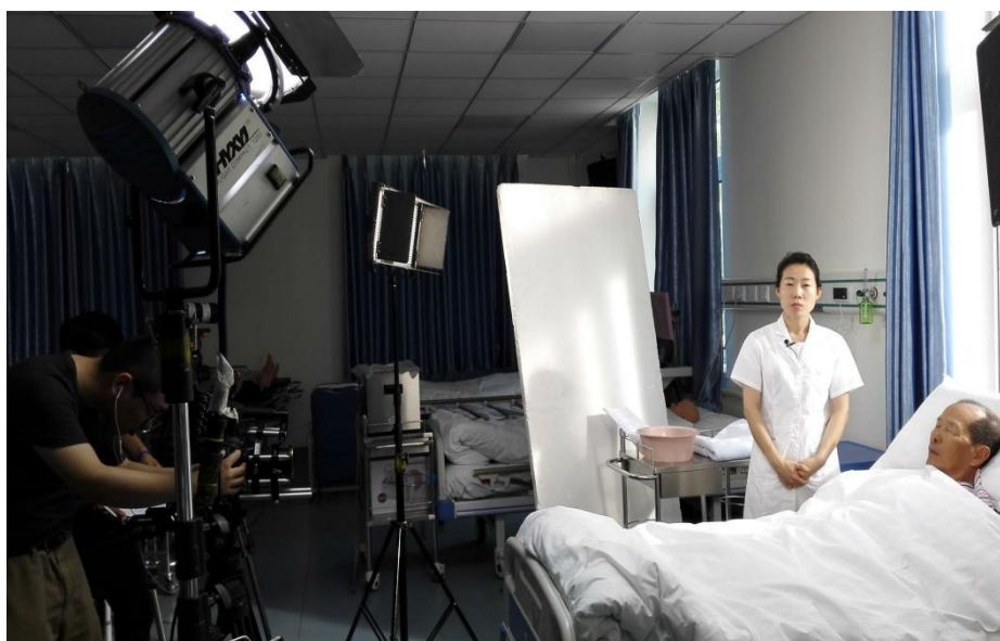
图 3 北京大学首钢医院护理专家为护理学生进行床上擦浴的技能操作录制

在教学方面，北京大学首钢医院为护理专业培养了大批的专业老师，为壮大教师队伍起到至关重要的作用。这些外聘老师不仅参与了护理理论及实践操作的教学任务，而且在专业建设、人才培养方案方面都发挥了不容忽视的作用。