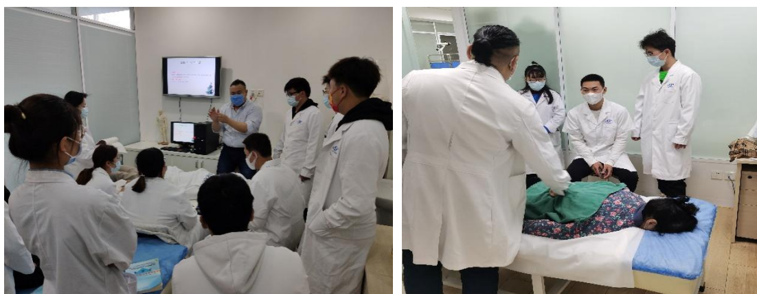
图 2 社区康复学生在北京大学首钢医院康复科学习

护理教研室根据社会需求、职业发展和岗位能力创新探索社区康复人才培养模式，以培养“诚实守信、爱岗敬业、善沟通、长康复”的高级技能型专门人才为己任，更新教学理念，打破传统实训模拟教学方式，着力推进校企的有效融合，将社区康复高职二年级学生的专业课程安排在医疗机构的康复科进行教学和实践，更加注重实践和岗位的对接，切实做到了产教融合模式下教学治疗一体化。