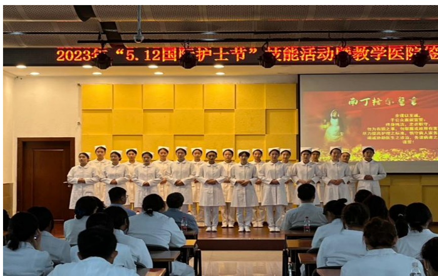
图9 北京大学首钢医院护理部主任参加5.12护士授帽仪式

授帽仪式是护生成为护士的重要时刻。伴随着“平安夜”的庄严乐曲，护理部左主任为护生戴上圣洁的燕帽，站在南丁格尔像前宣读誓言。戴上圣洁的燕帽，护理专业学生要继承和发扬护理事业的光荣传统，奉献爱心，关爱生命。