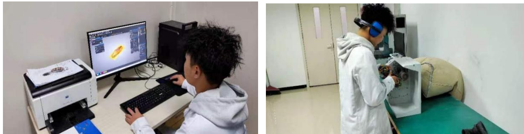
图4 学生独立完成企业订单

实施和标准评价，取得了显著的成效。学生通过参与该项目，不仅提高了自身的实践能力和专业素养，还积累了宝贵的临床生产经验。这些成果的取得为学生未来的职业发展奠定了坚实的基础，并为我们的教育教学工作提供了有益的借鉴和参考。