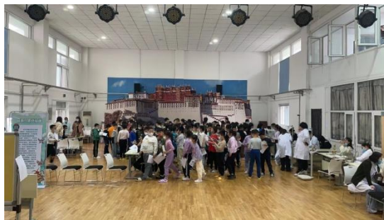
图8 开展中小学脊柱侧弯筛查

教师技术研发实践，开展“足部矫形临床实践”项目，利用学校先进设备资源、教师专业技术能力以及学生的技能锻炼需要，帮助企业实现先进技术转化为生产力，服务2700余例患者，制作交付5504件产品，在教师技术应用能力得以提升的同时促进企业效益得以提高。