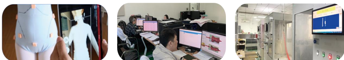
图 2 校内生产性实训基地——具有国际先进水平的设备与软件