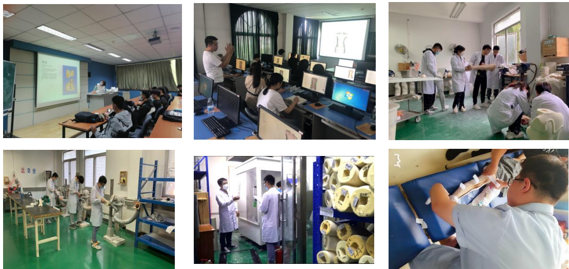
图 1 校内生产性实训基地现场教学并实训