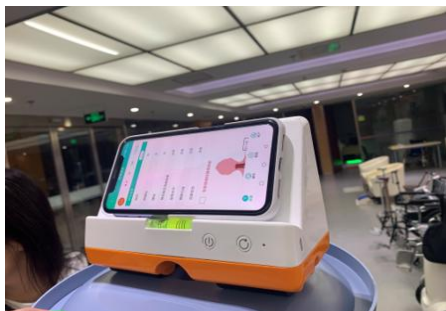
图7 研发并成功转化脊柱侧弯筛查仪

研发并成功转化脊柱侧弯筛查仪产品——用于中小学脊柱弯曲批量筛查和家庭版脊柱弯曲用户脊柱旋转角度监控追踪的智能便携式电子设备，获得各大医疗机构及教育机构认证，目前已服务中国医疗、教育机构10余家，累计筛查7000余人。研发并成功转化多项产品与技术，其中脊柱侧弯筛查仪——用于中小学脊柱弯曲批量筛查和家庭版脊柱弯曲用户脊柱旋转角度监控追踪的智能便携式电子设备，获得各大医疗机构及教育机构认证，目前已服务中国医疗、教育机构10余家，累计筛查7000余人。