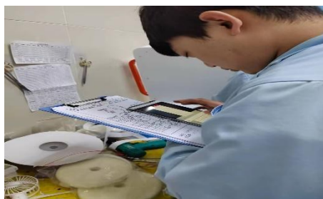
图5 学生于医院进行顶岗实习

2023 年企业共接收 5 名学生进入企业顶岗实习，学生进入公司各个岗位包含临床、生产、及行政等岗位进行顶岗实习工作。