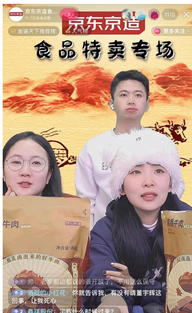
图 12：“品商班”学生直播的爆款时刻

通过承接区域实际项目，为各类企业提供了专业的服务。充分发挥了职业教育服务首都区域经济社会发展的功能，为区域经济发展注入了新活力。在这个过程中，电子商务专业不仅为各类企业提供了项目运营支持，还帮助企业优化了业务流程，提升了企业竞争力。此外，电子商务专业还通过与各类企业的合作，推动了区域产业的转型升级，并做出了积极贡献。