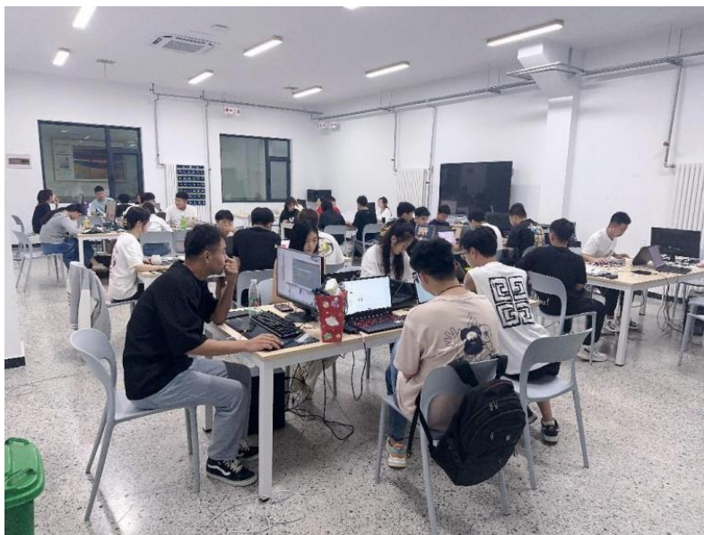
图 2:2021 级电子商务专业“品商班”开课

按照合作协议，2023年起双方共同在艺术设计学院电子商务专业建立“品商班”。合作协议规定，每年在毕业班至少开设1个“品商班”，每班学生人数不少于15人。2021年招生xx人，2022年招生xx人，2023年招生18人。9月，针对21级毕业班的第一个合作订单班顺利开班。