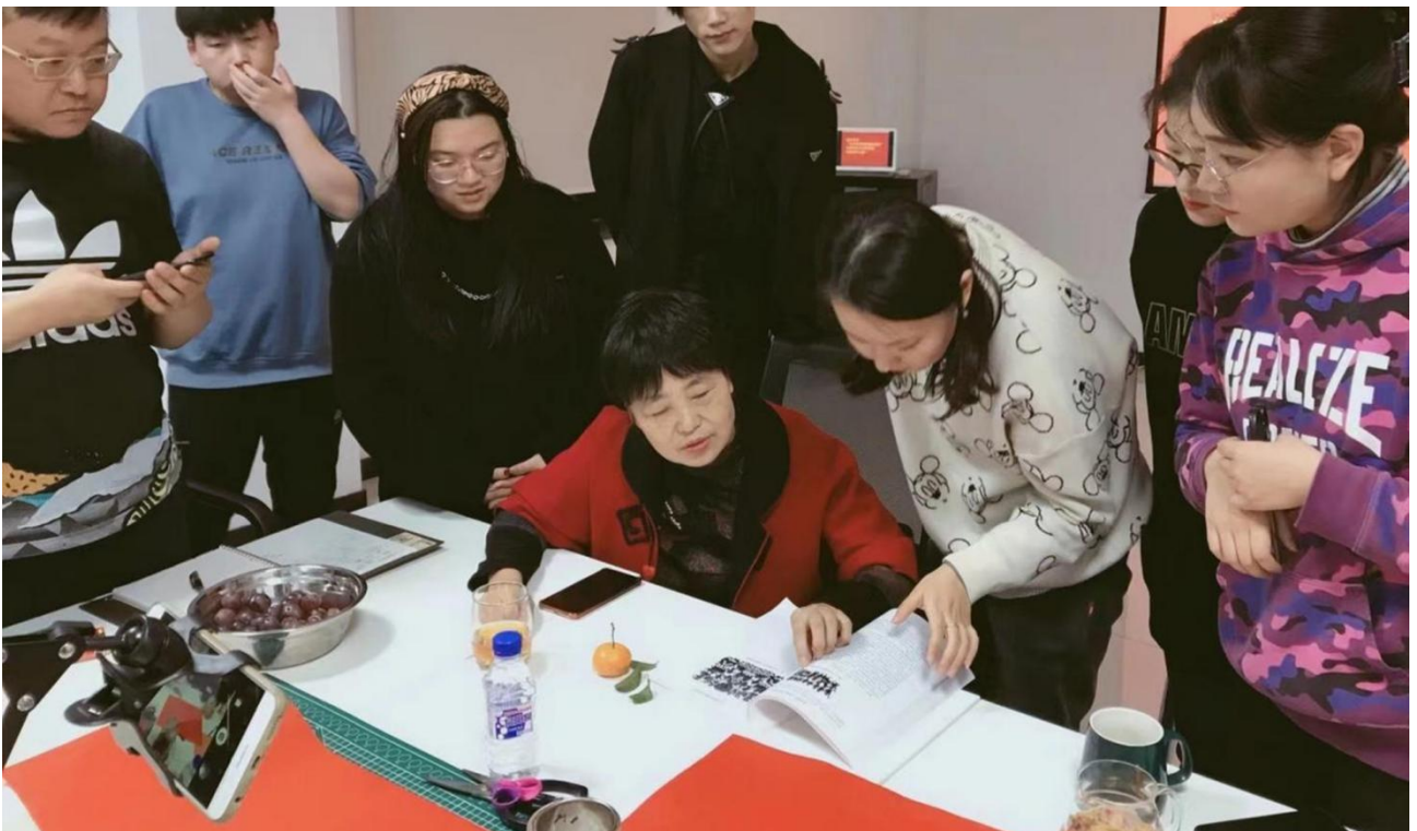
▲图 18 专家参与人才培养方案建设：艺术创作人才参与人才培养制定