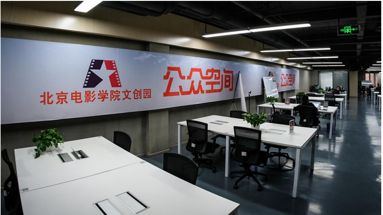
▲图2 超赛佐迪-北京电影学院文创完公众空间创作环境