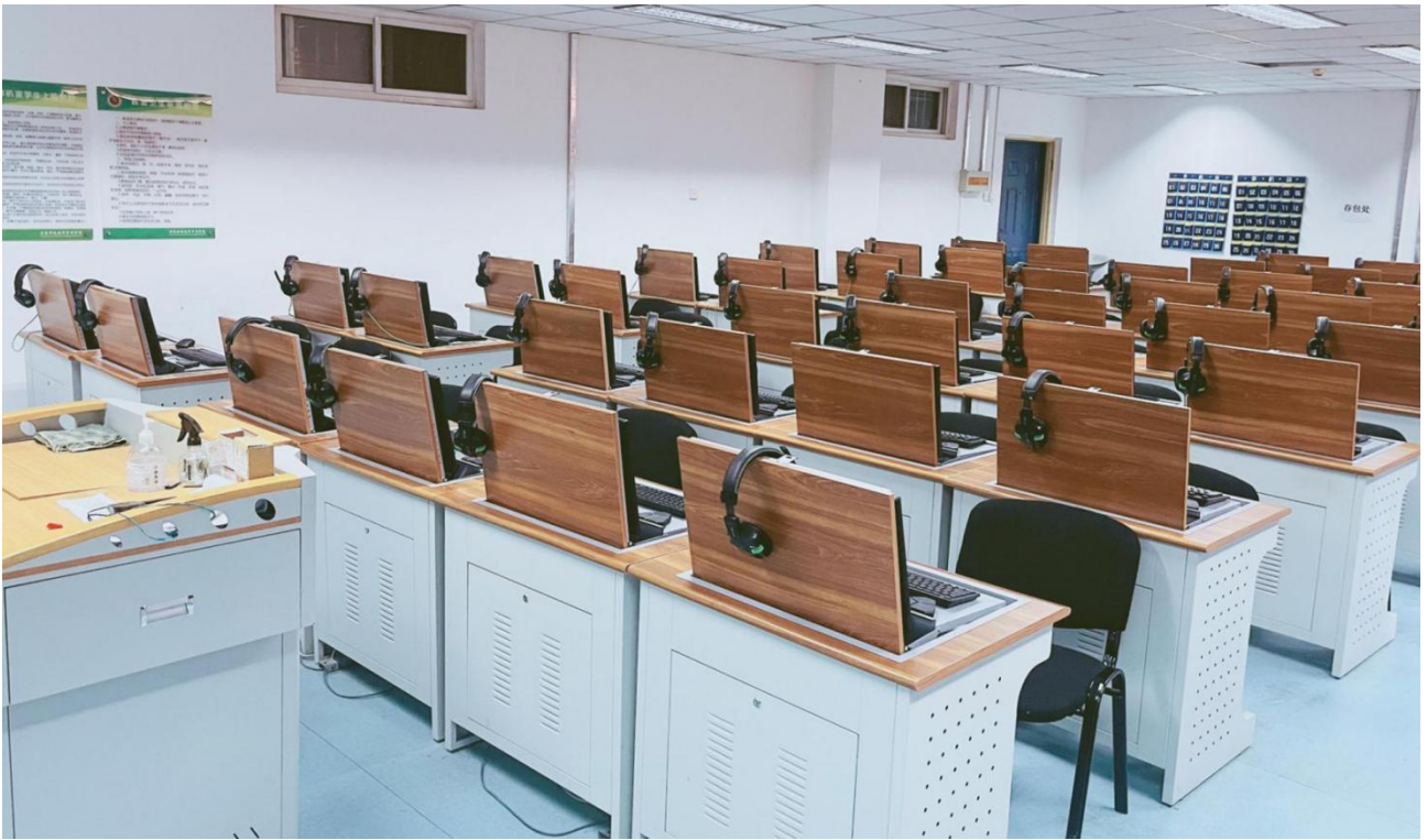
▲图 13 实训室共建：高性能剪辑机房