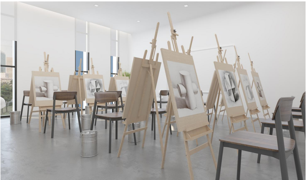
▲图 10 实训室共建：前期艺术创作工作室