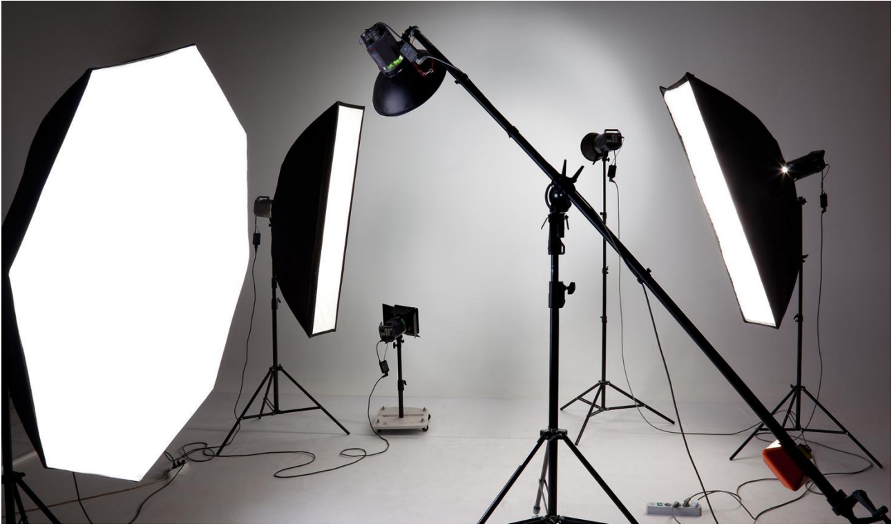
▲图 11 实训室共建：数字影像创作工作室