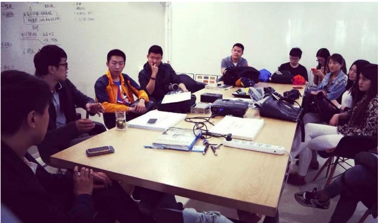
▲图 15 人才双向流通：学生进企业进行实习实训