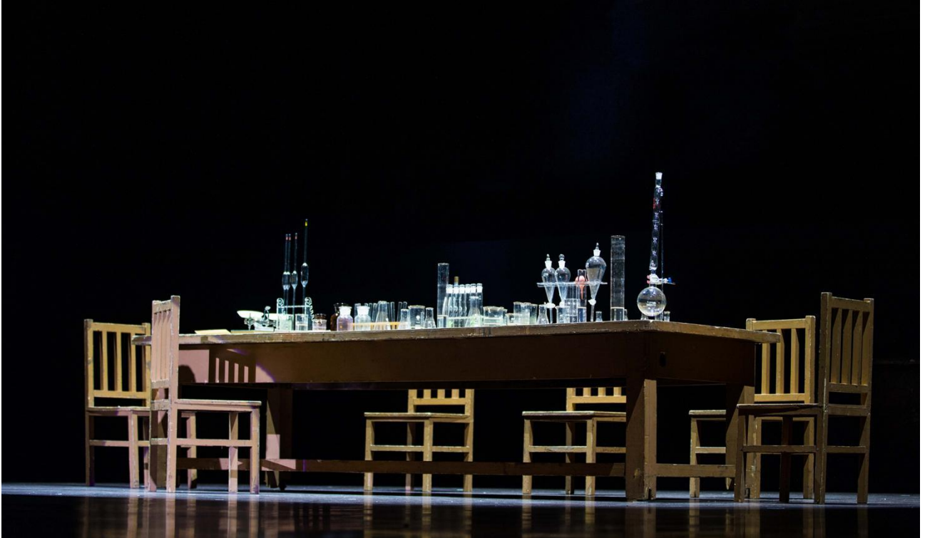
▲图 12 实训室共建：企业艺术创作实验剧场