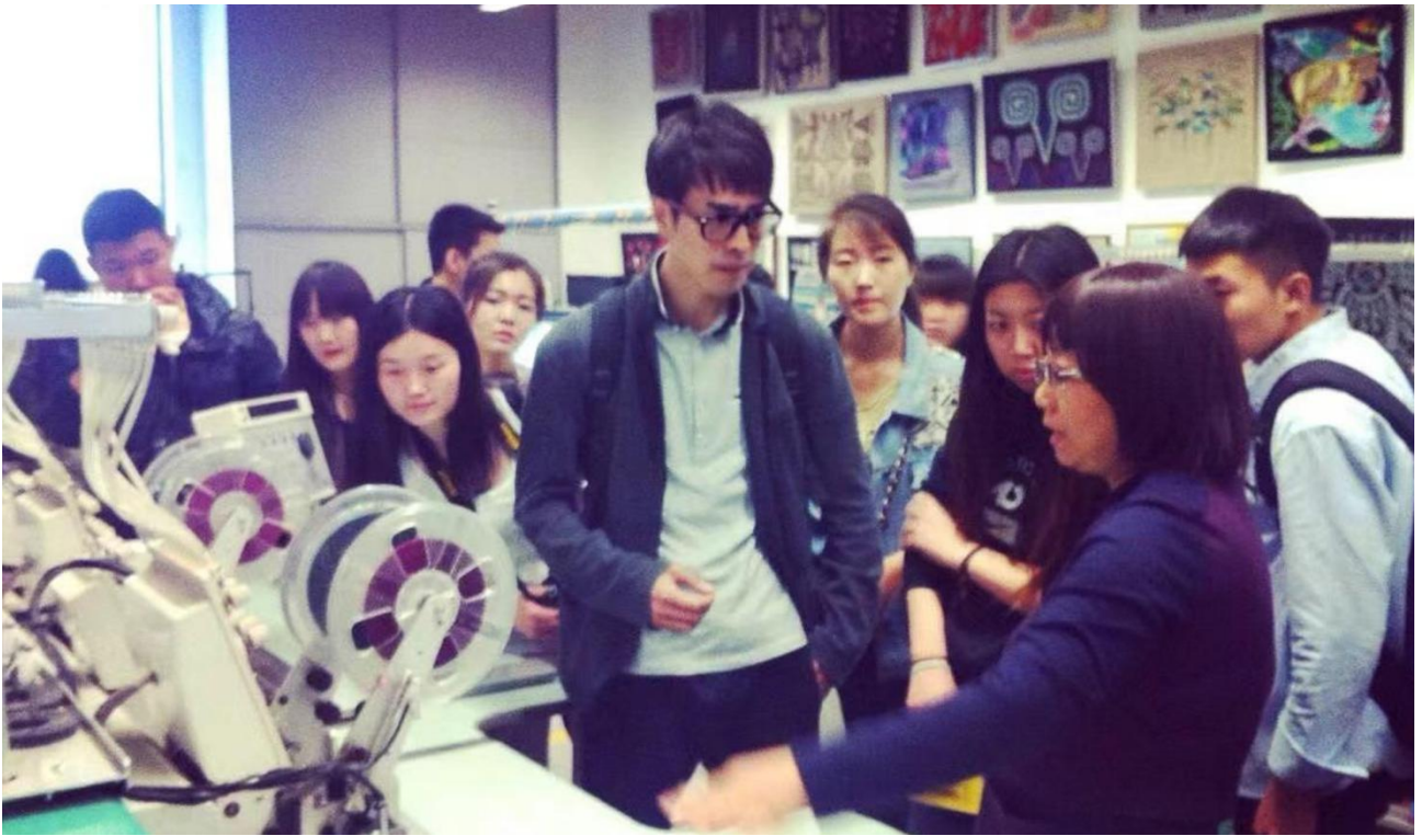
▲图 14 人才双向流通：艺术创作专家进校园讲学