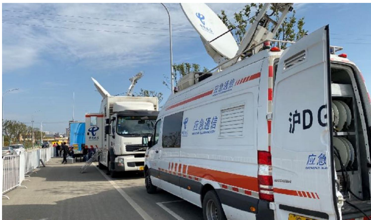
▲图9 校外实习实训：学生参与校外大型节目数字转播直播现场图