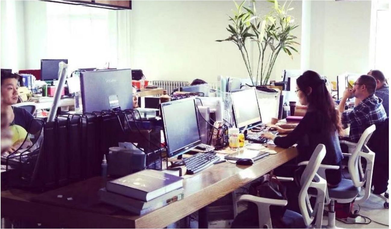
▲图 16 人才双向流通：学生进企业进行实习实训