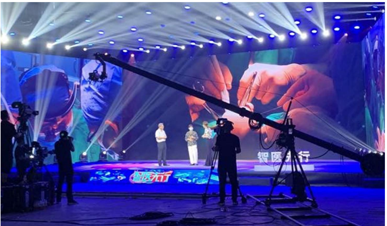
▲图 7 校外实习实训：学生参与校外《智医先行》节目拍摄现场图