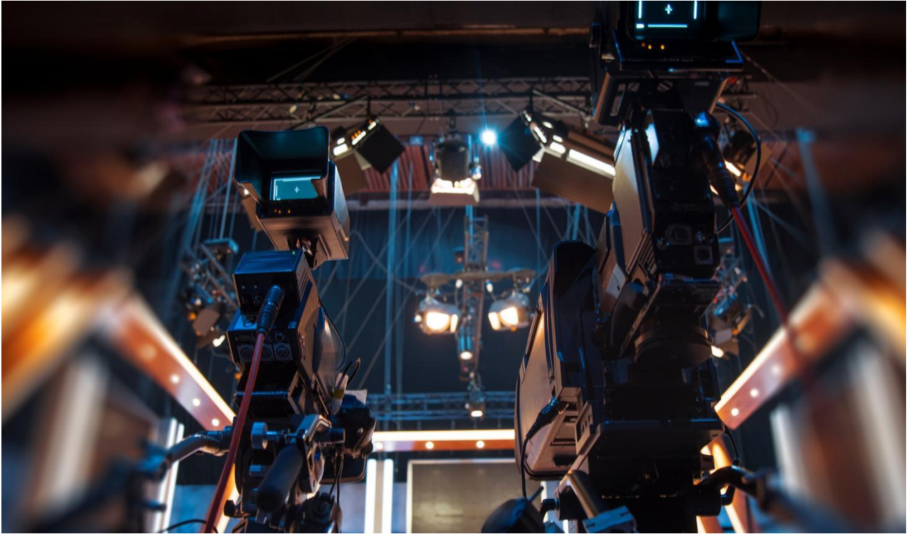
▲图 22 共享企业艺术创作空间三：数字直播大厅