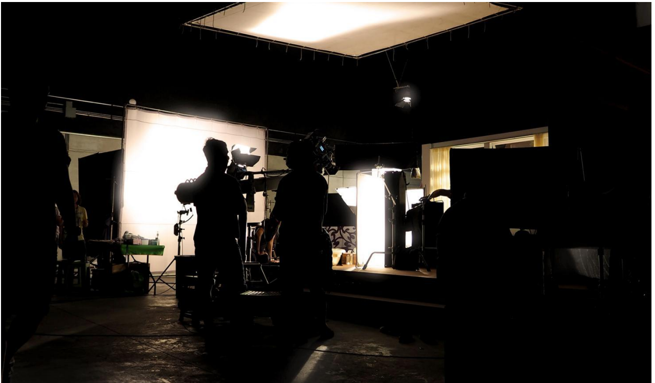
▲图 6 校内实习实训：学生参与影棚拍摄现场图