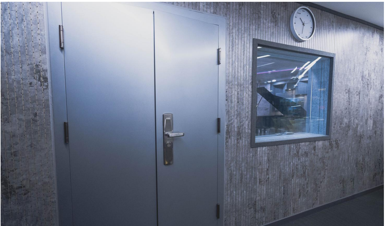
▲图 21 共享企业艺术创作空间二：专业录音棚