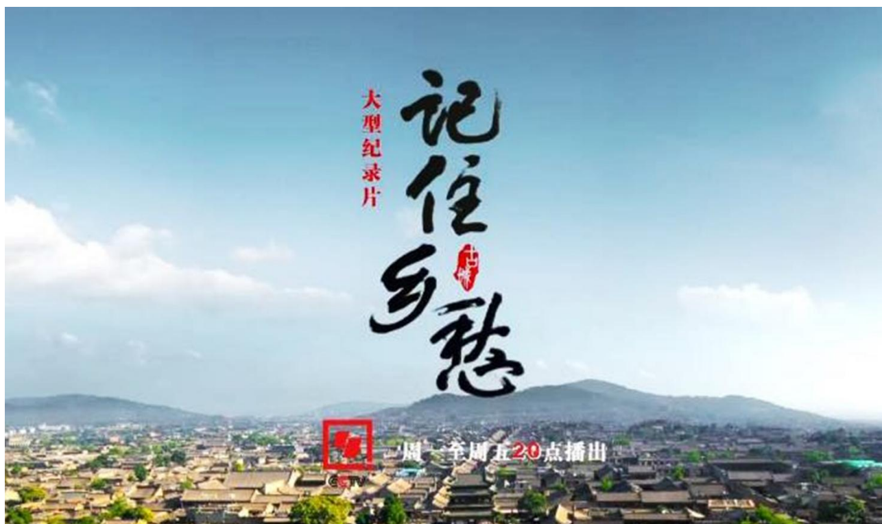
▲图8 校外实习实训：学生参与大型纪录片《记住乡愁》的拍摄