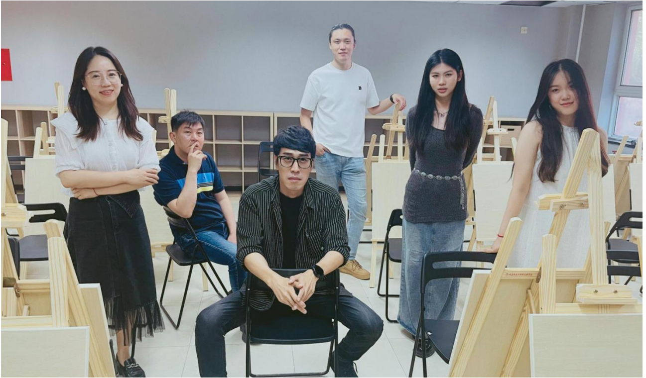
▲图 17 专家参与人才培养方案建设：艺术创作人才参与人才培养制定