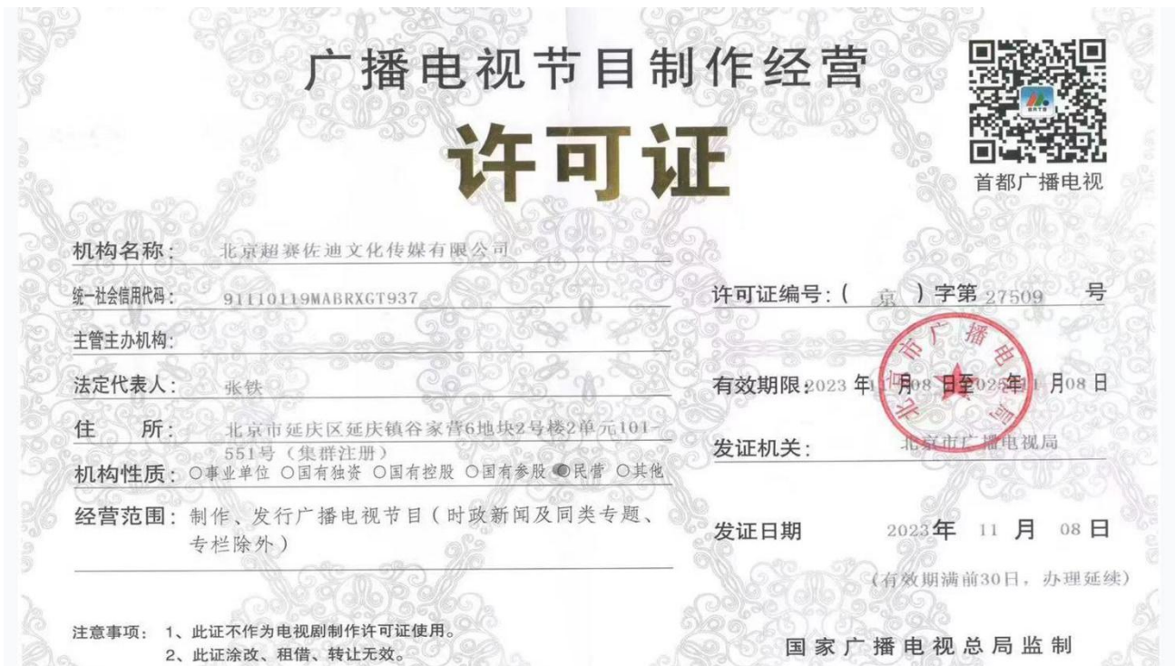
▲图 4 超赛佐迪-广播电视节目制作经营许可证