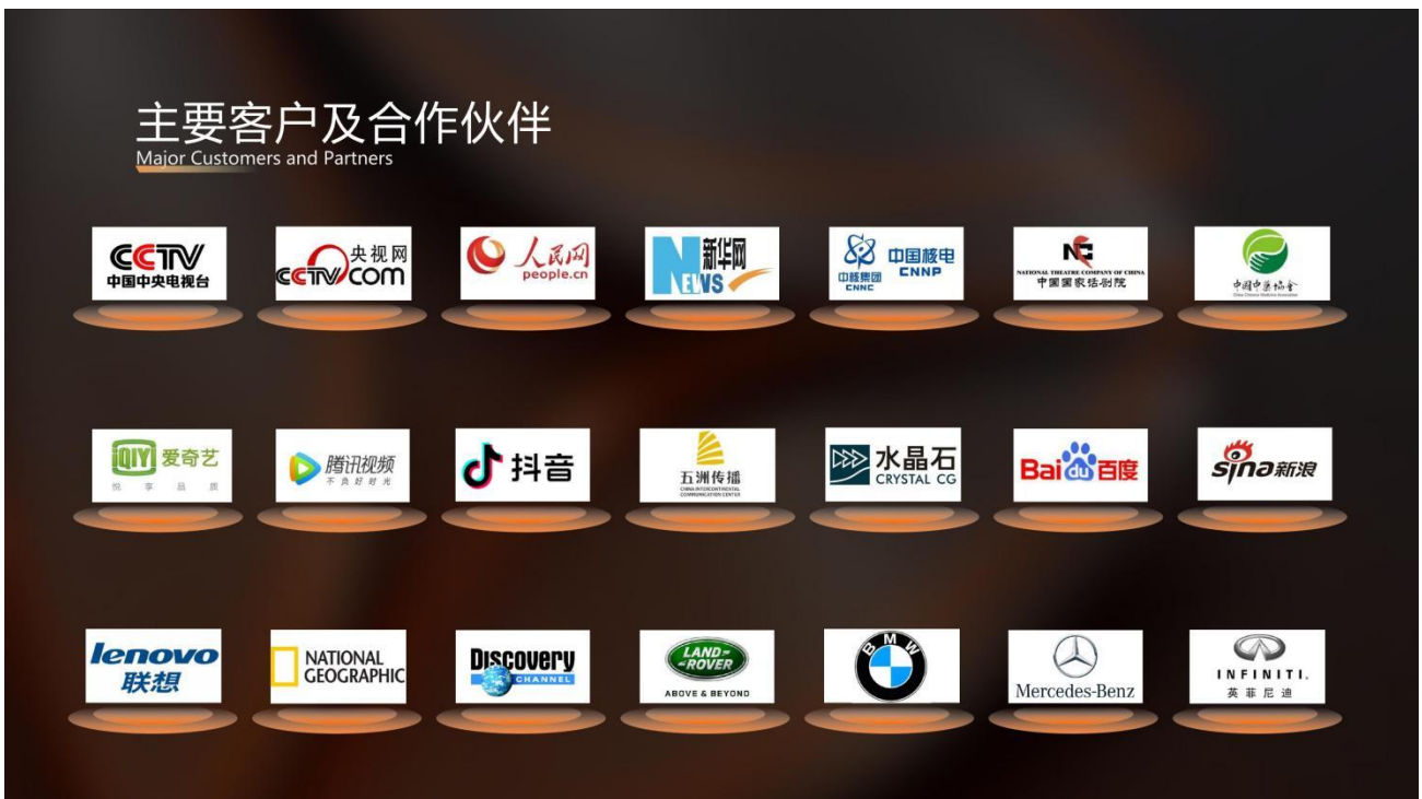
▲图 5 超赛佐迪-企业合作伙伴