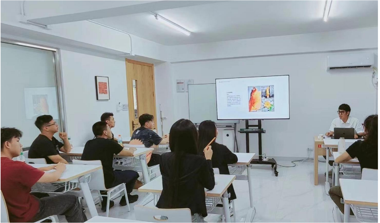
▲图 19 专家参与人才培养方案建设：艺术创作人才参与人才培养制定