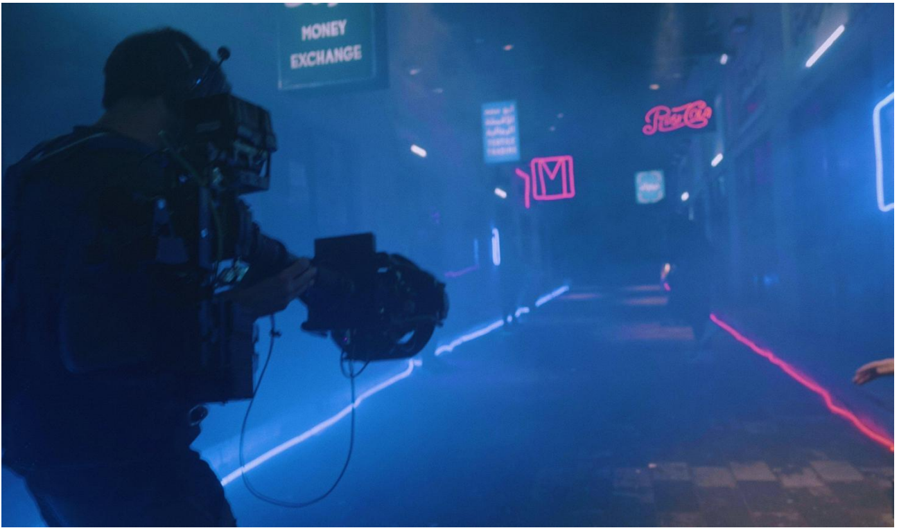
▲图 20 共享企业艺术创作空间一：影视制作基地