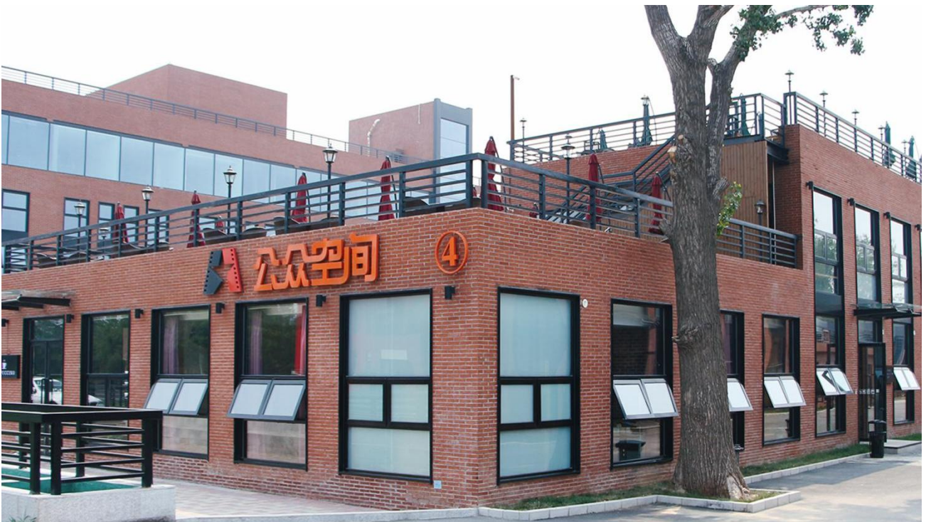
▲图3 超赛佐迪-北京电影学院文创完公众空间创作环境