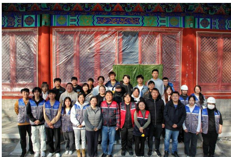
图 1 体验工学交替测绘实践的师生团队

校企双方签订专业共建的框架合作协议，京诚集团与学院签署项目委托服务合同——清化寺测绘数字转化和创新应用项目，利用测绘课程，教师带领学生，开展清化寺大雄宝殿工学交替测绘实践，见图 1。