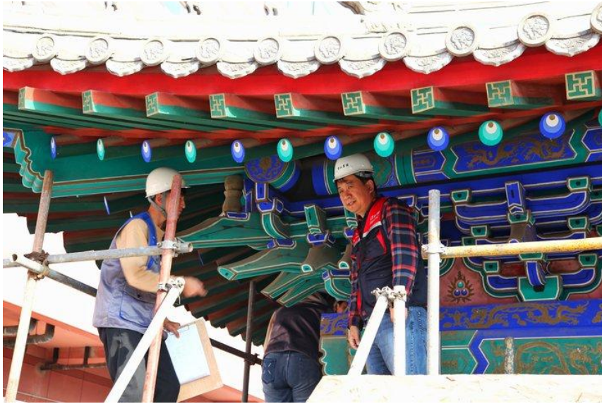
图2 专业教师为学生亲身示范