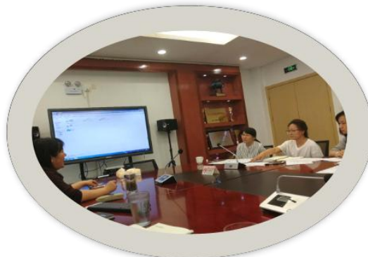
图：院、园共同研讨制定学前教育人才培养方案