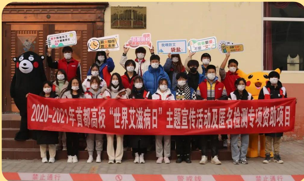
图 25：世界艾滋病日宣传活动

在即将到来的第 34 个世界艾滋病日之际，为了更好的宣传预防艾滋病知识，减少青年学生对艾滋病人的恐惧心理，提高青年对艾滋病的理解和认识，切实增强青年的防艾意识。2021 年 11 月 28 日下午，校红十字会学生分会在学校大礼堂门前举办了世界艾滋病日宣传活动。