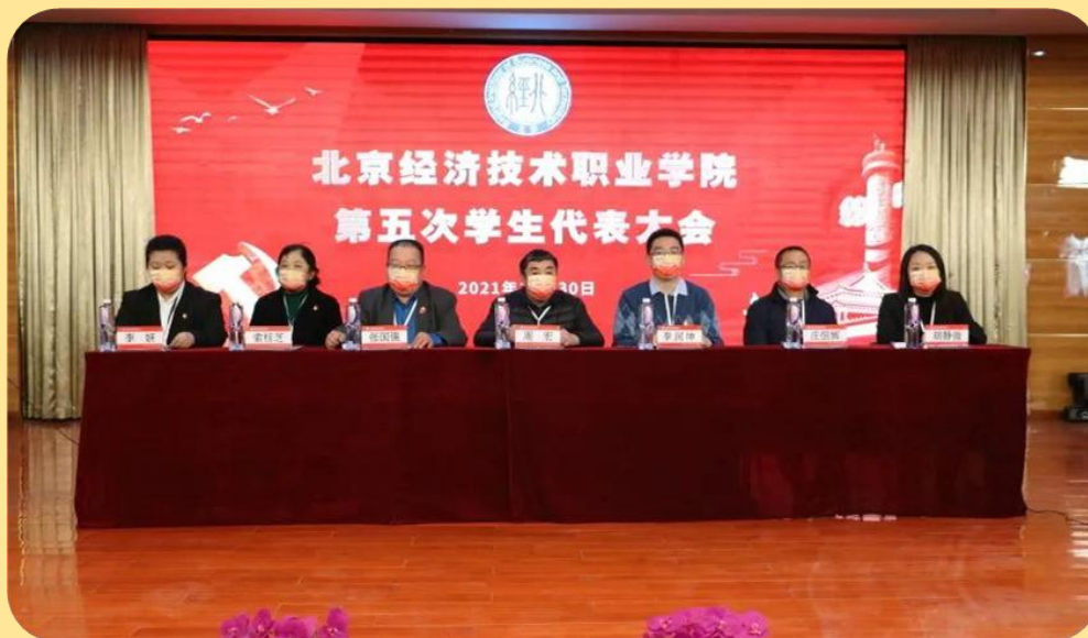
图 18：北京经济技术职业学院召开第五次学生代表大会

为认真贯彻习近平总书记重要讲话精神，特别是对青年学生工作的重要指示，深化我校学生会改革。2021 年 11 月 30 日，北京经济技术职业学院第五次学生代表大会在礼堂召开。