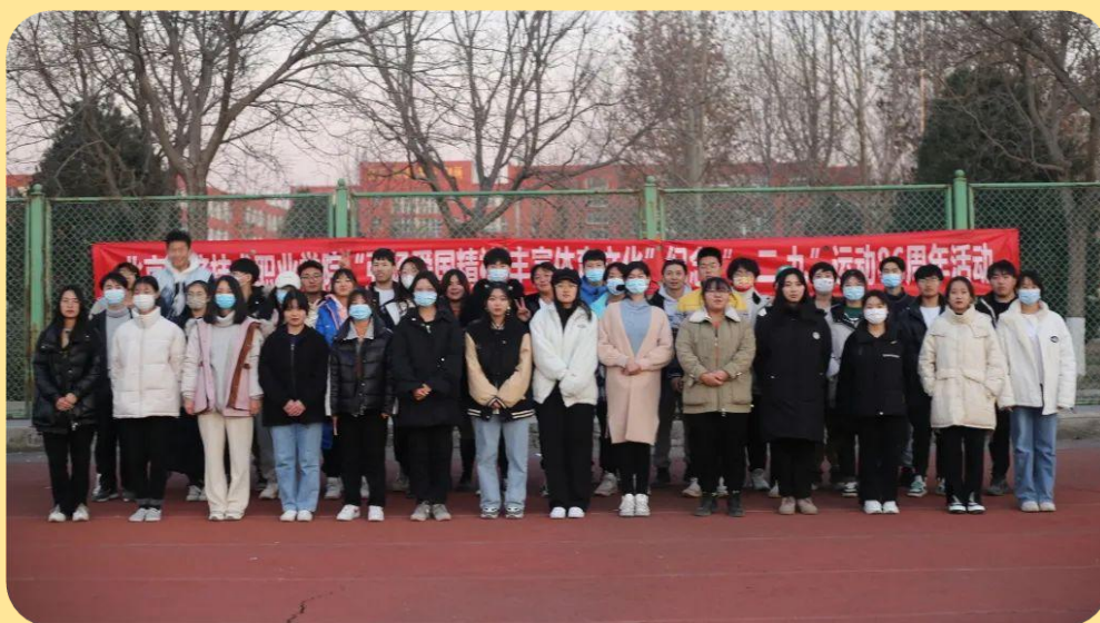
图 20：纪念“一二·九”运动 86 周年活动

为深入学习“一二·九”运动的重要思想，全面引导学生继承和发扬爱国主义精神，形成全校学生运动的新高潮，同时为了积极响应学院强化体育和课外锻炼，促进大学生身心健康、体魄强健的精神，并更好地促使大家走下网络，走出宿舍、走向操场，进行快乐体育运动，以展现大学生的激情与活力。2021 年 12 月 4 日，校学生会在运动场开展了“弘扬爱国精神 丰富体育文化”纪念“一二·九”运动 86 周年活动。