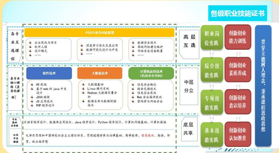
图 33: 计算机专业群课程结构图

生的公共基础课教与学的模式。发挥公共基础课的基础作用，使学生具备一定的可持续发展能力。结合各专业的不同需求，从基本素质、基本能力培养着手，全面提升学生综合素质，使学生毕业后能够很快融入实际工作中，并能够顺利完成工作任务。