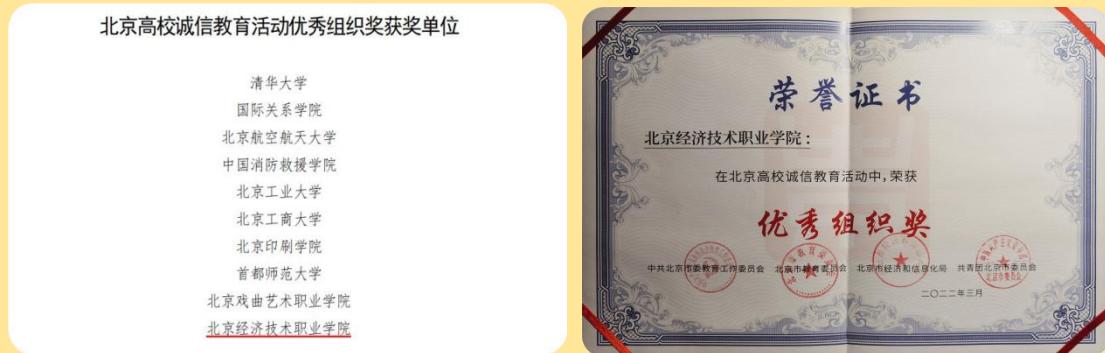
图 41-42: 北京高校诚信教育活动优秀组织单位奖获奖证书

大学生诚信演讲比赛活动的通知》要求，学校积极响应，采取多种形式广泛开展诚信宣传教育活动，周密组织诚信演讲比赛校内选拔和推选工作。最终获得由中共北京市委教育工作委员会、北京市教育委员会、北京市经济和信息化局、共青团北京市委评选出的 10 所北京高校诚信教育活动优秀组织单位奖之一和第二届首都大学生诚信演讲比赛三等奖 1 名。