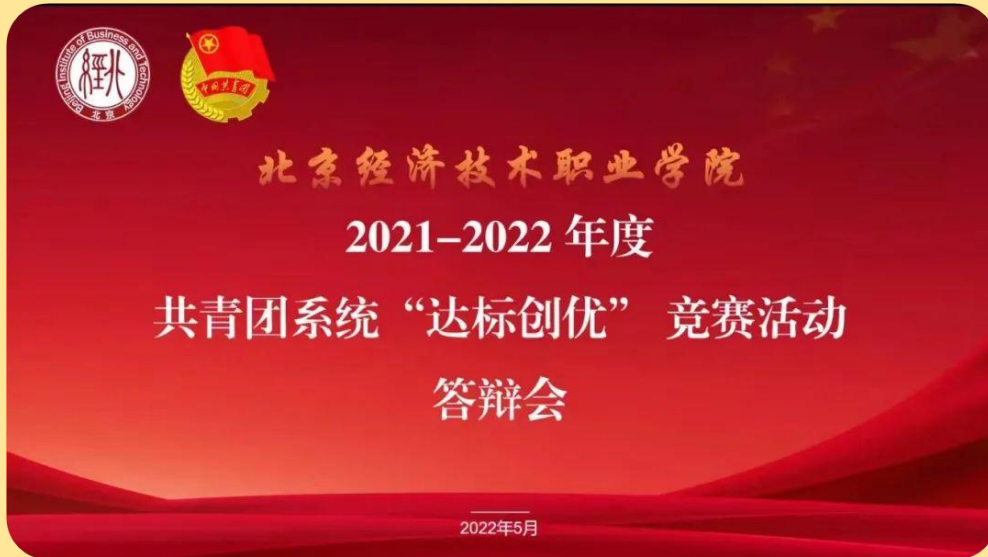
图 19：共青团“达标创优”线上答辩会

斗力、创造力，传承和发扬我校共青团组织的优良传统，在广大团员青年中树立先进典型，激励和调动全校各级团组织和广大团干部、团员青年的积极性，促进我校共青团工作再上新台阶。2022年5月26日晚7时，北京经济技术职业团委于云端开展了“青春心向党 建功新时代”2021-2022年度共青团系统“达标创优”竞赛活动。