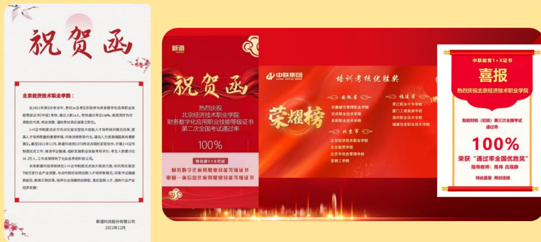
图 34-35：1+X 证书考试

我校大数据与会计专业在 1+X 证书试点工作中迈出了一大步，把 1+X 智能财税和 1+X 财经数字化证书与专业人才培养方案深度融合，建立了课证融通和模块化教学的尝试，为我校学生实训技能操作训练，提升职业技能素养树立了典范。在 2021 年 11 月 13 日智能财税职业技能初级证书考试中，2020 级 22 人全员通过考试；在 2022 年 5 月 29 日智能财税职业技能中级证书考试中，2020 级 20 人全员通过考试，中联教育集团特此发来喜报！在 2021 年 12 月 5 日财务数字化应用中级证书考试中，2020 级 26 人全员通过考试，新道科技特此发来喜报！