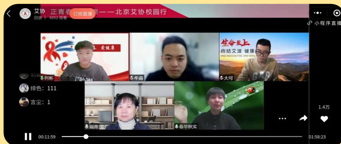
图 21：艾滋病防治知识线上科普讲座

为减少学生对艾滋病人的恐惧心理，提高大学生对艾滋病知识。2021 年 12 月 8 日晚，校团委联合北京性病艾滋病防治协会举办艾滋病防治知识线上科普讲座。