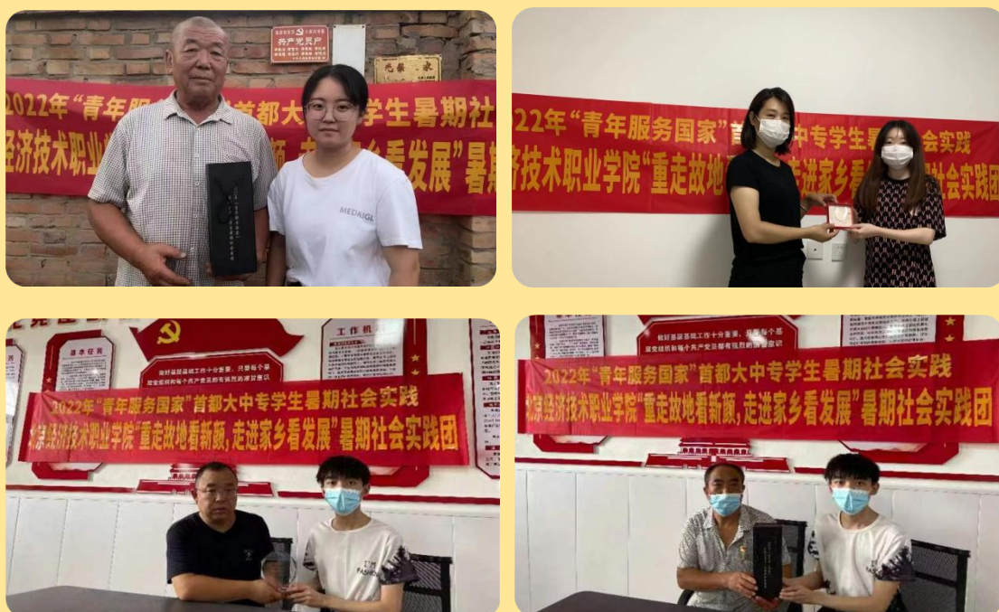
图 28-31：2022 年暑期社会调研活动

以“青年服务国家”为统领，鼓励学生积极投身社会实践活动。2022年8月9日至15日北京经济技术职业学院“重走故地看新颜，走进家乡看发展”暑期实践队，分别对河北省邯郸，廊坊，保定，北京房山，山西长治乡村地区进行线下走访及采访，实践队对村干部，党员，大学生以及人民群众进行了采访。本次采访，实践队成员们对采访地区进行了解，对被采访人员十足的尊重，采访过后对采访地区更加的了解也更加的爱上了他们的家乡，由此可见推动乡村振兴战略，助推乡村发展，是实现人民幸福的一大关键。