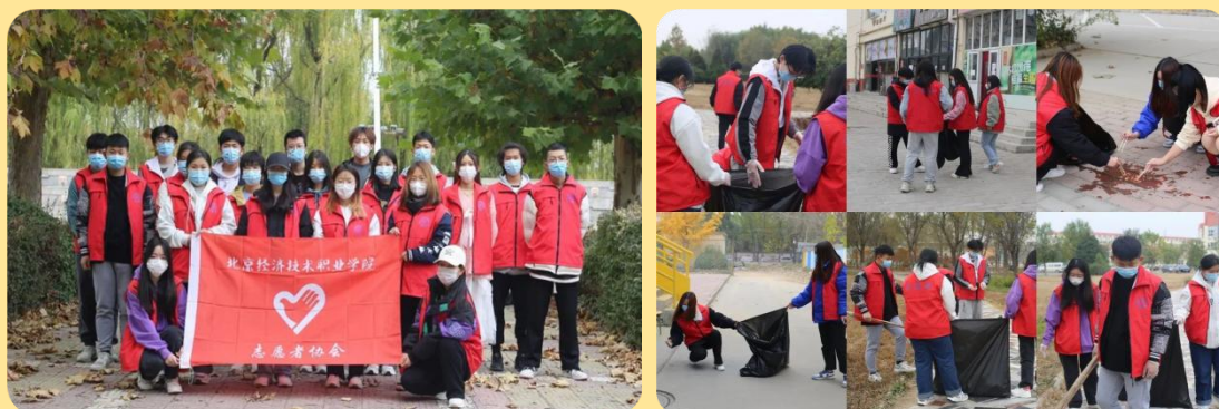
图 26-27：“美化校园，你我同行”志愿活动