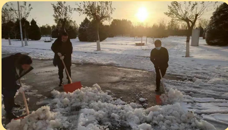
图 24：铲雪志愿服务活动