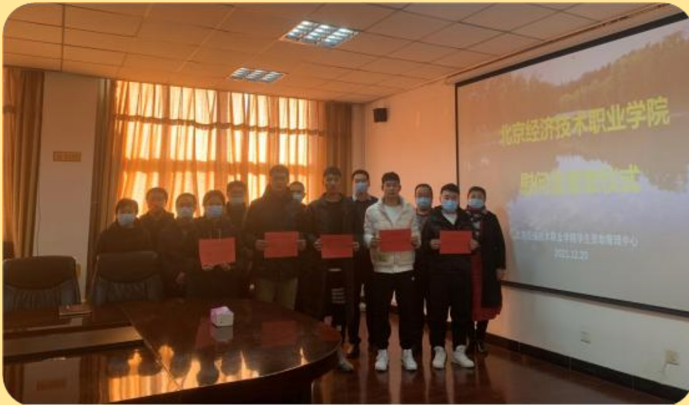
图 32：我校为朱 X 等 7 名同学发放慰问金

后会奋力前行，不断努力，做到无愧于学校、无愧于青春，成为一个有价值的人、有益于社会的人。