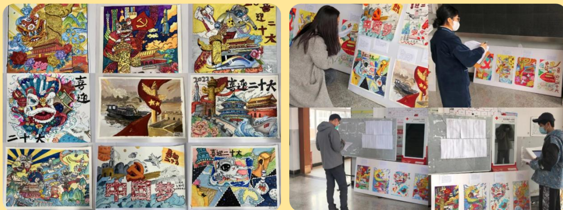
图 22-23：“喜迎二十大，激扬正青春”绘画比赛

为庆祝新中国成立 73 周年，喜迎党的二十大胜利召开，校团委举办“喜迎二十大，激扬正青春”绘画比赛，面向全校征集参赛作品。