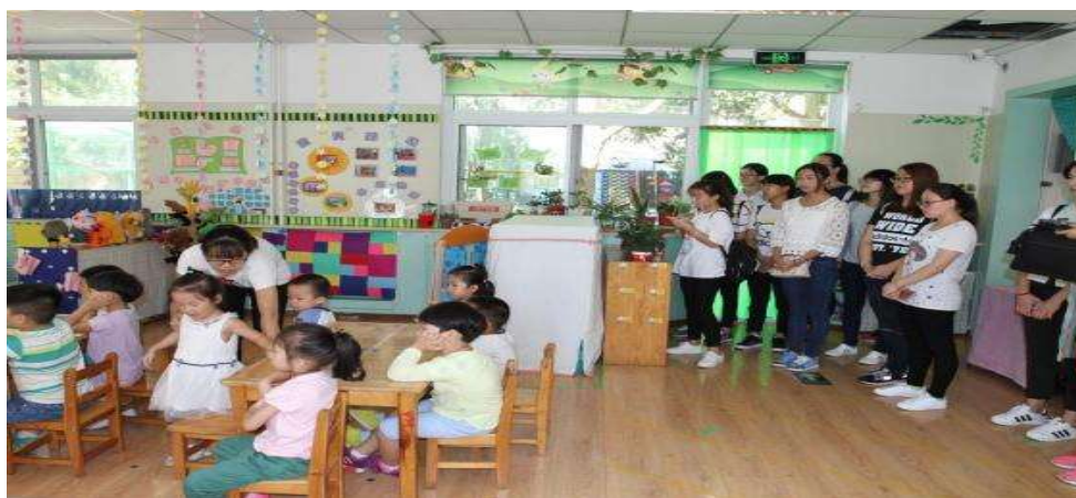
图 4 学生到怀柔第一幼儿园见习

导、高校教师、幼儿园特级教师和骨干教师、学前教育机构管理者组成专家组的学前教育专业指导委员会，定期开展研讨会、职业分析会等活动，就如何将职业需求转化为课程教学等方面提供指导，支持专业建设和人才培养。专业进一步完善“专业认知、模拟教学、专项实训、综合实训、岗位实践”五个环节紧密结合的园校合作实践教学体系，全面落实院校教师与优秀幼儿园教师共同指导教育实践的“双导师”制度。新建智慧实训室、奥尔夫音乐教室等校内实训室，与市、区多家一级一类示范园建立合作关系，成为稳固的共建共享实习实训、在职培训基地。