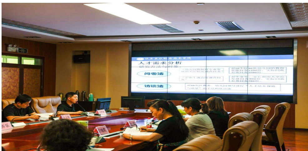
图 2 邀请怀柔区教科研中心和幼儿园园长参加人才需求分析会