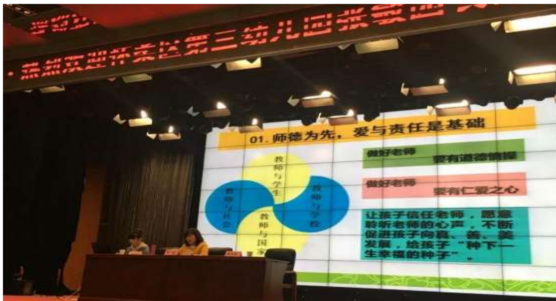
图 6 怀柔区第三幼儿园园长讲座