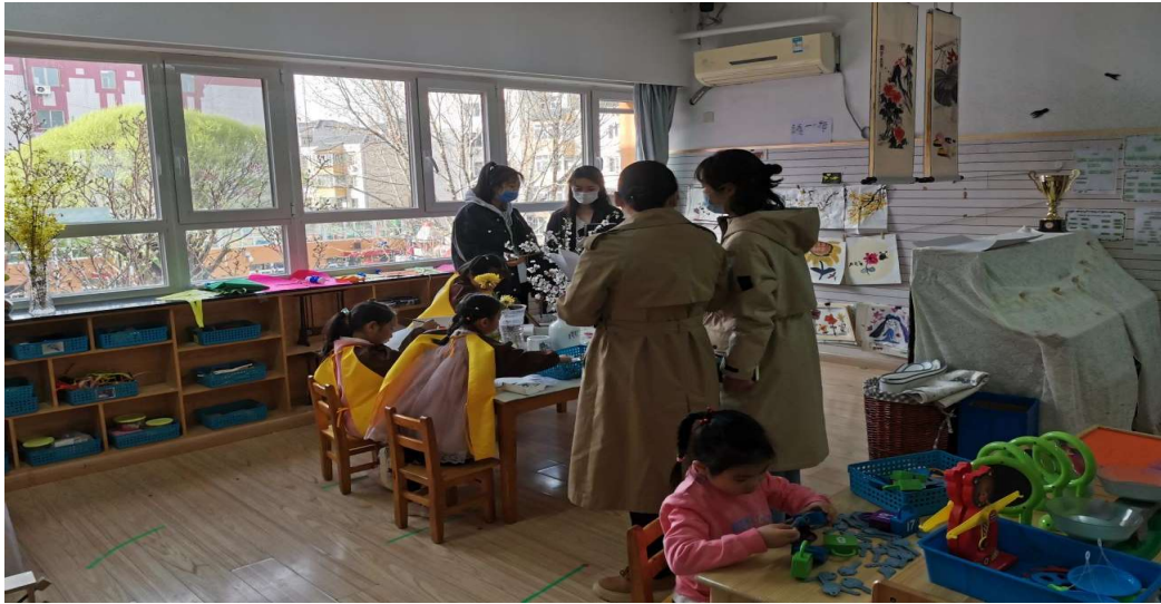
图 7 专业教师到怀柔区第一幼儿园进行参观学习