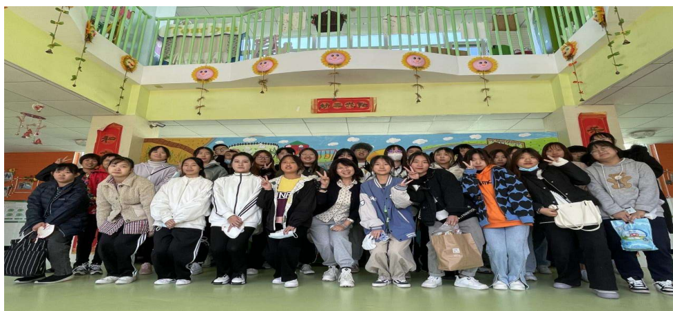
图 5 学生到怀柔第三幼儿园见习