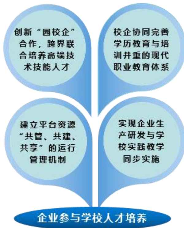
图2 企业参与学校人才培养的体制机制保障

四是实现企业生产研发与学校实践教学同步实施。 把企业生产和技术标准融入专业课程标准，实践教学内容与企业生产深度融合，毕业设计选题与企业研发项目接轨，解决传统教学内容与行业技术前沿不同步的问题，开展新型制剂研发等技术服务，有效提升工程师学院对首都生物医药产业的贡献率。