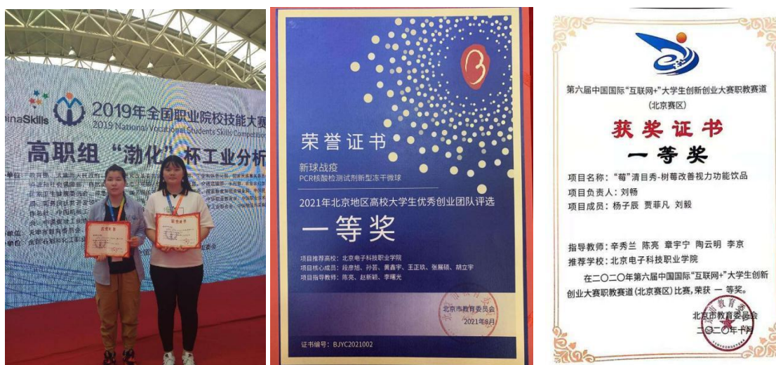
图 3 学生技能大赛和创新创业大赛获奖

合型和创新型模块化课程构成的结构化专业课程体系，校企合作开发课程标准 24 个，形成教学案例 23 个，其中 2 项在教育部“战疫课堂”课程思政典型案例征集集中获奖，9 项获评校级课程思政“三金案例”；和生物医药园合作开展两期现代学徒制创新型人才培养，引进企业导师 23 名，参与学生 76 人；完成《药学基础》等 6 门“职业技术技能课程”的校教学资源建设，累计 0.3T，开发慕课《动物细胞培养》和《破译基因密码》并在中国大学慕课网上向本校学生及社会开放；主编新型活页式、工作手册式教材 12 本；其中《细胞培养技术》获首届全国教材建设二等奖；近两年学生在市级以上技能大赛和创新创业大赛累计获奖 25 项。