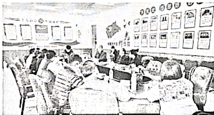
2022年11月9日专家听课暨教学反馈研讨会

为了提高有效教学水平，推动高效课堂建设，要求全校教师要重视“十二种技能”的培养和提升：教学设计的技能、课程导入与结课的技能、课堂提问的技能、课堂讲授的技能、课堂语言技能、课堂调控技能、现代教育技术运用技能、学习指导技能、课堂拓展技能、课堂教学评价技能、说课技能、微课技能等等。通过对以上技能的掌握，来提高教师教学质量，增强教学效果，提高教学能力，营建高效课堂授课氛围，促进教学任务高质量的完成。通过学习“有效教学，高效课堂”的相关理论，为推进有效教学提供理论支持，夯实思想基础。教师要从优化备课做起，落实“六带”、“把功夫下在课前，把精彩留在课堂”，推进学校课堂有效教学水平的提升。打造以实践教学为主线，互动、开放、高效的课堂。