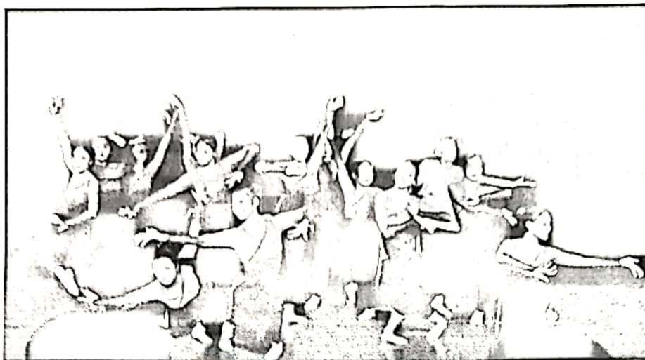
古典舞技术技巧展示《凤凰涅槃》

北艺传媒重点开展了深入学习宪法和习近平总书记重要论述的活动。将思想政治教育工作“软指标”变为“硬约束”，将思想政治工作和党的建设工作有效结合。学校调动师生、凝聚合力，围绕新时代对人才的要求，新思路新探索全面发力，着力做好思政育人这篇大文章。思政课走进课堂，系统梳理讲解了宪法的发展和修改的全过程。通过学生利用辅助读物自学、专业教师讲解、校园广播轮播、教学区宣传栏海报展示、知识竞赛等多种形式，探索配合活动进行学习成效推进。学校始终坚持把立德树人作为根本任务，一直秉持“为了学生一切，一切为了学生”的“两个一切”理念，以美育人、以文化人，教育引导学生在培育和践行社会主义核心价值观，培养德智体美劳全面发展的社会主义建设者和接班人。