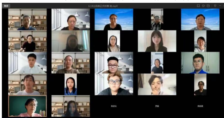
图表 2-5: 2022 第四届“火花杯”大学生创新创业大赛网络赛场