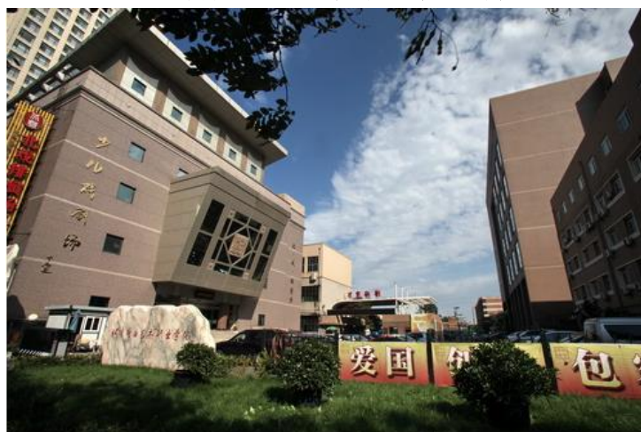
图表 1-0-1：北京戏曲艺术职业学院

北京戏曲艺术职业学院（简称“北戏”）是经北京市人民政府批准、教育部备案的全日制普通高等学校，是北京市唯一一所公办艺术类高等职业院校。学院由梅兰芳先生等京剧前辈创建于1952年。2002年12月，学院正式举办全日制高等职业教育，2006年北京市艺术研究所并入学院，充实了教学、科研力量。学院面向全国招生，开设京剧、地方戏曲、音乐、舞蹈、艺术设计、影视表演和曲艺7个专业25个专业方向，从单一的戏曲学校发展成为综合艺术院校，培养了孙毓敏、李玉芙、赵葆秀、谷文月等众多表演艺术家和知名演员，在全国的戏曲教育领域有着广泛的影响。目前，全日制普通在校生1361人，在编教职工360人，专任教师215人，高级职称67人。学院多名教师获得北京市名师、北京市优秀教师、北京市中青年骨干教师等荣誉，师资力量雄厚。2011年，学院被北京市教育委员会评为“北京市示范性高等职业院校”，2017年，被中央精神文明建设指导委员会评为“全国未成年人思想道德建设工作先进单位”，2019年成为北京市特色高水平职业院校建设单位，2022年戏曲表演专业群入选北京市职业院校特色高水平骨干专业（群）建设名单，成为北京市唯一的一所文化艺术类“双高校”。薪火相传，弦歌不辍，北戏七十年的奋斗拼搏，为中华优秀传统文化的传承和发展做出了突出贡献。