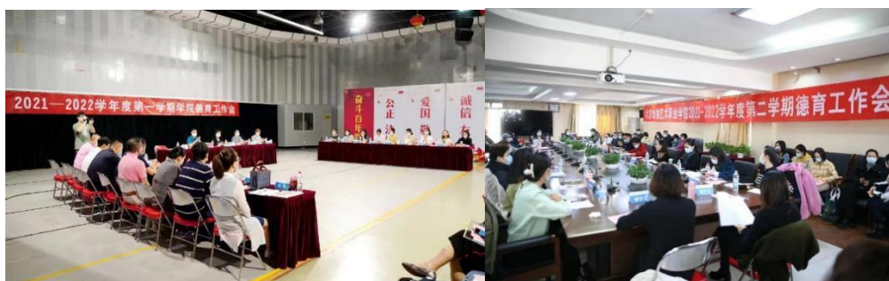
图表 3-1：北京戏曲艺术职业学院德育工作会

北京戏曲艺术职业学院一直以来，坚持以习近平新时代中国特色社会主义思想为指导，以习近平总书记关于师德师风的重要论述为根本遵循，全面落实市委市政府关于师德师风建设的总体部署，强化以党史学习教育为重点的“四史”学习教育，引导教师坚定理想信念、厚植爱国情怀、涵养高尚师德，牢记为党育人、为国育才的初心使命。提高政治站位，加强顶层设计，高度重视组织，统筹推进落实，为此，北京戏曲艺术职业学院，在新学期的开始，召开了2021-2022学年度第一期德育工作会议。会议要求全体教师认清德育工作的形势，以身作则、为人师表，引导学生树立正确的“三观”；在工作中要注重学生心理健康，多研究教育方法方式。在教学管理方面，要课程建设为抓手，将德育工作进一步融入到课程建设环节中，推进学院德育工作新常态。