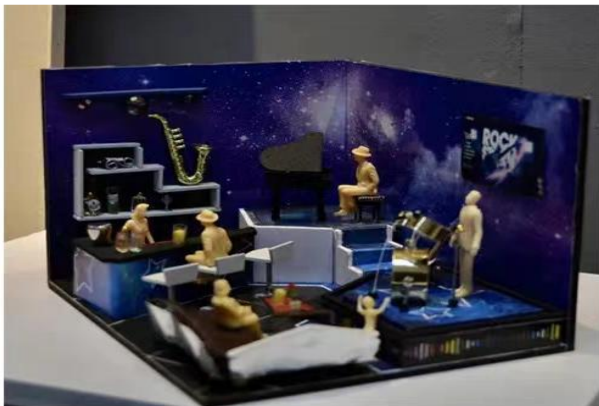
设计专业作品《空间设计模型》