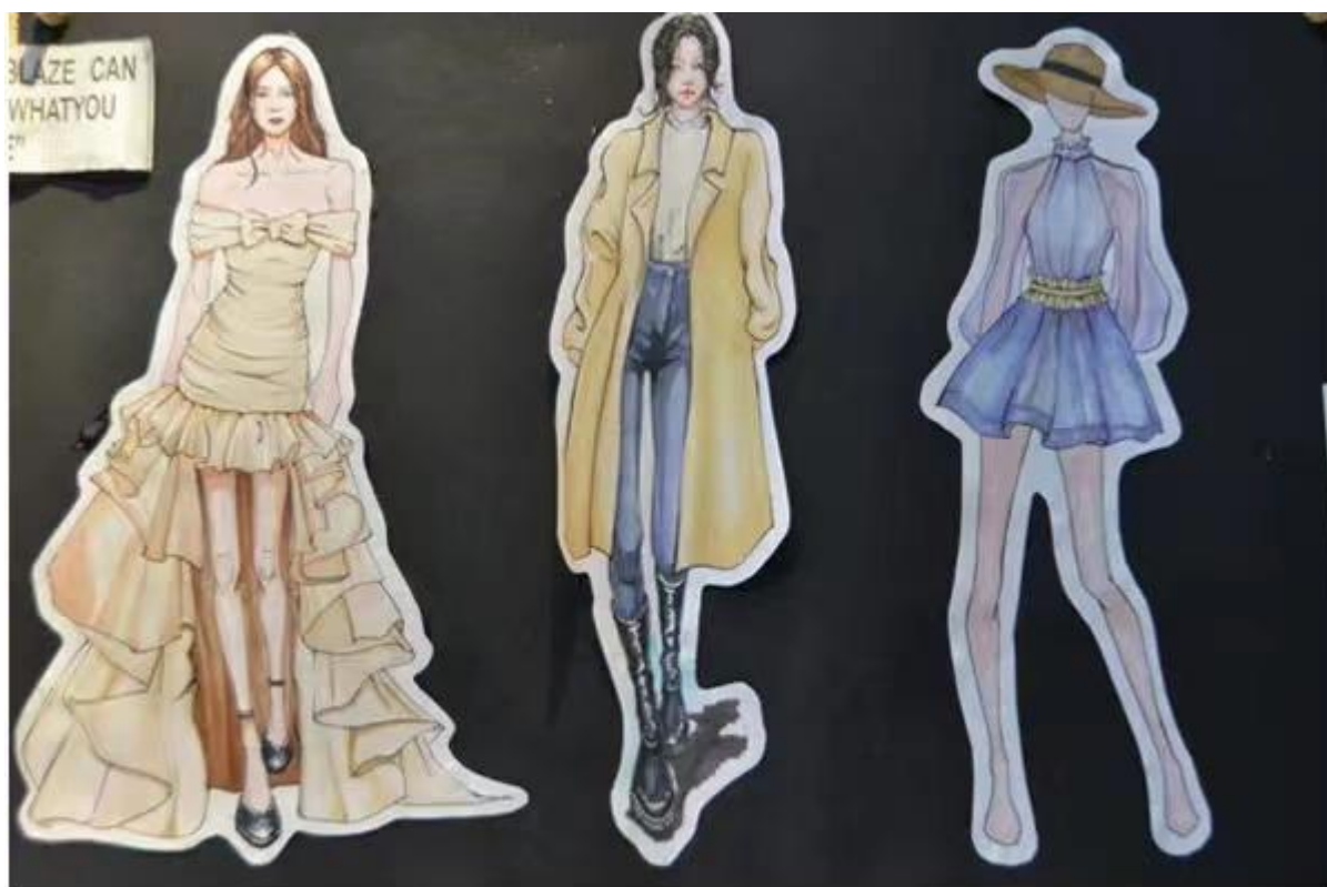
服装设计作品《都市系列》