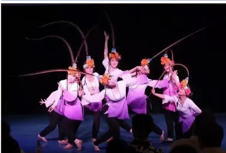
我院舞蹈表演专业学生汇报演出

要明确“有效教学”和“高效课堂”的内涵。“有效教学”作为一种教学理念，重点所关注的并非是教师在特定时间里教学任务完成得如何，而是学生在特定的时间里学到了什么。高效课堂，是高效型授课或高效性课堂的简称，是指教育教学效率或效果能够有相当高的目标达成的课堂，具体而言是指在既有课堂教学的基础上、完成教学任务和达成教学目标的效率高于课堂教学的平均水平，其教学效果较好并且取得教育教学的较高影响力和社会效益的课堂。营建高效课堂需要教师具备高效教学能力，“高效教学”作为一个实践概念，是对“有效教学”理念在教学实践操作层面的体现。其要义是指教学要有明确的目标指向，倡导教师要充分利用好上课的有效时间，通过各种有效的现代教学艺术、策略，恰当的教学方式、方法以及适当的教学（学习）活动，高质量地完成教学任务，使学生做到当堂学、当堂练、当堂会。