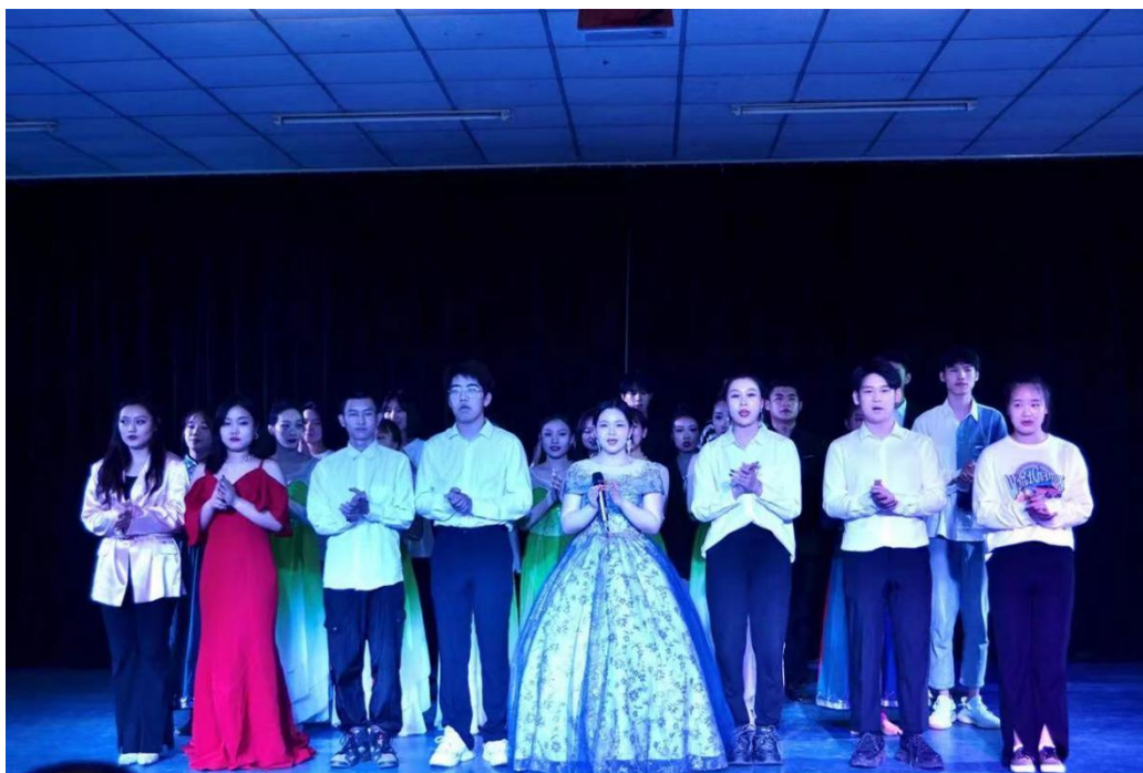
音乐专业同学合唱《祖国不会忘记你》

为多维度掌握全体任课教师教学现状，提高课堂教学针对性、有效性，每学期均对全体任课教师进行满意度测评，测评主要有教学态度、教学内容、教学方法、教学组织、教学效果等5类10个指标，既有定量指标又有定性分析，全部采取无记名投票的方式组织。通过汇总梳理测评结果，89.9%的老师测评结果为优秀，10.1%的老师测评结果为良好，从一个侧面反映出学校任课教师功底深厚，认真负责，深受学生喜爱欢迎，充分展示了学校开展“做新时代‘四有’好老师和‘四个引路人’学习实践活动”的成果。对学生反映出的个别老师授课方法不够灵活，课堂氛围不够活跃的问题，教务处及时反馈给任课教师，帮助其举一反三、认真整改，不断提高个人授课水平，全面提升学校教学质量。