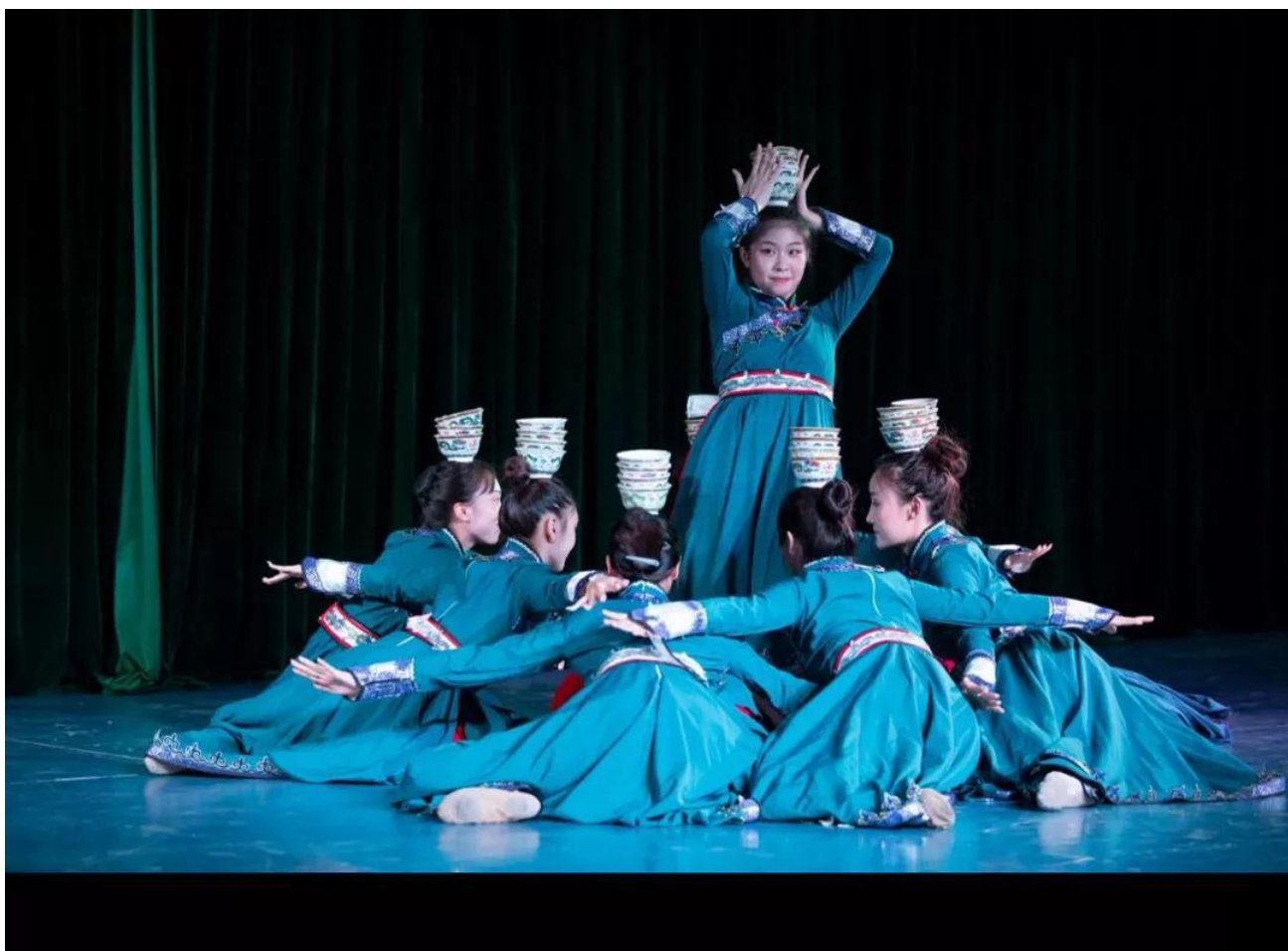
表演专业的同学们在表演节目《蒙古丽人》