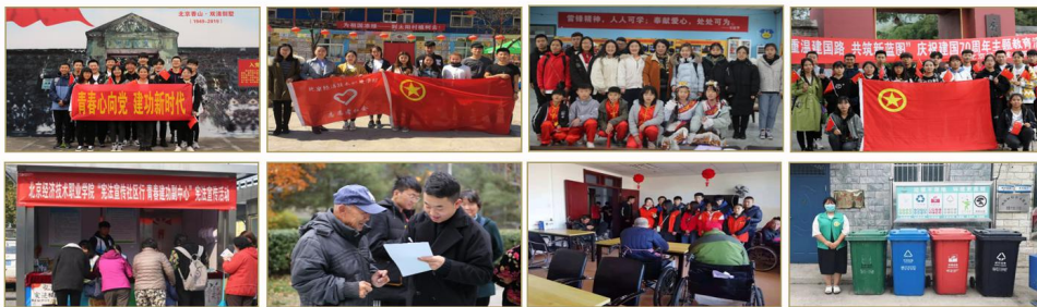
深入企业、社区、农村、社会机构，了解民生、调查社情、感受国情 培养立足基层、扎根群众、勇于担当的素质，锻炼服务人民、奉献国家的本领。

学校利用学生课余时间，组织学生开展丰富多彩的社会实践活动，例如青春心向党建功新时代主题活动、使命在肩奋斗有我主题活动、青年大学习活动、红烛行动、支教活动等，鼓励和引导学生积极参与社会实践，深入企业、社区、农村、社会机构，了解民生、调查社情、感受国情，培养立足基层、扎根群众、勇于担当的素质，锻炼服务人民、奉献国家的本领。