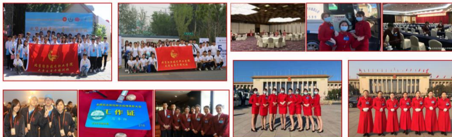
学校志愿服务以“热爱祖国、奉献社会、锤炼人生”为宗旨， 将志愿服务融入育人过程，培养了一批又一批有理想、有本领、有担当的志愿者团队

学校志愿服务以“热爱祖国、奉献社会、锤炼人生”为宗旨，将志愿服务融入育人过程，培养了一批又一批有理想、有本领、有担当的志愿者团队。在全国两会、国庆、世园会、全国抗击疫情表彰大会、全国劳模大会等国家重要活动中，在全国上下众志成城疫开展的情防控工作中，我校学生以高度的责任感参与了志愿服务工作，展现了昂扬向上、奋发有为的精神风貌，赢得了有关单位的充分肯定。