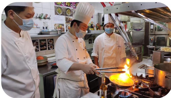
图2 企业师傅为学生进行餐饮培训