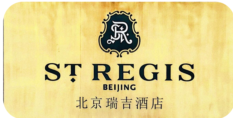
图 1 北京瑞吉酒店图标

北京瑞吉酒店隶属万豪集团旗下奢华品牌，是“瑞吉”在亚太区的第一家酒店，也是各国总统和政要访问北京时的指定下榻酒店。酒店位于北京 CBD 核心区，紧邻长安街和绿树环绕的第一使馆区。拥有各类豪华客房，配有标志性睡床、宽敞的大理石浴室、迷人的花园和城市景观，布置优雅、极具特色。酒店设有各种风味餐厅，还拥有完备的休闲健身中心及天然温泉理疗中心。饭店的会议设施齐全先进，可举办规模不等的会议、宴会和各种活动。