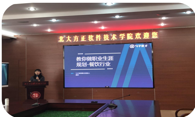
图3 勺子科技有限公司进校为学生做职业生涯规划培训

瑞吉酒店和勺子科技利用自身餐饮行业的运营管理的优势，为学生们设计了详细的晋升路径，使学生们了解到更多餐饮业的现状与发展前景。由于餐饮行业的数字化升级，也对人才需求的标准不断的升级，所以自身正确的规划职业发展体系，对于学生的感悟，至关重要。