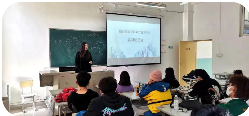
图5 国际教育学院召开实习动员会

在实习开展前，对餐饮管理专业的学生进行实习动员，让学生深知实习对于职业教育的重要性，懂得实习对自身未来发展的重要意义，了解实习的具体要求与重要意义。