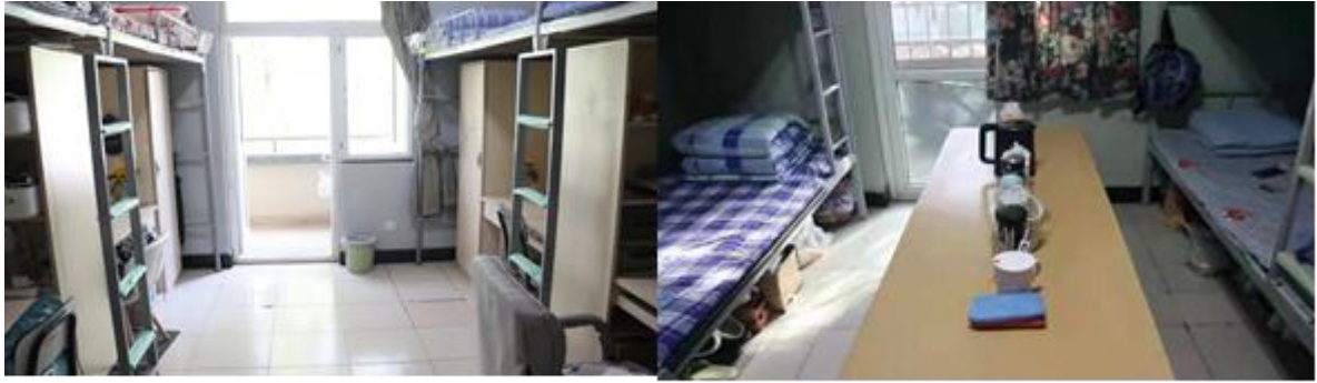
图 6 宿舍情况