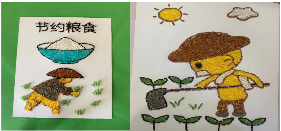
图1 学生们自己动手制作的宣传画

学院团委结合“世界粮食日”，面向全校师生开展了“节粮爱粮”主题教育活动。在此次活动中，有部分同学表示这是自己第一次知道有这样的纪念日，也使不少同学将“节粮爱粮”的观念付诸于自己的日常生活之中。通过这次主题教育活动，使同学们增进了对“世界粮食日”以及世界粮食现状的认识与了解，面对全世界粮食供应日益短缺这样的事实，作为当代大学生更应承担起节约粮食，爱惜粮食的社会责任，同时呼吁大家节约粮食，拒绝浪费，反思一粥一饭的来之不易。“节粮爱粮”不仅仅是一种口号，我们希望它是一种情结，铸与我们每个人的心中，将自己的言辞付诸于实践之中，自觉做到节约粮食，从我做起。