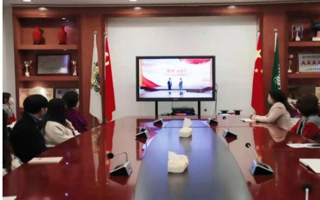
图 4 党史学习

我院现有在校学生 1504 人，递交入党申请书的人数达 435 人，现有学生党员 8 人，隶属于学生党支部。在学院工作中，学生党支部发挥了基层党组织的战斗堡垒作用，大学生党员是学院学生中的骨干力量，成为学院学生中最具感召力、凝聚力和影响力的优秀群体。学院党委会定期组织学生党员、入党积极分子开展形式多样的为学习、宣传、教育活动。