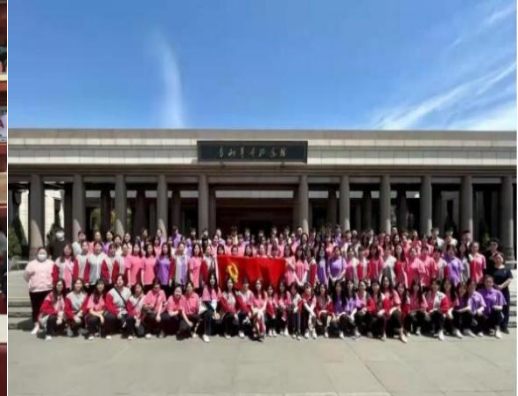
图 5 参观香山革命纪念馆