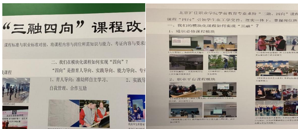
图 13 三融四向课程体系

学院积极推进各专业模块化课程体系建设。2018 年教师学院申请了北京市职业教育改革项目，即“学前教育专业‘三融四向’课程体系的研究与实践”。2019-2020 学年，教师学院在课题研究的基础上，深化课程教学改革，拆分教学计划，重点组教学模块，设计模块化课程体系。强化以幼教岗位工作为导向，以能力为本位，以单元主题教学为载体的“三融四向”课程建设。目前“三融四向”课程建设做到专业课中全覆盖，取得显著地成效。通过构建并实施“三融四向”模块化课程体系，实现专业教学过程与生产过程无缝对接。