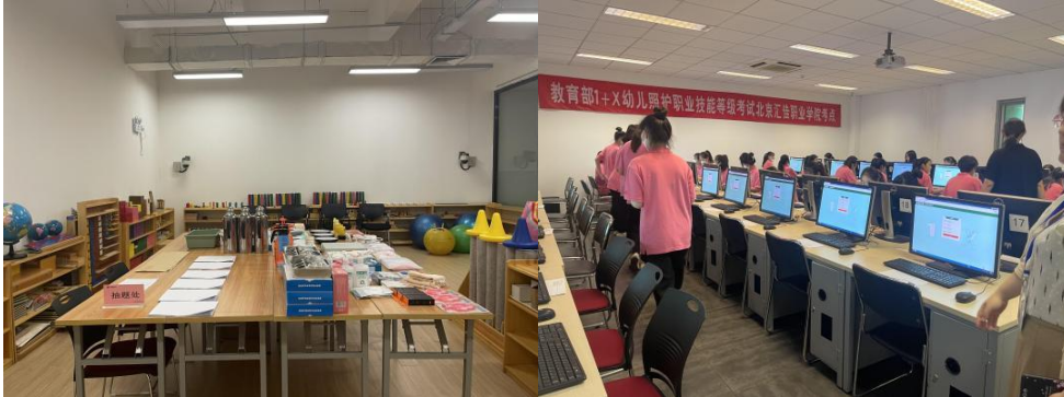
图 15 “1+X 幼儿照护”职业技能等级证书考核

基础上，研究确定已经纳入教学的和将来能够在教学中完成的 1+X 证书等级标准内容，并转化为专业（核心）课程纳入专业课程体系，根据证书要求着手制定专业课程标准，对接职业岗位，推进课证融通的课程体系改革，加强课程建设。