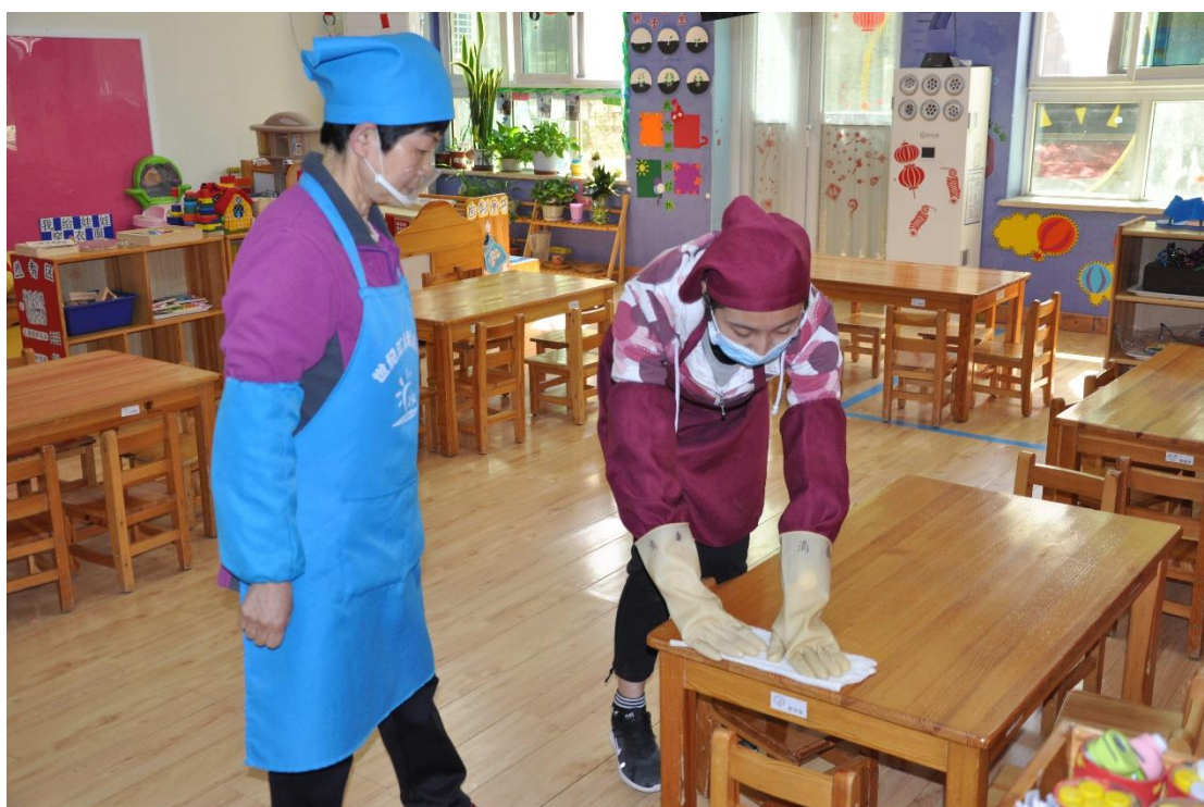
图 10 跟岗实习-拜师仪式

(2) 影视动画专业群采用“项目引领，任务驱动”工作室人才培养模式；将真实项目引入教学过程，通过完成典型的工作任务，培养学生的职业素质，提高学生的职业技能，根据完成任务的质量评价学生学习的成效。根据影视动画专业群各专业工作室的教学特点，引领教研团队坚持实训与大赛相结合，教学成果丰硕，近年来学生获奖一百多项。