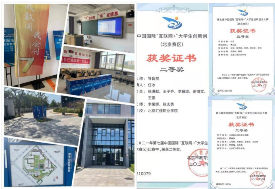
图 9 互联网+创新创业大赛获奖

第七届中国国际“互联网+”大学生创新创业大赛北京赛区职教赛道已于 7 月 11 日圆满落幕。我院人工智能工程师学院李荣辉老师积极组织师生参加了比赛。经过组委会专家们的严格审核，提交北京市教委审批，最终我校获得了一个二等奖和一个三等奖的优异成绩。