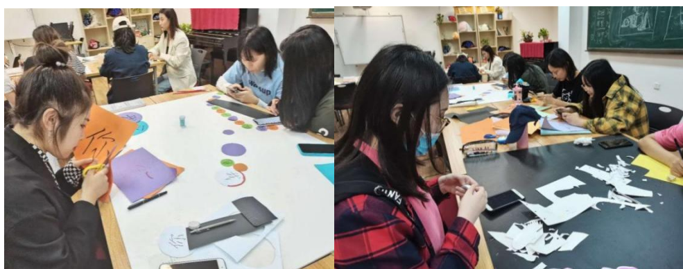
图 14 “爱国”单元主题探究式教学

2021 年教师学院积极开展单元主题探究式教学改革，开展了“爱我中国”单元主题教学。在教学组织过程中，教师通过集体备课，将“爱国”作为本学期的首个单元研究教学主题，目的是厚植准幼儿教师的爱国意识，旨在培养爱国爱家的社会主义可靠接班人。教师们运用 IB 教育探究式教学，启发学生借助探究学习六步法，深入挖掘“爱国”这一主题。首先通过话题“什么是爱国精神？”导入主题，从不同的角度对爱国的内涵进行了讨论，之后学生们走出课堂，联系实事，去发现社会生活中更多的有关爱国的行为。最后通过演讲、表演和海报等方式将自己的发现进行了展示，在老师引导下，准幼师们进一步联系自己的未来职业，共话新时代准幼师的爱国报国、爱岗敬业情怀”。