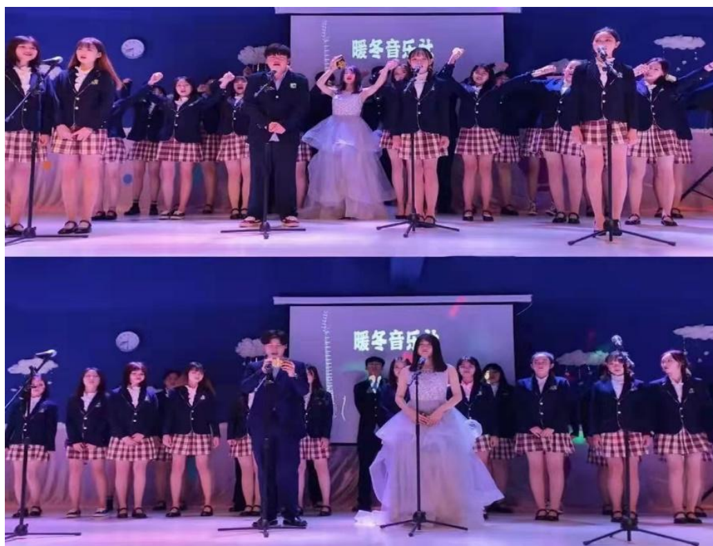
图 2 期末音乐汇演/钢琴基础知识讲座