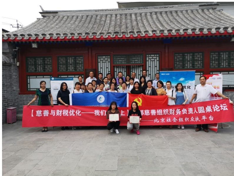
图 11 首都慈善圆桌论坛