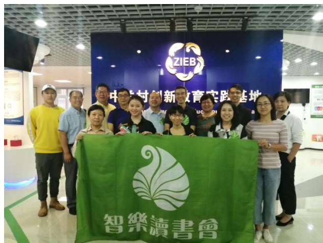
图 14 公益读书会志愿服务-教育与实践