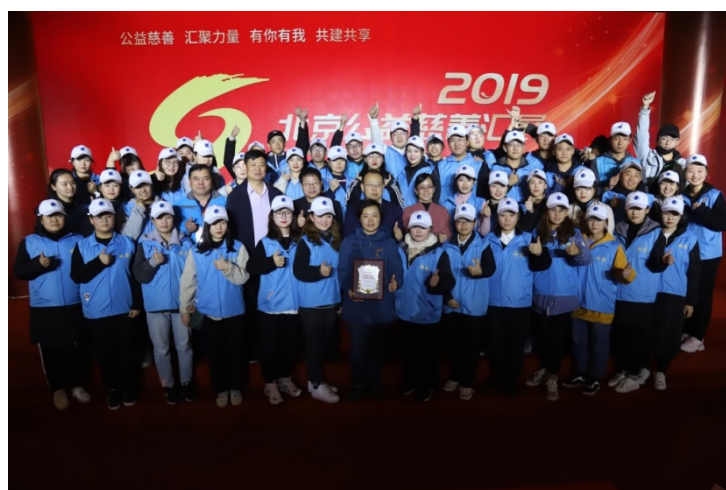
图 15 2019 年北京公益慈善汇展志愿服务

2019 年 9 月在中共北京市委社会工作委员会北京市民政局民非处领导的见证下，北京市科协科技社团服务中心向校企共建定向培养“社会组织财税人才培养项目”授予了“北京科技社团改革示范园区培训基地”称号，再次提升了该合作项目的社会服务功能。