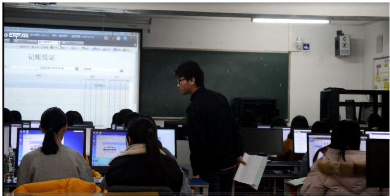
图 4 财务数据的平台操作与指导