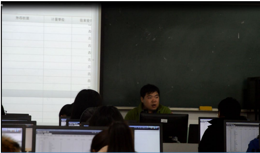
图 5 真实业务的处理思路分析

在数字化专业教学环境，知诚会邀请的民政局财税专家教师们打破了传统的教材知识讲解顺序，按照相互独立但又有联系的任务模块开展教学，引导学生在处理业务中学习相关的理论，形成了“操作演示——任务下达——小组尝试——教师评价——知识提炼——案例推广创新”的教学方式。整个教学过程取缔了教材内容的“填鸭式”教学，而是根据学生学习情况和需求“释放”知识。同时，在此过程中教师就已经随同学的学习进程完成了各任务点和知识点的考评，使得课程的考核成绩更匹配学生技能的掌握水平。