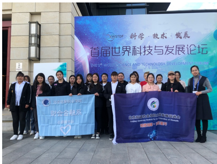
图 12 世界科技与发展论坛