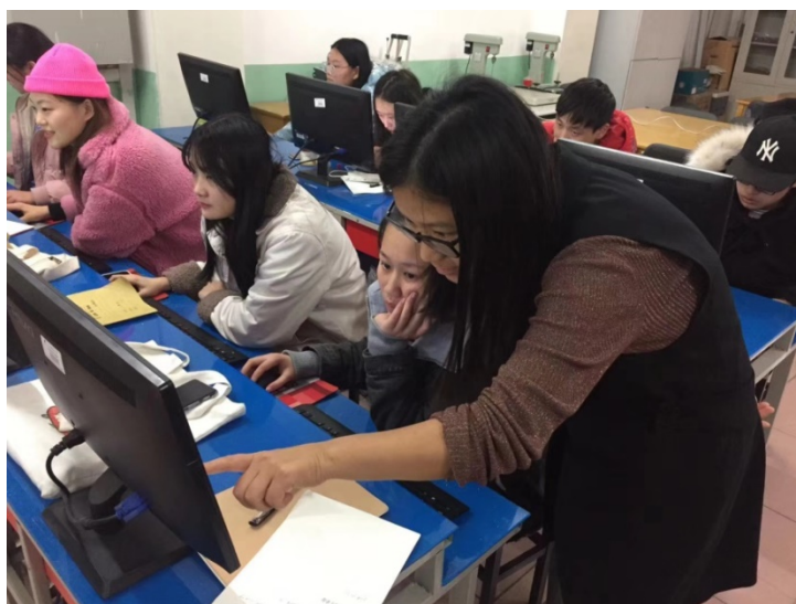
图7 一线企业教师指导小组完成任务