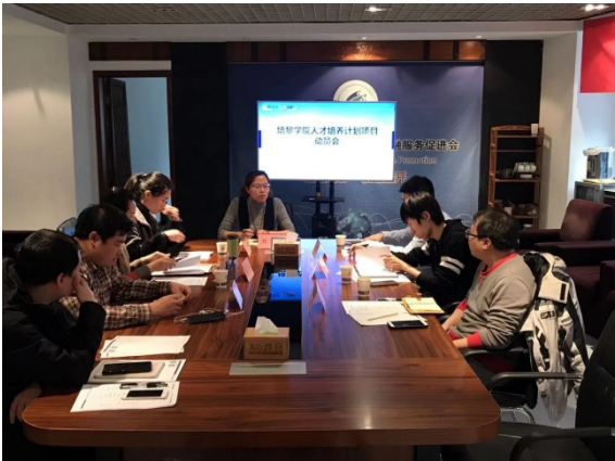
图1 校企教师沟通会

在校企合作过程中，专业教师通过参与社会组织项目执行和业务阶段审核工作等实践形式，深入了解了社会组织主要业务活动和财税管理情况，直接接触到了“一手”教学资源。教师再利用自身的专业知识通过问题诊断、专题讲座等方式帮助和指导社会组织解决实操中存在的问题，推动社会组织合法、健康经营。