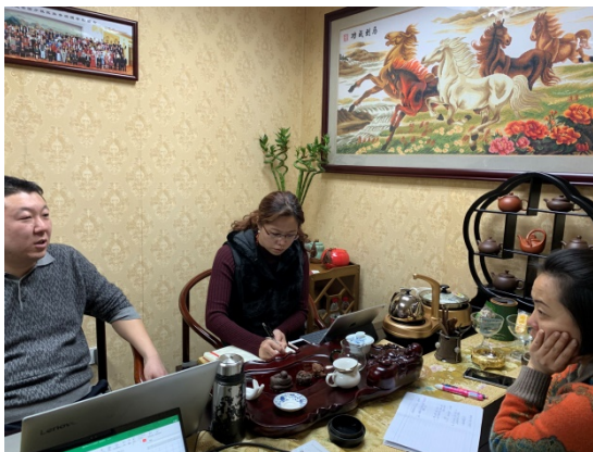
图2 校企双方对接商讨课程内容的调整

教师在此基础上根据社会组织实际财税技能需求优化了“行业会计实务”、“成本费用核算”、“纳税实务”等课程的讲授内容。除了保留必要的企业财务会计知识外，课程教学内容以适合社会组织财税管理为出发点进行了修订。