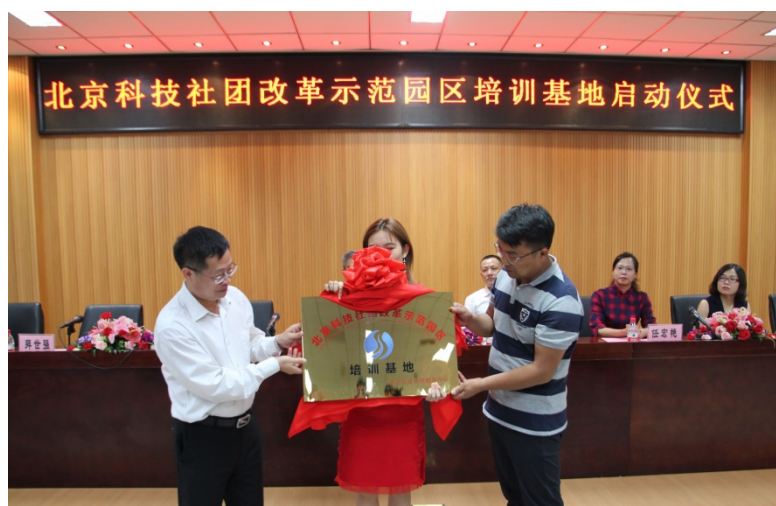
图 16 北京科技社团改革示范园区培训基地启动仪式

2019 年 9 月在中共北京市委社会工作委员会北京市民政局民非处领导的见证下，北京市科协科技社团服务中心向校企共建定向培养“社会组织财税人才培养项目”授予了“北京科技社团改革示范园区培训基地”称号，再次提升了该合作项目的社会服务功能。