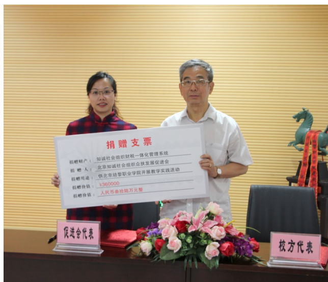
图3 36 万元数字化教学系统的捐赠与安装调试

为了让人才培养的进程快速适应社会组织财税岗位的用人需求，由知诚会向学院捐赠了价值 36 万元的“知诚社会组织财税一体化管理系统”为校内会计专业实训室营造了数字化专业教学环境，并聘请到了北京航天金税技术有限公司技术开发人员担任主讲教师，讲解了系统可实现的财税融合的管理功能，并通过指导学生在该系统上对往期真实财务数据的处理，使学生不仅体验到了数字经济时代的财务核算新方式也直观认识到大数据时代的数据共享效果。