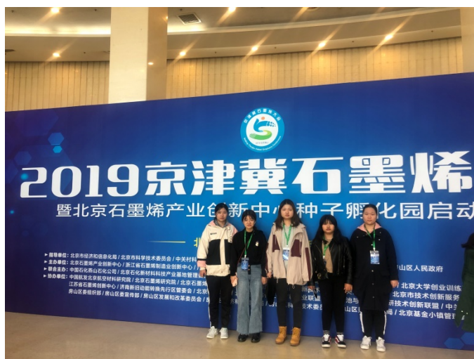
图 13 2019 京津冀石墨烯创新大会