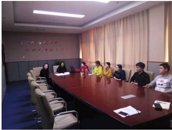
长友养老院院长听取学生汇报

结合北京青年政治学院志愿服务、小学期、顶岗实习、综合实习等实习手段，为学生搭建了多元的实习平台，为学生成才就业奠定基础。志愿服务围绕中国传统节日中文化因子，培养学生尊老敬老孝老的人文素养；小学期强调专项技能的实习，顶岗实习和综合实习则强调学生为老服务综合能力的提升。