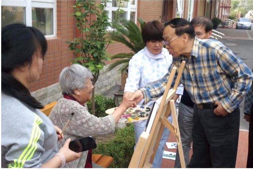
原民政部副部长李宝库莅临长友指导工作