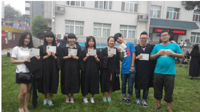
“长友培训学院”助力学生取得高级养老护理员职业资格证书

长友养老院借助“长友培训学院”，围绕学生在未来工作场域中的典型工作和核心技能，对学生进行通用实操培训和专项技能培训，将证书要求的技能与课程有机结合，通过课证融合，学生在通用职业技能证书，如养老护理员职业资格证和专项职业技能证书，如认知症照护等级证书，有机结合起来，并通过严格考核，学生职业资格证书获取率达到了 100%。