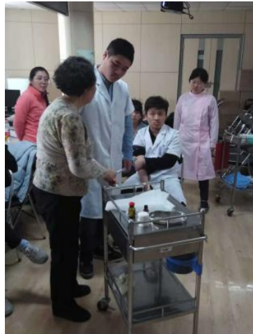
企业行家现场指导学生 实操技能