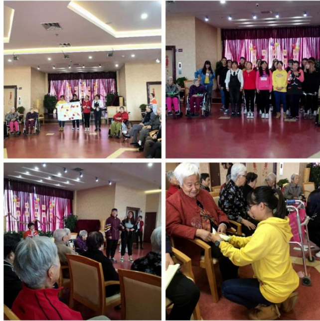
北京青年政治学院 2018 大一新生开展重阳节活动