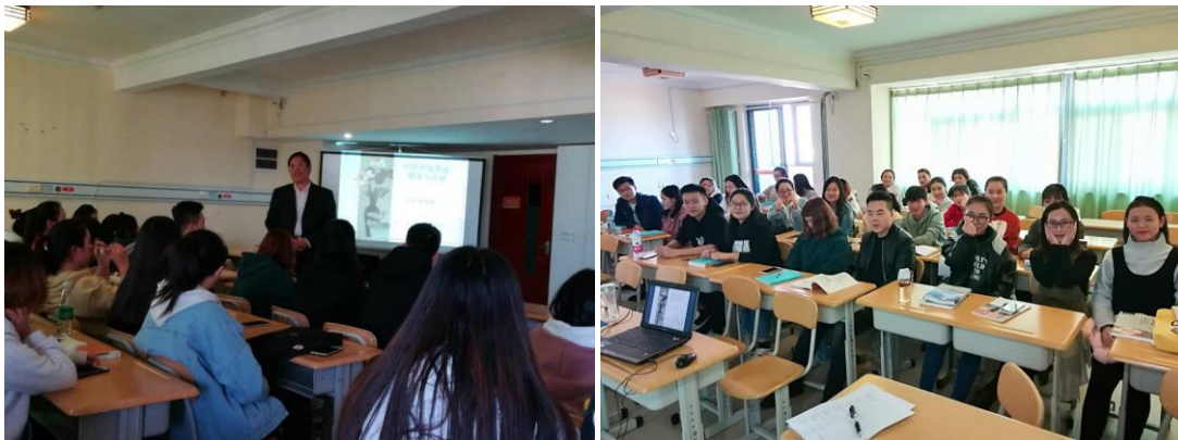
图 3：“山东颐和华龄”订单班学生授课情况