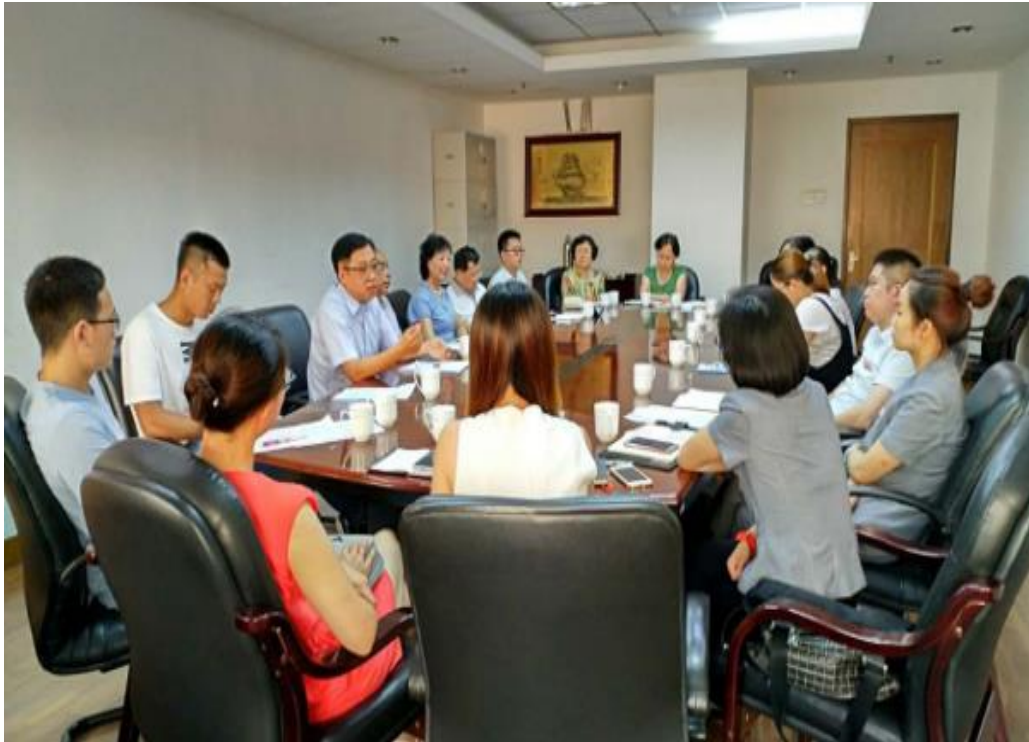
图 1：青岛市长期照护协会、北京社会管理职业学院老年福祉学院联合召开的老年服务与管理专业“现代学徒制”教学实践工作会议（青岛）