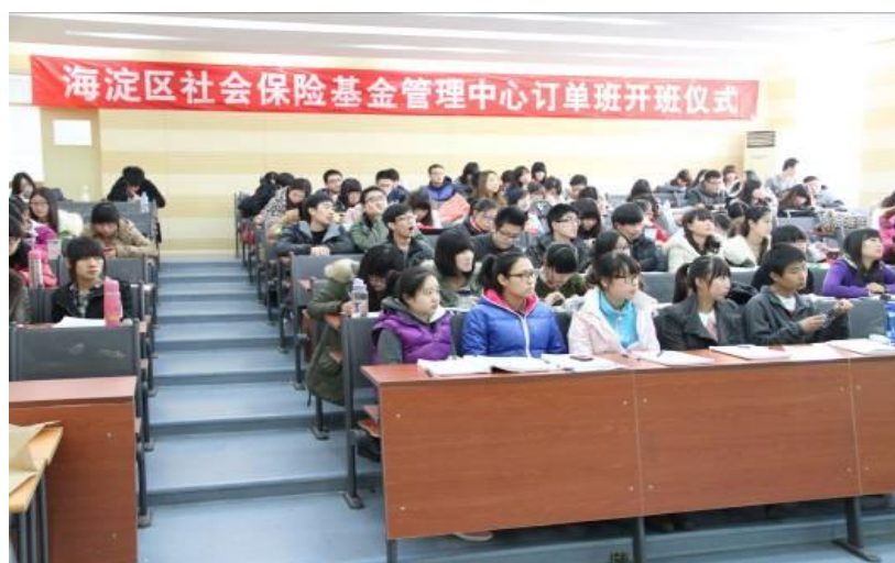
图 1： 海淀区社保业务经办机构的订单班如期开班

海淀社保中心基金管理中心与北京劳动保障职业学院为友好合作单位，双方教职工业务合作高效。北京劳动保障职业学院积极邀请海淀社保中心基金管理中心的相关业务负责人为在校学生培训授课，给在校学生们带来了具体的工作内容，深受学生好评。海淀社保中心继续与北京劳动保障职业学院开办订单班，以保障海淀社保中心的用工需求。