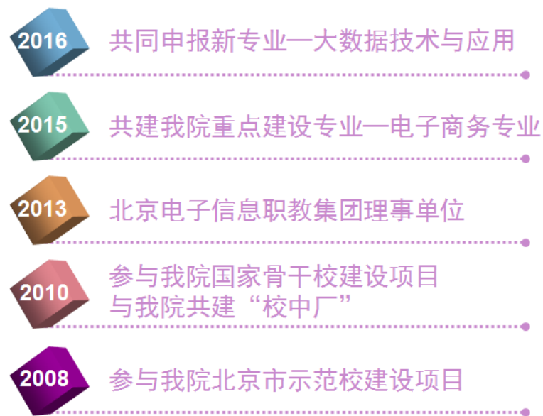
图 1 企业参与办学历程

截至 2016 年，公司与北京信息职业技术学院合作培养电子商务专业和计算机信息管理专业学生 500 余人；我院在“十二五”期间作为电子信息类教师培训基地，公司与我院计算机信息管理专业教学团队合作，承担了北京市相关专业师资培训 5 期。同时，校企合作产生了一批建设成果，《“校厂合一、学训交替”电子商务专业人才培养模式改革创新》项目获北京市高等教育教学成果二等奖。